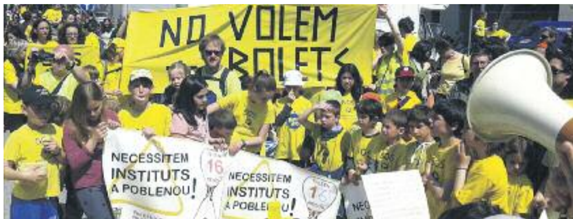
Els manifestants van exigir els dos nous instituts per guanyar noves places de secundària.