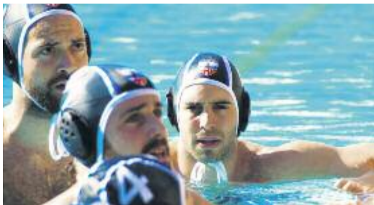
L'Enginyers va jugar el seu últim partit de lliga el passat 25 d'abril.

Tanmateix, l'entitat assegura que té "la ferma voluntat" de mantenir l'activitat de les seccions de waterpolo i natació sincronitzada", i garanteix, així mateix, la finalització de la temporada de les categories inferiors "amb normalitat". De tota manera, la directiva del club del Poblenou no aclareix el futur de la