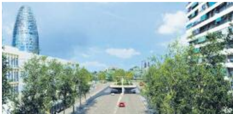
Aspecte que tindrà la plaça un cop acabin les obres.

El primer tram d'aquestes obres, que ara han començat i que no provocaran afectacions al trànsit, servirà per construir els túnels entre els carrers Casti-