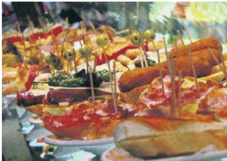
És la primera ruta de tapes conjunta dels comerciants del districte.

De moment, els eixos estan ultimant detalls com els elements de promoció de la ruta i la creació d'una pàgina web que