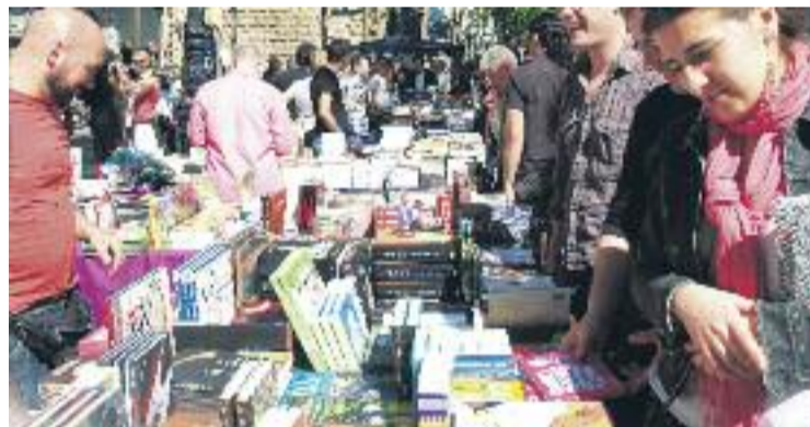
Els llibreters van vendre més d'1,5 milions de llibres.