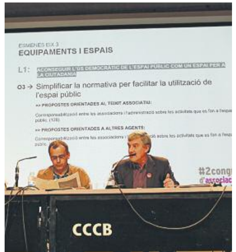
A l'esquerra, integrants d'una associació durant un procés de votació. A la dreta, un congrés del CAB.