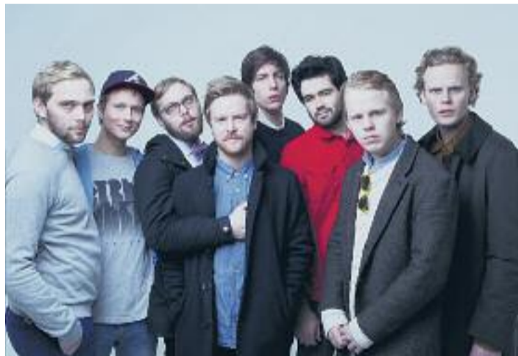
Els noruecs Kakkmaddafakka, l'atractiu principal del festival.