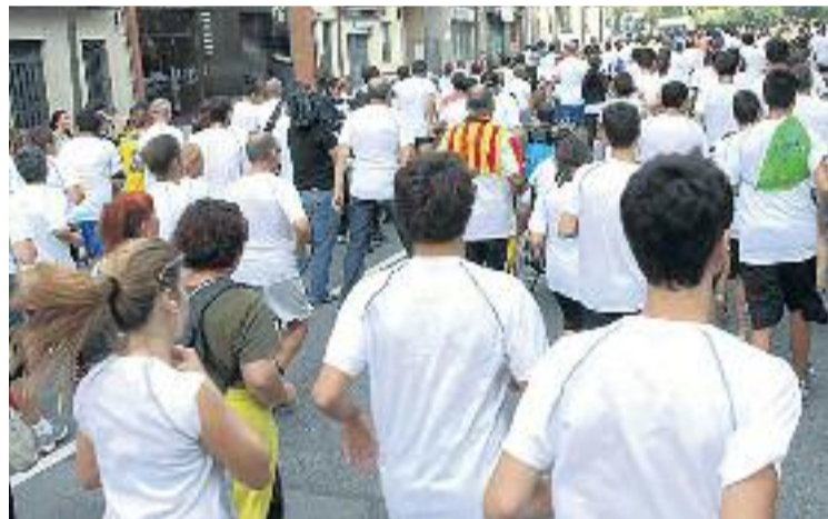
Els atletes recorreran part del front marítim de Sant Martí.

ATLETISME ▶ Sant Martí s'afegeix a la febre del running . El pròxim dissabte 18 d'abril a partir de les 9 del matí, la zona de la Mar Bella es convertirà en un circuit improvisat de 10 quilòmetres per ser l'escenari de la sisena Cursa Intercol·legial, una prova atlètica organitzada per diferents col·legis i associacions de professionals del país, que aprofiten aquesta jornada per fer esport i fomentar la companyonia.