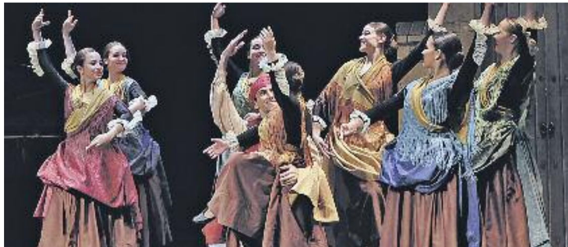
Imatge d'una de les actuacions d'alguns integrants de l'escola.