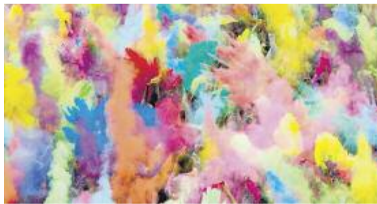
El Clot a Tot Color s'inspira en la festa índia Holi.

FESTA ▶ Per segon any consecutiu, l'Eix Clot portarà els colors de l'Índia al barri de la mà de la seva festa de la primavera El Clot a Tot Color, una celebració que evoca el colorit Holi indi.