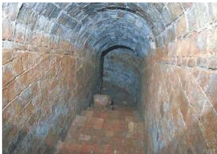
L'entrada del refugi pel carrer Ripollès.

Els tècnics ja van determinar durant les primeres inspeccions que el refugi no complia les mesures de seguretat necessàries per a obrir-lo de forma permanent.