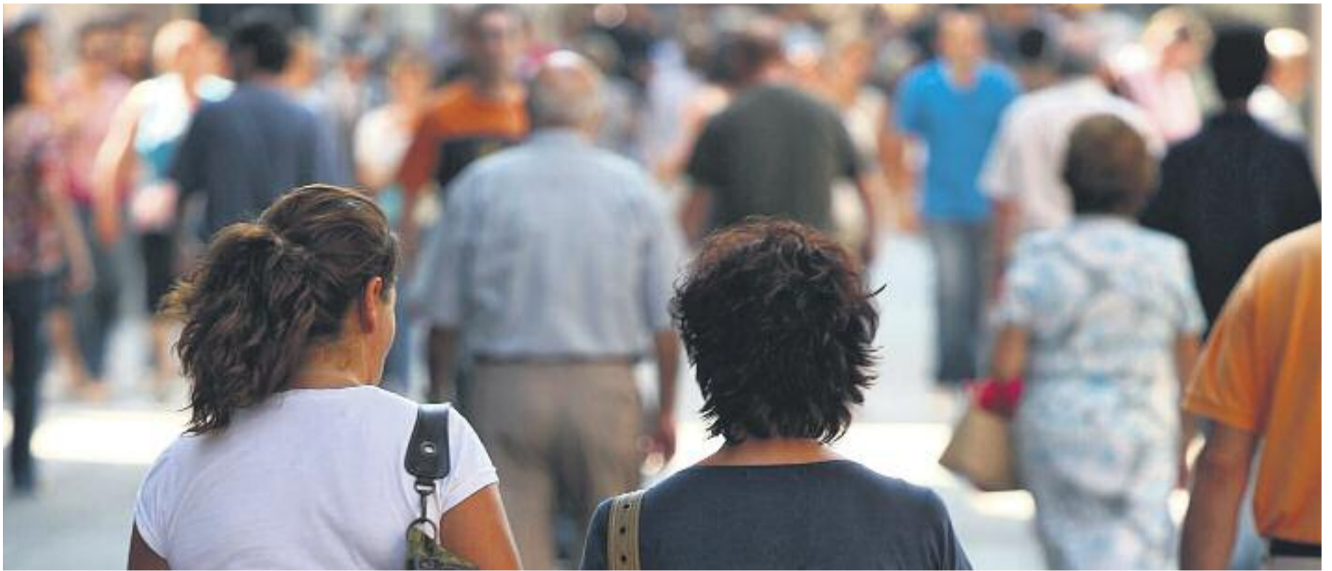
Només quatre de cada deu barcelonins té el català com a llengua habitual.