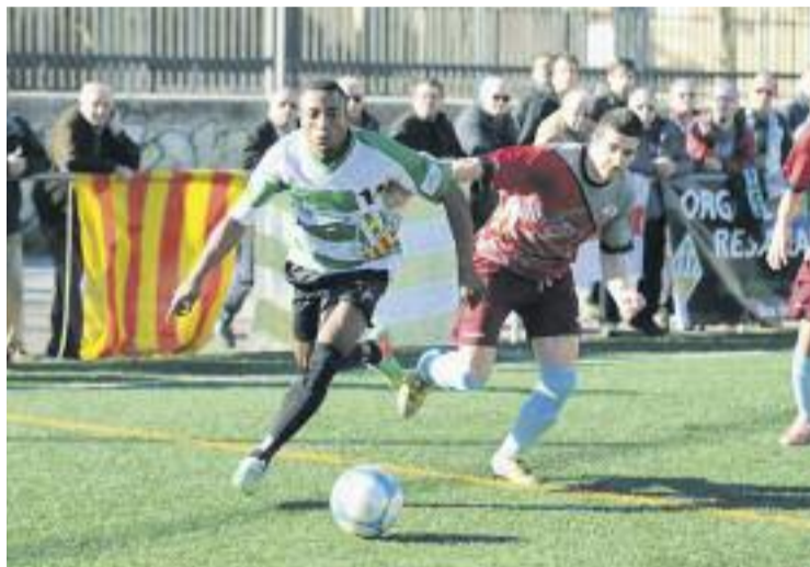
Un dels rivals del Júpiter en els partits restants serà la UE Sants.

D'aquesta manera, el conjunt martinenc té per endavant set partits, quatre com a local i