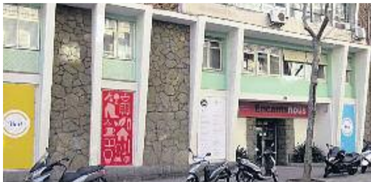
Nova imatge exterior d'Encants Nous.

“Durant 2014 vam fer una anàlisi de la nostra activitat comercial i de les preferències dels nostres clients, i vam arribar a la conclusió que necessitàvem fer un canvi al nostre espai comercial”, expliquen a Línia Sant Martí des d'Encants Nous. Arran d'aquesta iniciativa, des de l'associació “es van analitzar quins eren els principals defectes i prioritats per al centre”, un espai de prop de