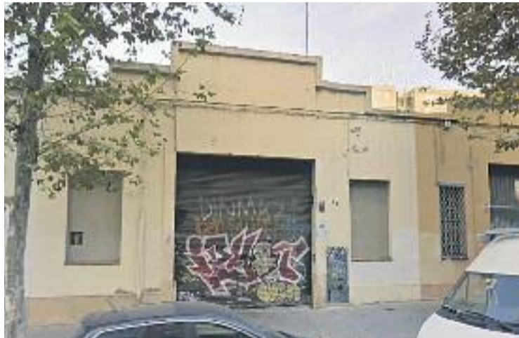
La nau estava ocupada per un total de nou persones.

A l'interior de la nau hi vivien nou immigrants -vuit d'origen romanès i un d'origen maurità- que es dedicaven a la recollida de ferralla. Segons va informar BTV, el desallotjament va començar a primera hora del matí quan diversos efectius de la Guàrdia Urbana van entrar a la nau davant el risc d'incendi que hi havia. Un informe dels bombers, fet després que la propietat denunciés l'ocupació el passat mes de juny, ja havia alertat que els ocupants tenien l'aigua