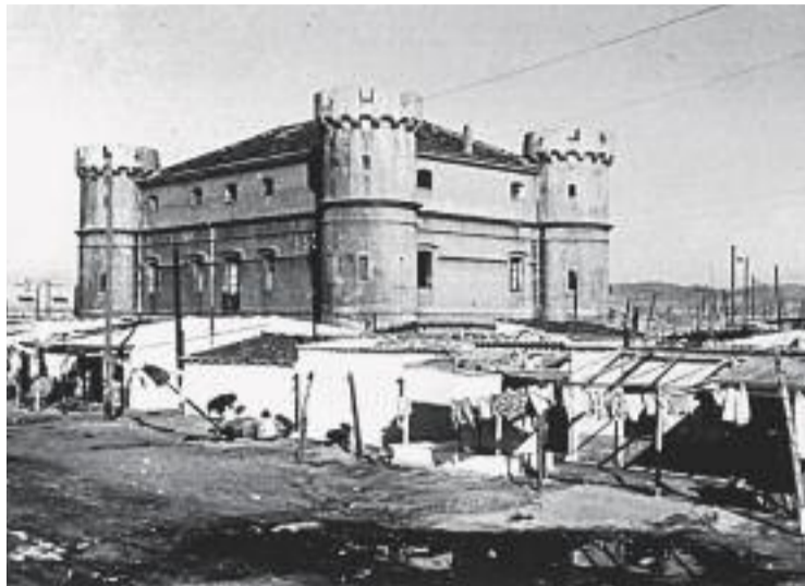
Imatge del castell de les Quatre Torres del Camp de la Bota.

El lloc escollit per a la ubicació de la placa no és casual, ja que ha estat col·locada a la zona que correspon a l'emplaçament d'una de les construccions més característiques del Camp de la Bota, el castell de les Quatre Torres. El text commemoratiu condensa la història d'aquest barri: "El barri de barraques del Camp