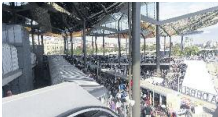
Els congressistes visitaran els Encants el pròxim 27 de març.

El congrés també comptarà amb visites guiades a alguns mercats de la ciutat, com la programada per al divendres 27 de març al nou edifici dels Encants i que servirà per exemplificar la nova arquitectura que