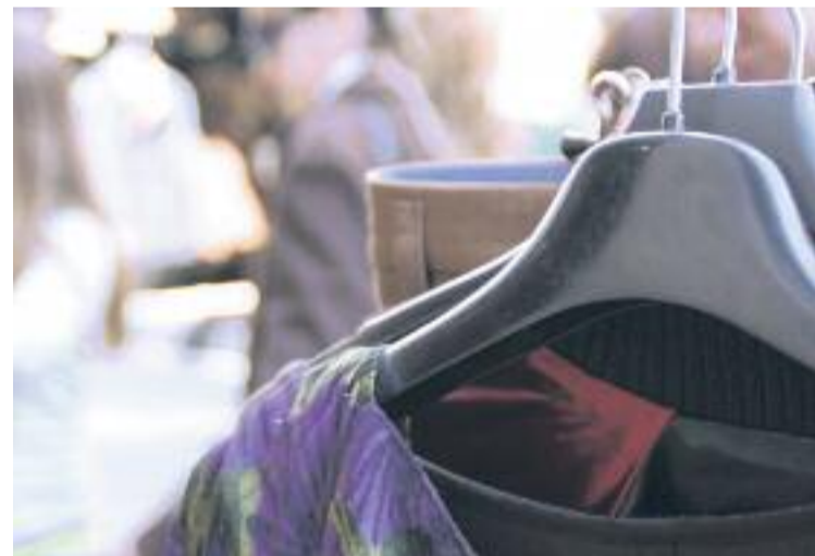
L'Eix Clot clourà les rebaixes dissabte amb el segon Forastocks.