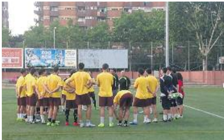
El Júpiter ja prepara el seu pròxim partit contra la UA Horta.