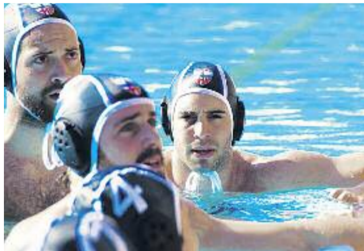
El club ha volgut agrair a la seva afició el suport rebut.

WATERPOLO ▶ No va poder ser. El CN Poble Nou Enginyers va caure als quarts de final de la Copa del Rei de waterpolo contra el CN Mataró per 10 gols a 6 el passat dia 27 a la Nova Escullera. Els martinencs no van tenir el seu dia davant d'un rival que va comptar amb un major encert de cara a porteria.