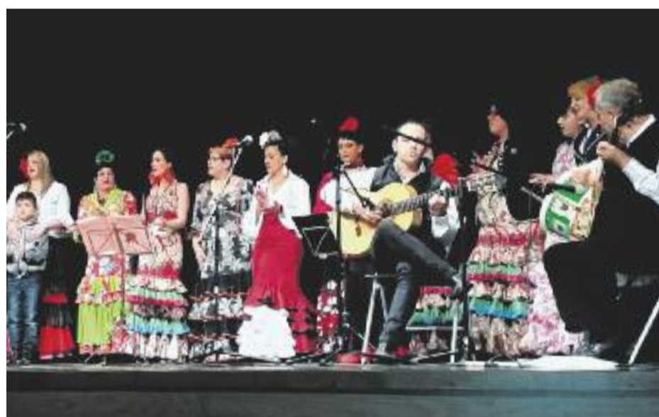
Tres moments de la celebració del Dia d'Andalusia a l'Auditori.