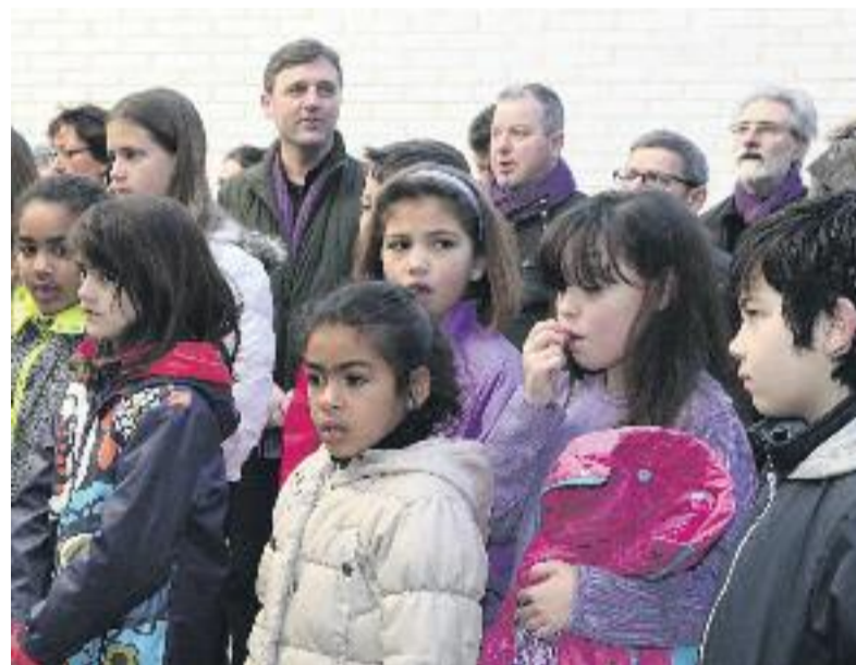
Quatre instants de la diada d'inauguració del nou local de la Coordinadora d'Acció Social del Clot-Camp de l'Arpa.