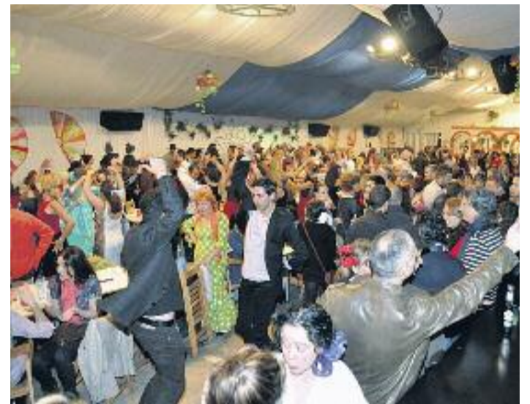
La Feria de Abril, un clàssic de la ciutat.