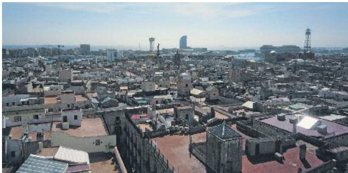
Els ajuts permetran dur a terme les reformes que calguin en edificis construïts abans de 1981.