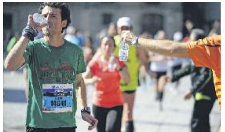
La Marató travessarà Sant Martí de banda a banda.

ATLETISME ▶ Nova cita amb la prova atlètica de llarga distància per excel·lència. La setmana passada es va presentar la 37a edició de la Marató de Barcelona, que tindrà lloc el 15 de març. La competició farà un recorregut pels escenaris més emblemàtics de la ciutat, com la Sagrada Família el monument a Colom o la plaça de Catalunya.