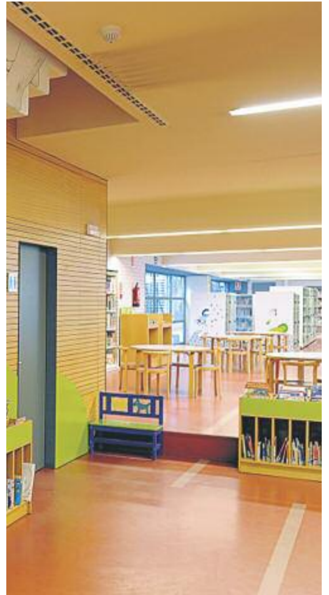
La façana i dos espais de l'interior de la biblioteca.