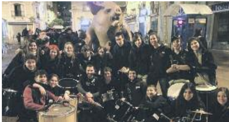
Fi de festa amb el protagonista de la jornada al fons.

Tot i que la festa va començar a les 12 del matí amb diferents taillers infantils i una cercavila, va