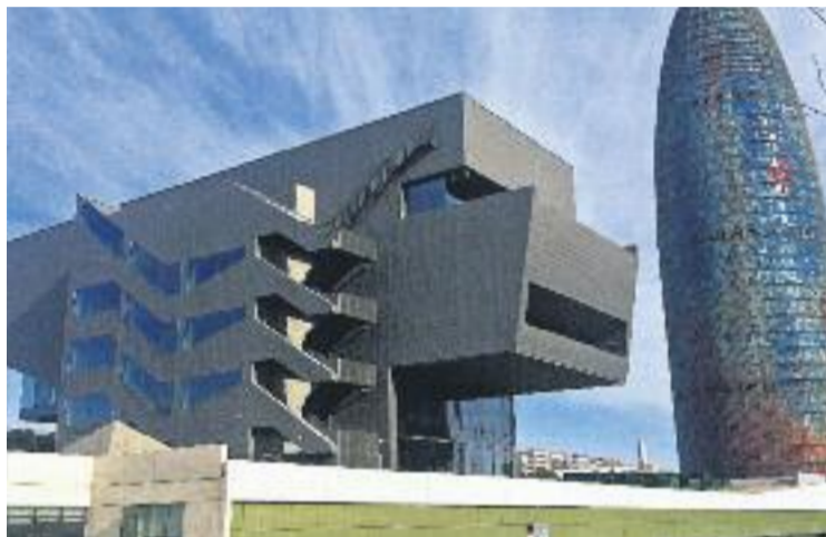
L'edifici DHUB acollirà l'exposició a partir del 29 de gener.