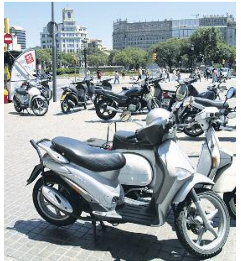
Les motos representen el 30% del parc mòbil de la ciutat i es fan servir en el 34% dels desplaçaments.