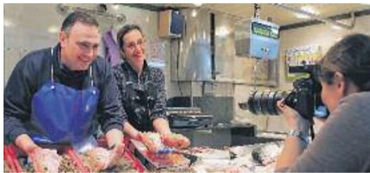
El calendari il·lustrava escenes divertides dels paradistes.