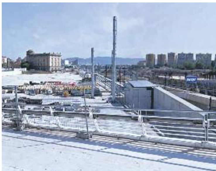
Imatge de la zona on es va produir el robatori.

Quan l'operari de la constructora va veure el detingut i tot el material que portava, el va reconèixer i va denunciar els fets per tal de poder recuperar tot el material.