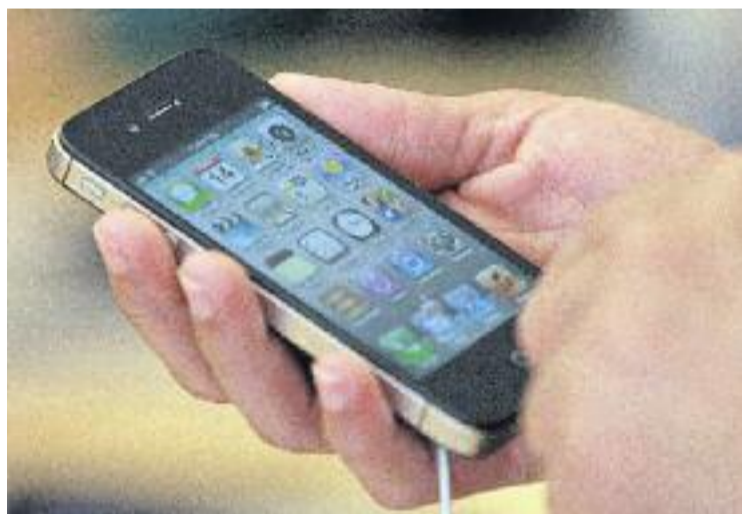
El projecte vol geolocalitzar prop de 4.000 botigues de la ciutat.