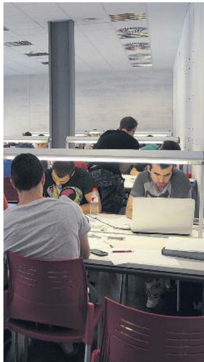
El mapa de les sales habilitades a la ciutat i una imatge de diversos nois estudiant.