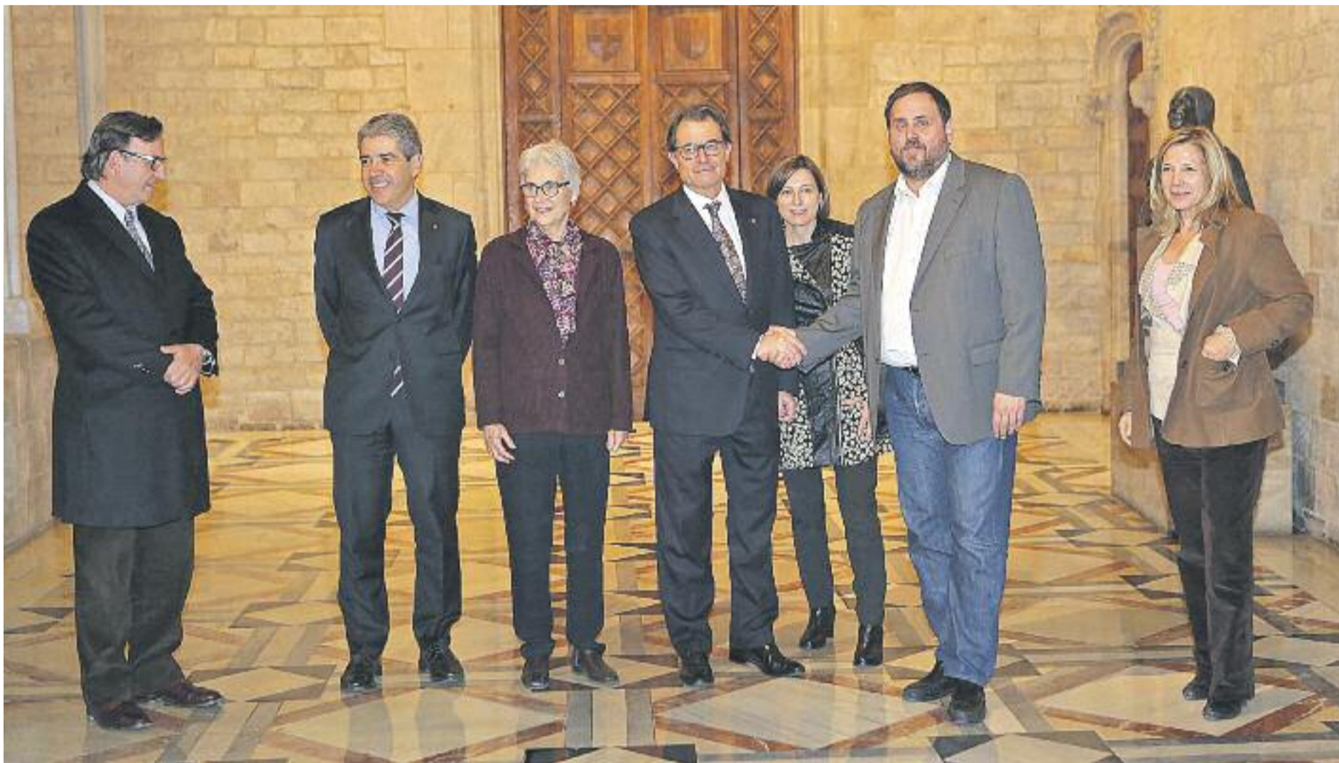
Mas i Junqueras van tornar a protagonitzar una imatge d’entesa el passat dimecres 14 de gener.

» Mas i Junqueras refan la unitat “per portar el procés de transició nacional fins a la victòria” » L’acord prioritza la creació d’estructures d’Estat des d’ara fins a les eleccions del 27 de setembre