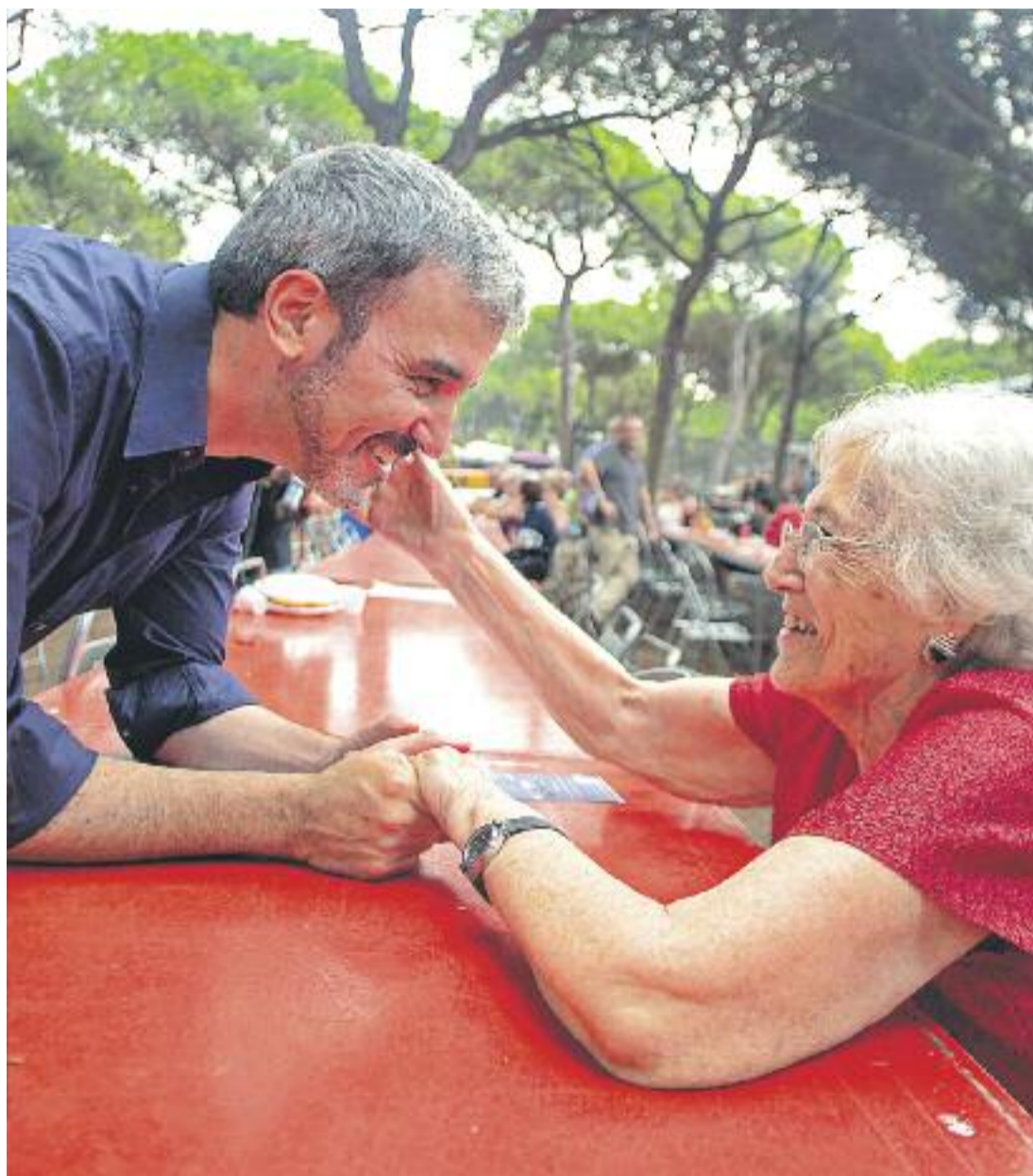
L'alcalde socialista Jaume Collboni considera que el transport públic “no pot ser un bé de luxe”.

Per primera vegada els usuaris no han fet cues abans d'acabar l'any per comprar la T-10, el títol de transport més utilitzat de l'Àrea Metropolitana. I és que, també per primera vegada, es rebaixa el preu de la targeta. En concret un 3,4%, passant dels 10,40 euros que costava al 2014 als 9,95 euros que es paguen a partir d'aquest mes de gener. Jaume Collboni, alcalde socialista a Barcelona, ha assegurat que “aquest és el primer pas en les meves prioritats, fer una Barcelona a l'abast de tothom. La solvència de l'Ajuntament s'ha de posar al servei dels ciutadans i ciutadanes, i és això el que he fet, aconseguir una rebaixa en el preu del transport públic”.