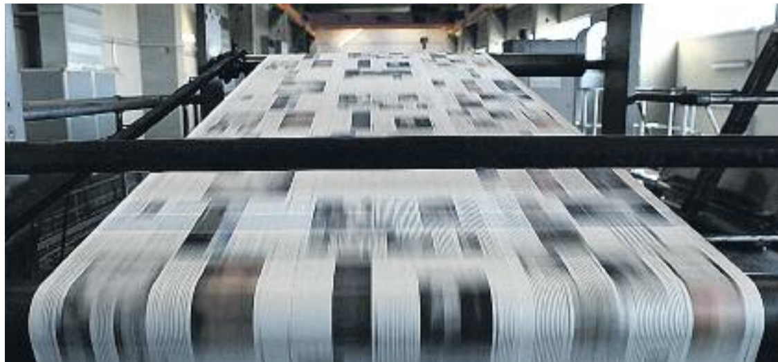
Línia és la capçalera gratuïta local no diària amb més difusió de Catalunya.