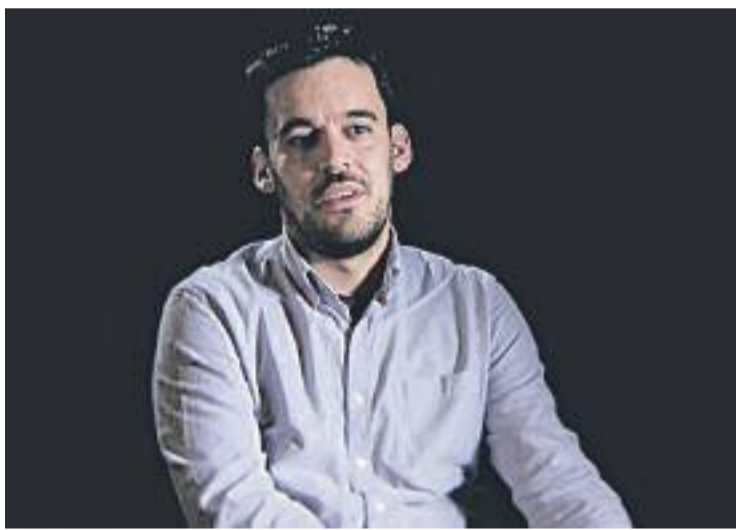
Samuel Aranda, guanyador del World Press Photo 2012.

L'exposició presenta una selecció dels treballs realitzats pel grup de participants del Centre Cívic i documenta el procés del projecte. Es podrà visitar fins al 4 de març.