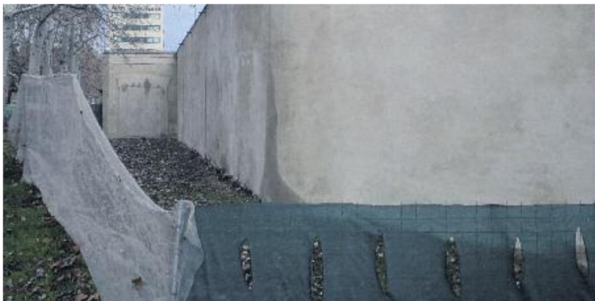
La façana, l'entrada al recinte i part del mur del Cementiri del Poblenou.