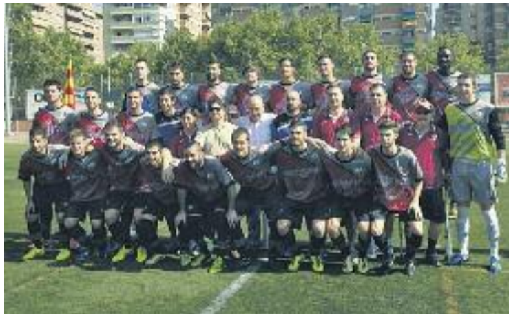
El Júpiter està completant una gran temporada.

Tot i així, el balanç dels gris-i-grana a la competició regular és