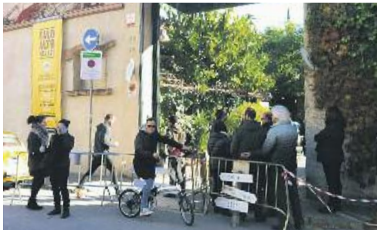
Un dels accessos durant els dos dies de mercat.

A la segona va la vençuda. El Palo Alto Street Market es va poder celebrar aquest passat cap de setmana amb normalitat al Poblenou. Amb la presència de 10.000 visitants, una xifra que va convertir la cita en un èxit absolut, el mercat va presentar alguns canvis en el seu funcionament, com ara el cobrament d'una entrada de dos euros i un desplegament de seguretat especial. D'aquesta manera els organitzadors del mercat van respondre a la cancel·lació de la primera edició -un cop celebrada la primera jornada-, del cap de setmana del 6 i 7 de desembre, a causa d'una inesperada afluència de gent i de la manca de permisos dels organitzadors per tal de poder celebrar el mercat.