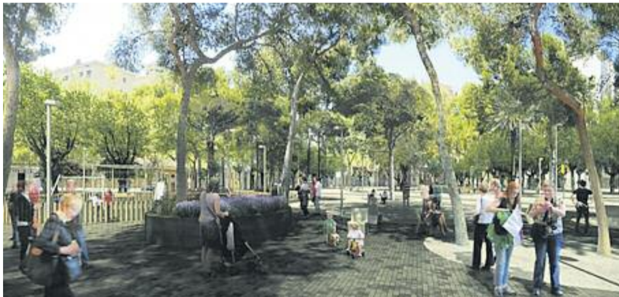
A l'esquerra, una imatge actual del carrer. A la dreta (a dalt i a baix), recreacions virtuals de com quedarà la via remodelada.