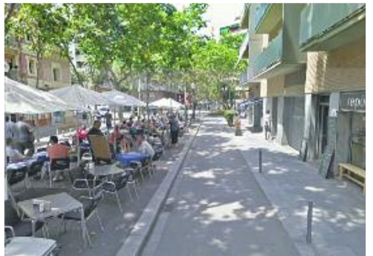
La renda per càpita del districte és de 15.115 euros.

L'estudi mostra com les classes mitjanes, que el 2007 representaven el 58,6% de la població, eren el 44,3% el 2013. Tot i que la classe mitjana és majoritària, l'informe mostra com en els darrers anys les rentes baixes han crescut "de forma sensible".