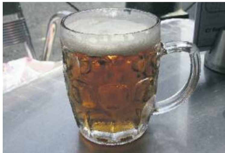
La iniciativa repartirà posavasos a bars del Besòs-Maresme.