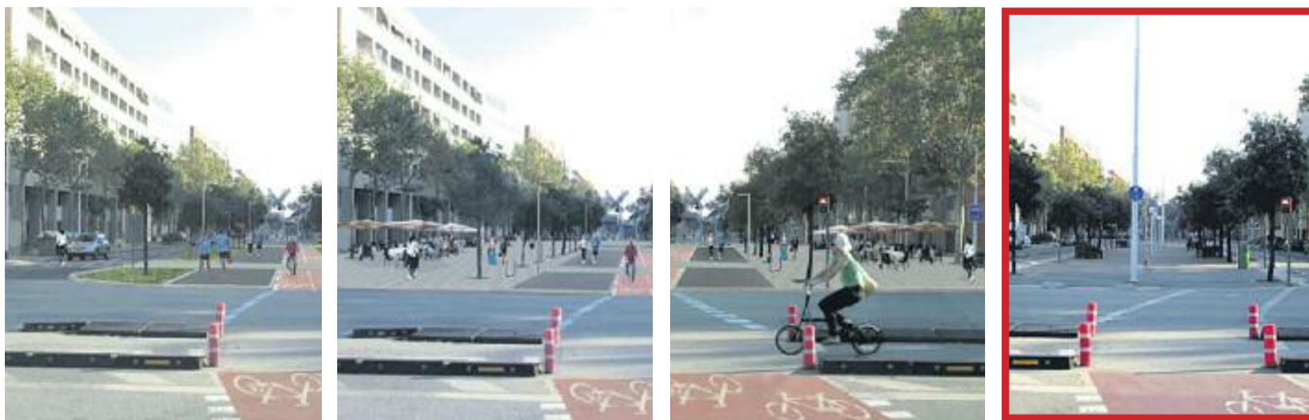
A dalt, una imatge actual de l'avinguda Icària. A sota, les quatre opcions de remodelació, amb la que finalment s'ha escollit destacada en vermell.