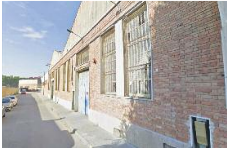
Imatge de la nau que ocupaven el grup de subsaharians.

El detingut, de 24 anys, amb nacionalitat espanyola i veí del districte, hauria extorsionat durant els darrers mesos al grup de subsaharians amb un lloguer de 40 euros per tal que poguessin viure a la nau. El passat 16 de desembre el detingut es va presentar a la nau per exigir al grup de subsaharians l'import, però els ocupants del local s'hi van negar per considerar que encara no havien de pagar perquè no era fi-