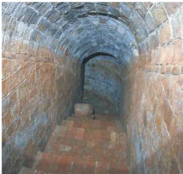
L'entrada del refugi pel carrer Ripollès.