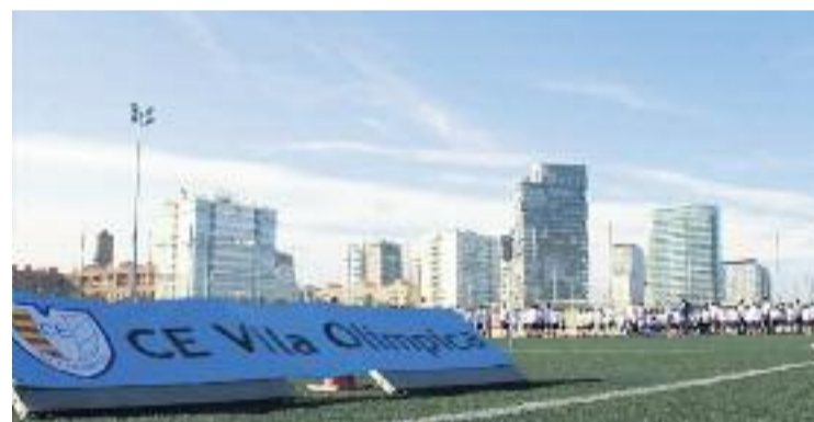
El CE Vila Olímpica aplega més de 800 infants.

CELEBRACIÓ ▶ Deu anys portant l'esport als infants del barri. El Club Esportiu Vila Olímpica organitzarà una festa d'aniversari el pròxim mes de juny, en un acte que vol celebrar els 10 anys de vida de l'entitat i posar fi a una temporada molt especial per a aquesta entitat del districte de Sant Martí.