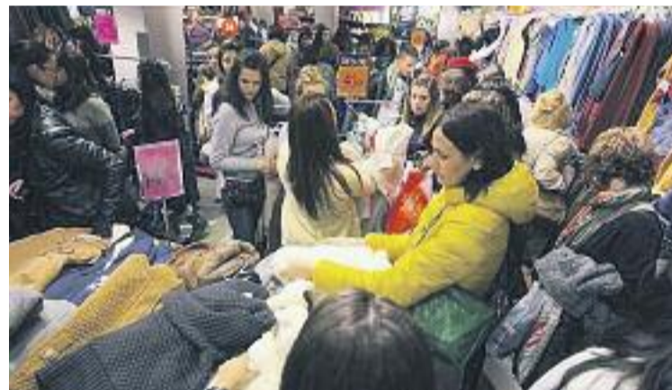
Les vendes durant els festius d'obertura de 2014 van ser limitades.

D'aquesta manera, de cara al 2015, Barcelona manté els 8 dies festius que estableix la Generalitat i n'escull dos que cauen en dates assenyalades en el calendari festiu local: el 29 de novembre -inici de la campanya de Nadal- i el diumenge 13 de desembre -en plena campanya natalenca de vendes-.