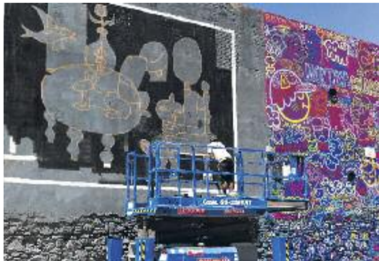
El projecte Big Waalls busca promocionar els artistes locals.