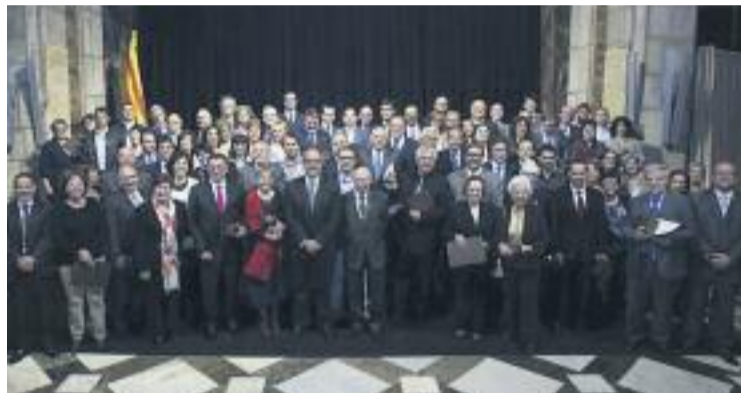
Els guardonats durant l'entrega de premis.

Un nombre important dels guardonats són establiments, associacions i iniciatives de la ciutat de Barcelona, que compta amb una oferta comercial ba-