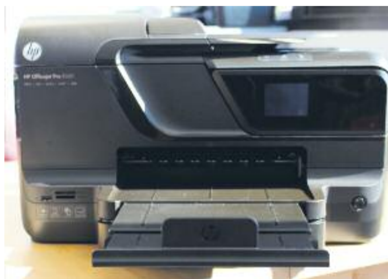
L'Escola La Pau s'ha vist beneficiada d'un servei comunitari d'HP.