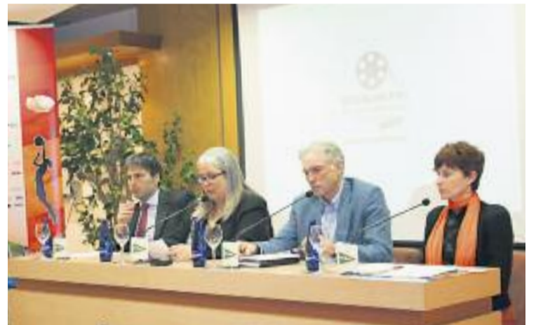
Presentació del cicle de cinema esportiu.

CONCURS ▶ El Museu Olímpic i de l'Esport Joan Antoni Samaranch (MOE) i la Sala Àmbit Cultural d'El Corte Inglés seran les sales de projecció del ja emblemàtic certamen cinematogràfic de temàtica esportiva BCN Sports Film , que tindrà lloc entre el 7 i el 10 de maig.