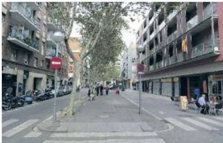
Encara falta per decidir el paviment i l'arbrat del tram a remodelar.

Aquesta jornada, tal com expliquen des de Fem Rambla en un comunicat, ha de permetre que l'Ajuntament expliqui el projecte de reurbanització de la Rambla del Poblenou entre Taulat i Passeig Clavell, "un projecte que ha recollit bona part dels plantejaments del document final de propostes de Fem Rambla". A més, també ha de servir per consensuar els aspectes que