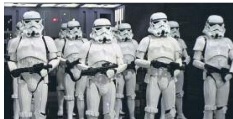
Darth Vader va passejar la seva força pels Encants.

L'exposició estava formada per diorames i figures a mida real sobre les pel·lícules del director George Lucas. Pel que fa a la desfilada, l'Spanish Garrison és una associació que ja ha participat en esdeveniments similars com el festival de Cinema Fantàstic de Sitges, entre altres.