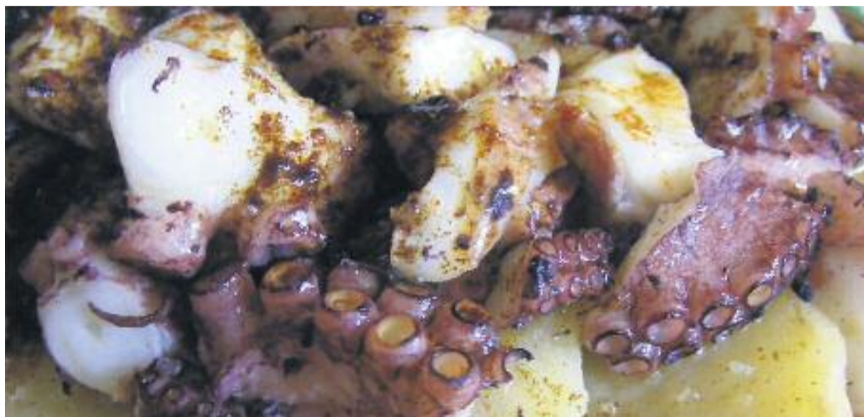
El folklore gallec i la seva gastronomia, dos dels elements del Festival Galego.