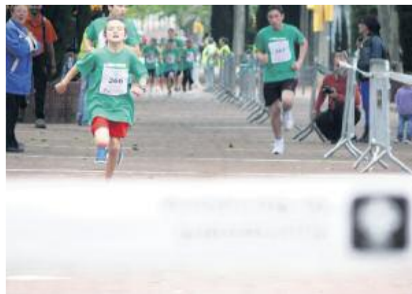
La cursa de l'any passat, la primera que es va celebrar, va ser tot un èxit de participació.