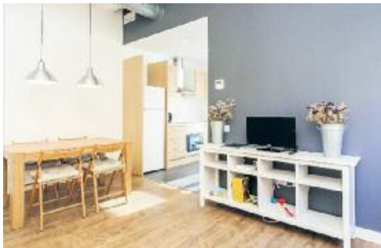
L'Ajuntament vol augmentar la regulació dels pisos turístics.

Aquesta mesura permetrà al consistori posar en marxa el seu nou pla per regular l'ús d'aquest tipus d'habitatges, que consisteix a atorgar les noves llicències a blocs sencers i així evitar que es situïn en edificis residencials. Aquestes condicions figuraran en la nova regulació