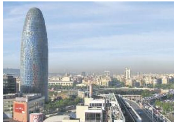
Tot i una arrencada forta, la crisi ha aturat el creixement del 22@.

DAQ, la borsa de valors electrònica i automatitzada més gran dels Estats Units, i té un volum de facturació anual de més de 3.000 milions de dòlars. L'empresa, que destaca per tenir una de les seves branques d'especialització encarada al sector de l'automòbil i dels recursos humans, té a Barcelona una cartera de grans clients, on destaquen Nissan i Seat en el cas dels automòbils o l'empresa de recursos humans Adecco.