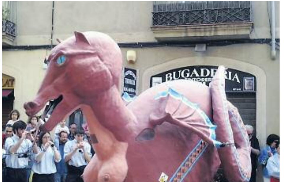
Imatges de les festes de l'any passat.