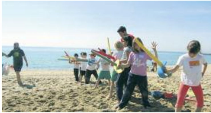
A "Juguem tots junts" hi han participat més de 1.300 nens.

La primera, amb el nom de 'Jornada Esport Sense Barreres', organitzada pel Consell de l'Esport Escolar de Barcelona i el CEM La Mar Bella, celebrada ahir, va comptar amb la participació de 500 nens, nenes i joves de diferents centres especialitzats. Els participants van realitzar diferents esports i activitats durant tot el matí mentre com-