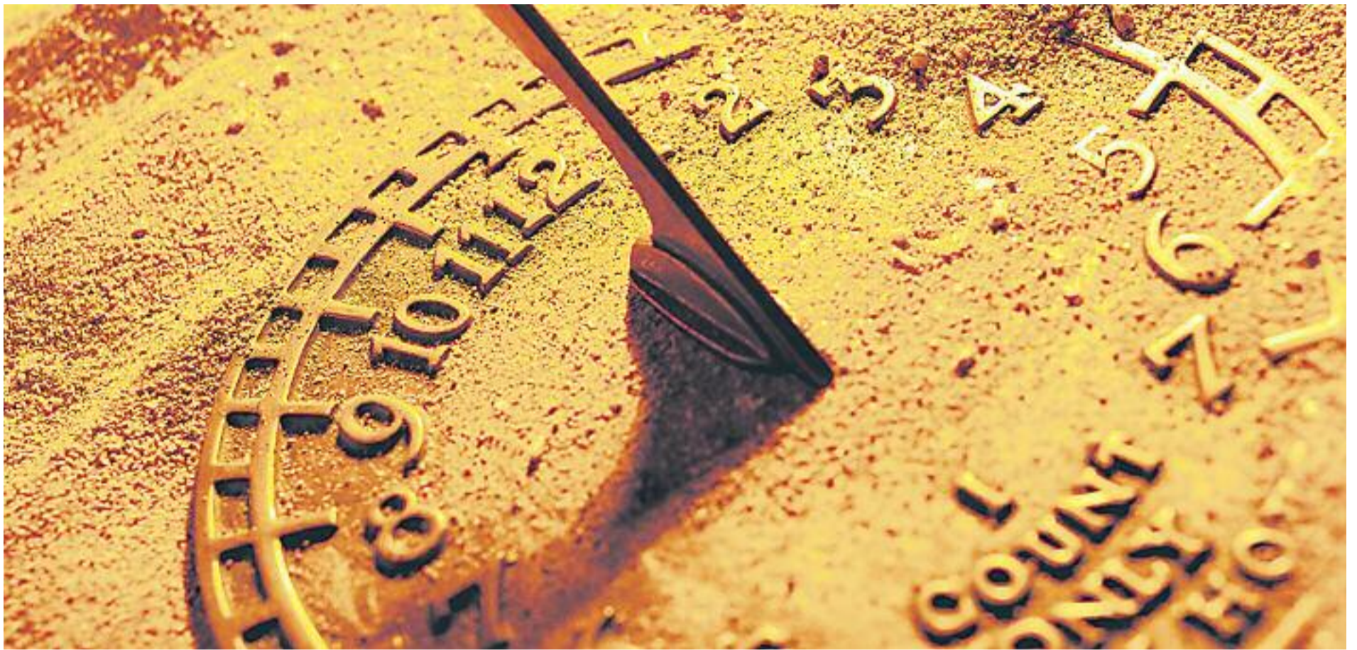
La Plataforma Ara és l'hora assegura que la reforma horaria millorarà la productivitat i la salut dels ciutadans.