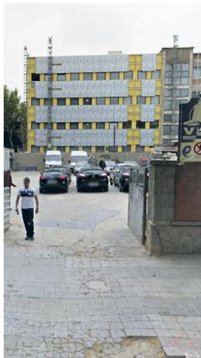
Solar on s’edificaran els nous equipaments municipals del districte.