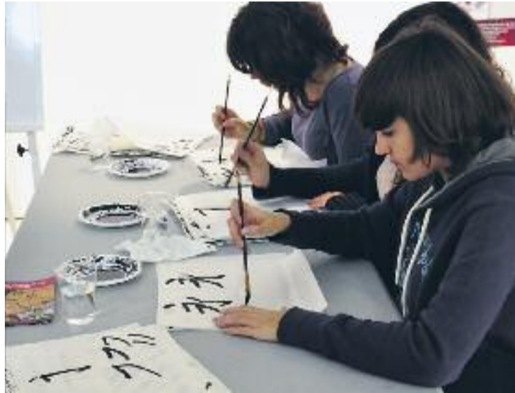
La cal·ligrafia xinesa serà una de les activitats que s'hi faran.

Tal com informen diversos mitjans, a la inauguració s'hi van acostar molts veïns. La majoria d'ells xinesos que comparteixen el culte al taoisme, però també altres ciutadans de la ciutat, que van voler conèixer una nova religió i acostar-se una