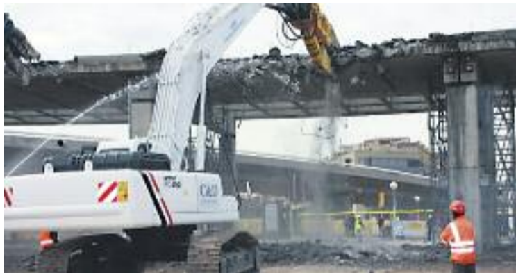
Una de les màquines que s'utilitzen per l'enderroc.

Les màquines que s'utilitzen (pinces demolidores) treballen intensament perquè al juny pugui començar la segona fase de les obres, l'enderrocament del costat muntanya de l'anella. Això obliga, però, a anar regulant el trànsit en funció del tram d'actuació. En aquests moments, els treballs obliguen a desviar alguns recorreguts d'autobús i a fer tall de trànsit nocturns.