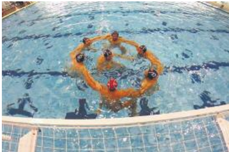
Una rotllana dels jugadors de l'Enginyers.