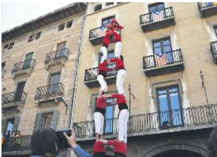
L'actuació dels Castellers de Barcelona.

A la jornada també hi van participar la colla local, els Sagals d'Osona i els Xics de Granollers, que no van superar els set pisos. Els de la camisa vermella actuen diumenge a Vilanova i la Geltrú.