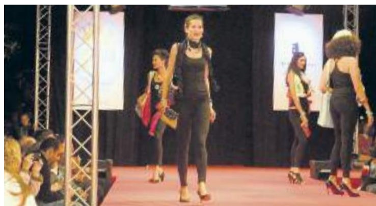
L'escenari de la passarel·la tindrà 22 metres de llargada.

La passarel·la que s'instal·larà al carrer Cantàbria tindrà 22 metres de llargada en total, i hi desfilaran models professionals.