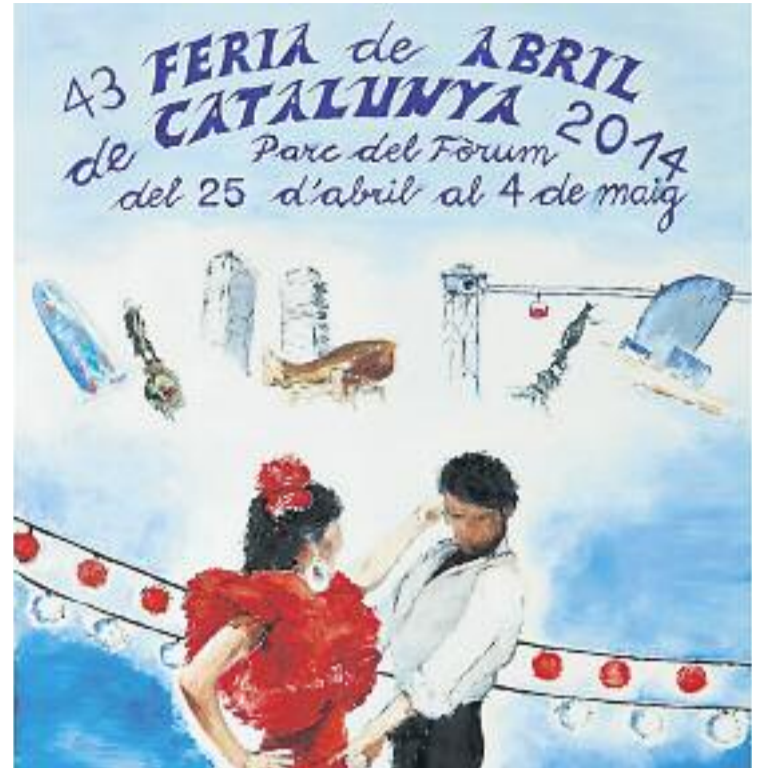
Imatge d'un moment de la Feria de Abril de l'any passat (esquerra) i cartell oficial (dreta).