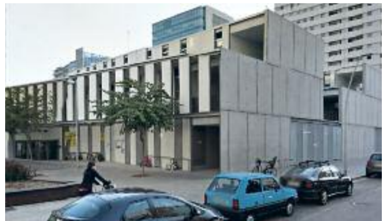
L'escola Fluvià, una de les més demandades.

El Consorci ja ha confirmat que obrirà tres terceres línies extraordinàries a les escoles Pere IV, La Mar Bella i el Centre d'Estudis Montseny i que ampliarà les ràtios en altres centres. La plataforma demana però l'obertura d'altres línies a l'escola Fluvià i Vila Olímpica, les que més sol·licituds han rebut.