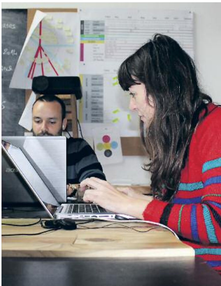
Cartell del projecte Fem comunitat transformant el pati de l'escola (a dalt, esquerra) i l'equip de l'entitat creadora, Raons Públiques.