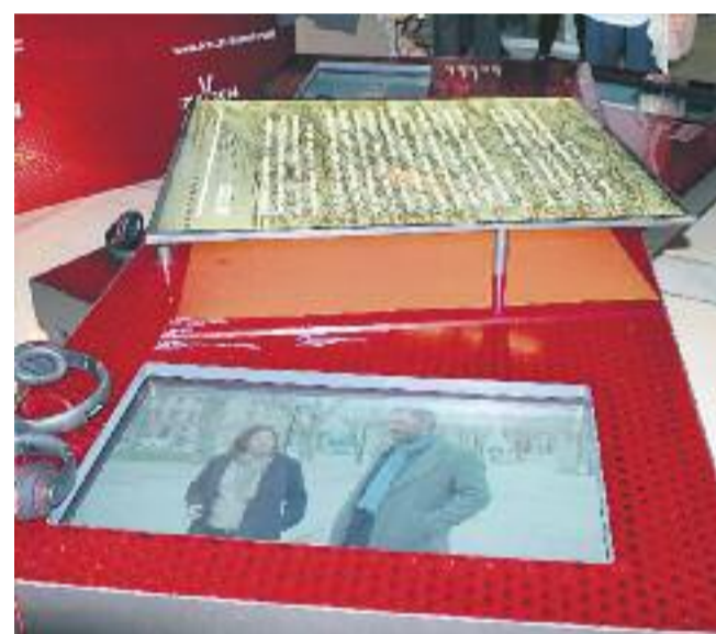
Edifici del Centre Cultural La Farinera (esquerra) i imatges de l'exposició que acollirà el recinte fins al 10 de maig (dreta).