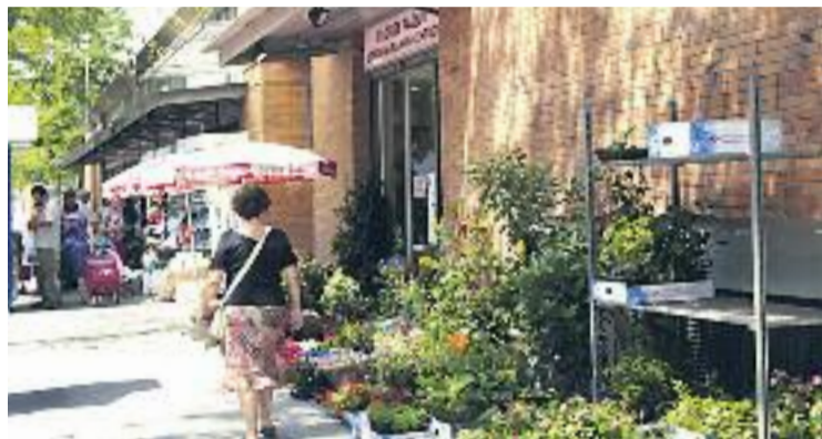
Gairebé la meitat dels comerciants no obriran els festius a l'estiu.

Tot i que les vendes han caigut un 1,4%, els comerciants ja comencen a veure "un punt de llum al final del túnel", segons indica Vicenç Gasca, president de la Fundació Barcelona Comerç. L'optimisme és degut al fet que la caiguda de les vendes no ha estat tan pronunciada com ho va ser durant els primers mesos de 2012 i 2013.