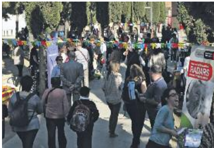
Una de les activitats ahir al Parc del Clot.