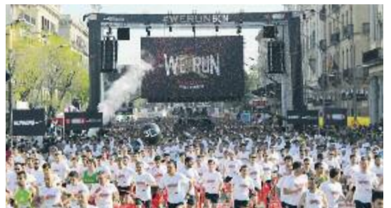
Sortida de la prova atlètica.

ATLETISME ▶ La 26a edició de la Cursa de Bombers de Barcelona, disputada el passat diumenge 12 d'abril, va comptar amb la participació de 27.000 corredors, 40% dels quals van ser dones.