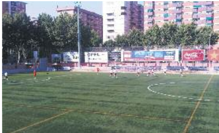
L'activitat tornarà ben aviat al municipal de la Verneda.

Amb una plantilla força renovada, l'entrenador gris-i-grana haurà d'aprofitar a la perfecció les primeres sessions, ja que el pròxim dia 31 l'equip començarà a competir: serà en el 33è Torneig d'Històrics, en el grup més dur del campionat: contra el CF Badalona, de Segona B, i la Fundació Esportiva Grama, de Tercera. Si el Júpiter aconseguís superar aquesta ronda prèvia, jugarà la semifinal el dissabte 4 d'agost i, si també la guanya, la