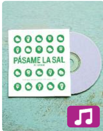
Pásame la sal Los Gazpacho, Cobla Bisbal Jove