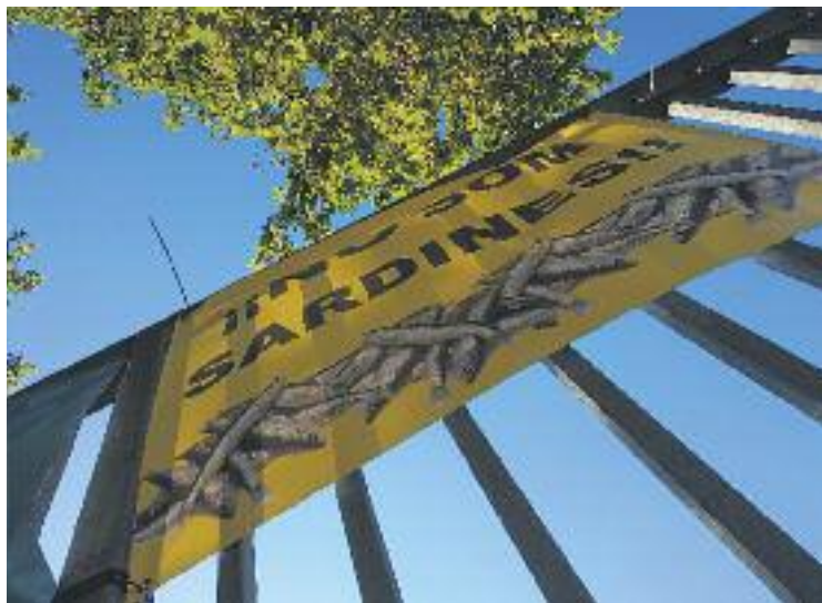
Pancarta reivindicativa a l'entrada de l'escola.

El passat 10 de juliol l'AMPA va organitzar una concentració de protesta per denunciar la situació