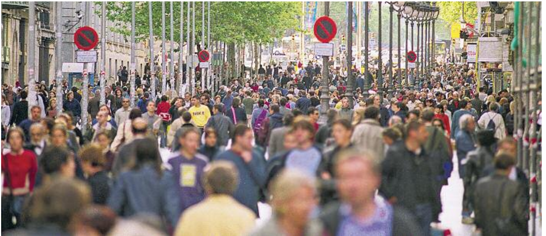
Una quarta part de la població de Barcelona és d'origen estranger.