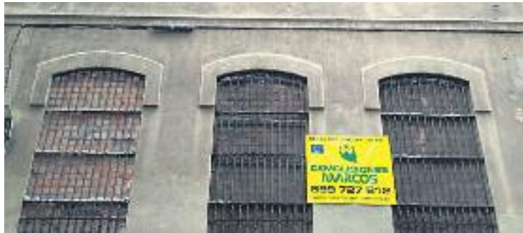
El cartell que anuncia l'enderrocament, a la façana.

L'entitat veïnal considera que això serà possible per "insuficient" Pla Especial de protecció del Patrimoni Industrial del Poblenou, elaborat l'any 2006, ja que en el seu moment va catalogar l'edifici amb el nivell D, cosa que permet l'enderrocament. Afegeixen que l'illa on hi ha l'antiga fàbrica està afectada