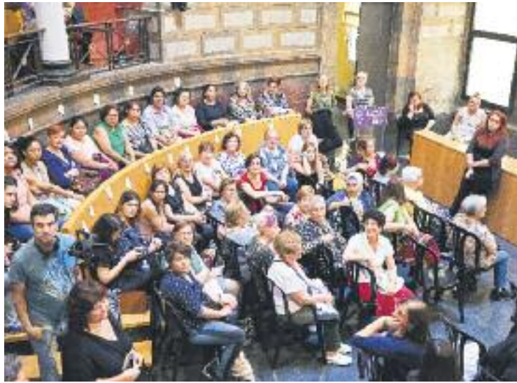
Un moment de l'acte celebrat el 14 de juny.

A l'acte també hi van assistir representants de nombroses entitats i es va recordar les dones que van tenir un paper