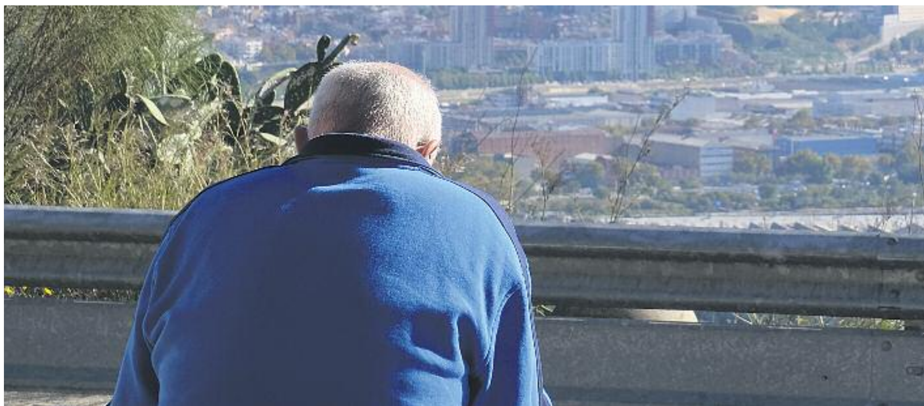
La majoria de víctimes pateixen el maltractament en soledat.