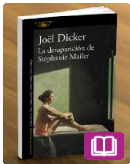
La desaparició d'Stephanie Mailer Joël Dicker

La nova novel·la del suís Joël Dicker, l'escriptor que va triomfar amb 'La veritat sobre el cas Harry Quebert', se situa al capdamunt de la llista de llibres més venuts a França.