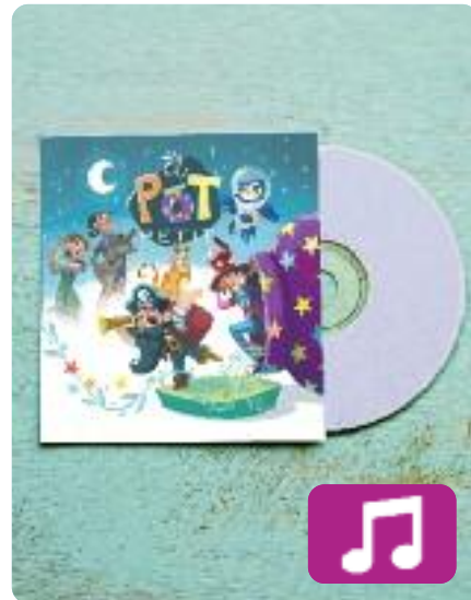
A l'aventura! El Pot Petit

El tercer llarg durada d'El Pot Petit, A l'aventura! (U98, 2018), conté dotze temes de creació pròpia aptes per a totes les generacions. Aquest nou àlbum és la consolidació del projecte de música infantil i familiar del grup. A més, aquesta tercera referència té les col·laboracions d'Els Amics de les Arts, Anna Roig, Guillem Roma i Landry el Rumbero.