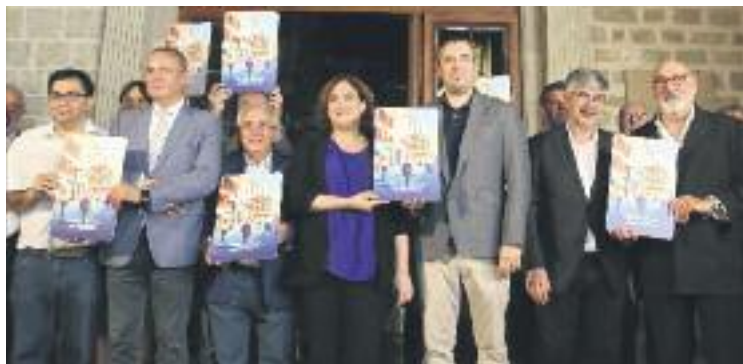
Acte de la presentació de la nova targeta.

Durant l'acte de la presentació d'aquesta iniciativa, fet a l'Ajuntament, l'alcalde Colau va afirmar que "en plena actualització digital de la qual Barcelona ja n'és un referent, aquest comerç de proximitat, de llarga història, s'ha d'actualitzar, i l'Ajuntament ha d'acompanyar-lo perquè pugui aprofitar totes les oportu-