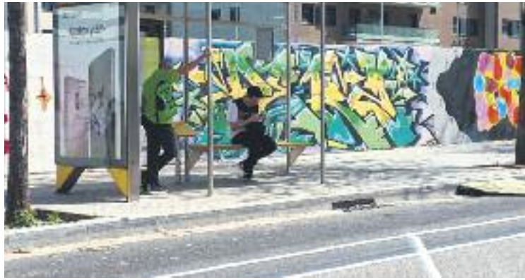
Dos homes esperen el bus.

Des de l'entitat recorden que a mitjans de l'any passat, amb la implementació d'una de les fases de la nova xarxa de bus, es van suprimir línies que han provocat que hi hagi "zones desateses" tot i la posada en marxa de noves línies. Aquestes zones, expliquen des de l'associació veïnal, són principalment dos: la compresa entre els carrers Espronceda, Bac de Roda i Marroc, Tànger i Almogàvers, per damunt de Pere IV, que "des del novembre no té cap línia al centre", i la que va de Pujades i Llull fins a Selva de Mar. Aquesta última "estava coberta per l'H14 i la 36, una línia d'alta fre-