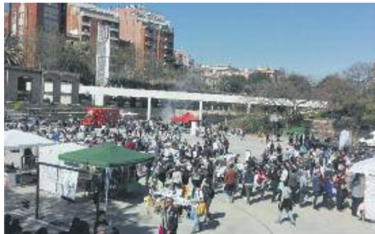
Una imatge de l'edició de l'any passat.

La jornada continuarà fins a les 11 de la nit a l'esplanada del Centre Cívic La Farinera amb la música dels mateixos dj's.