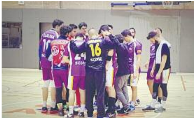
L'equip, després de la darrera victòria.