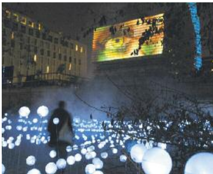
Imatge d'una de les creacions artístiques del festival.

El festival va il·luminar una cinquantena d'instal·lacions i espais del Poblenou fetes per 35 participants entre artistes, companyies i escoles. El projecte 'Llacuna', fet pels estudiants de l'Escola Universitària de Disseny i Enginyeria de Barcelona (ELISAVA) i ubicat a un passadís de l'edifici Mediapro, es va endur el primer premi del festival. El jurat va destacar "la forma òptima en la qual s'ha fet servir la llum des del punt de vista tecnològic i la forma en la qual el projecte ha contemplat la identitat i caràcter del barri del Poblenou". A banda, el jurat també va atorgar una menció especial al projecte '15.000 grams', dels estudiants de l'Escola Tècnica Superior d'Arquitectura de Barcelona (ET-SAB), que es va instal·lar a la cruïlla dels carrers de Badajoz i Bolívia. El jurat va valorar "la capacitat per obtenir un resultat òp-