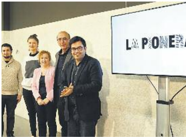
Un moment de la presentació del projecte.

La Pionera, que de moment serà una prova pilot que tindrà un any de durada, tindrà com a objectiu ser un espai d'incubació per a projectes innovadors sobre el món del comerç i els mercats, l'art i el disseny, la gastronomia i les activitats culturals fets per col·lectius que innoven, com ara els makers , artesans o artistes, però també per col·lectius en situació de vulnerabilitat. "És un espai que la ciutat no tenia i que serà un aparador per a les persones que comencen, un dinamitzador comercial del barri del Poblenou i un nou punt de lleu-