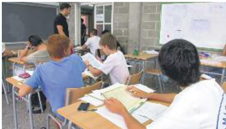
El Poblenou tindrà més places d'escola i institut el curs que ve.

Concretament, es tracta de l'Escola Auditori, que estarà ubicada al carrer Almogàvers 131-135 -al barri de la Llacuna i el Poblenou- i obrirà amb dues línies, i de l'Institut 22@, que es farà al carrer Joncar 35, a l'antiga fàbrica de Can Saladrigues on ara hi ha la biblioteca Poblenou-Manuel Arranz. Més endavant ocuparà els mòduls de l'Institut Martí Pous quan