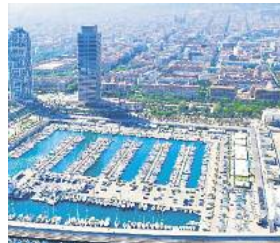
Una reproducció virtual de la zona un cop es faci el projecte (esquerra) i una imatge aèria actual (dreta).

cat als ciutadans sigui de 48.000 metres quadrats, més del doble que l'actual. "Volem que els veïns i les veïnes de la Vila Olímpica i el conjunt de la ciutat tornin al Port Olímpic i se'ls sentin seu", va afirmar Colau.