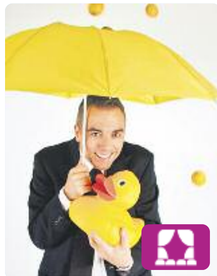
Gala Internacional de Màgia Alberto de Figueiredo

El Teatre Zorrilla de Badalona celebra aquest febrer la 18a Gala Internacional de Màgia. El plat fort serà del 23 al 25, amb el mag Alberto de Figueiredo com a mestre de cerimònies.