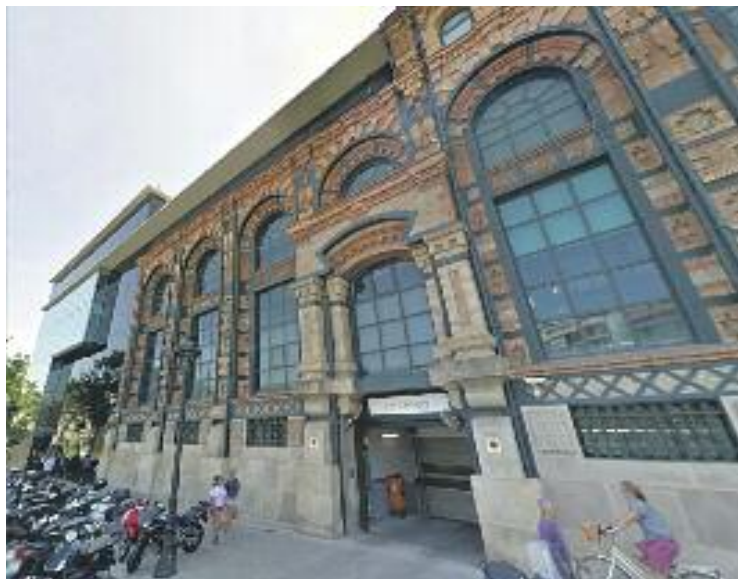
Una imatge de l'Espai Endesa.

En tercer lloc s'analitzarà la qüestió del territori: com l'increment de professionalització del món associatiu s'està sola-