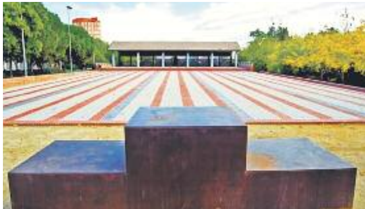
Una imatge de l'estat actual de la plaça.

La regidora demòcrata Maite Fandos va anar més enllà i va assegurar que "molts veïns no co-