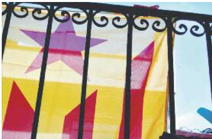
Imatge d'arxiu amb una estelada penjada d'un balcó.

De fet, no és la primera vegada que a l'home li disparen un tret contra casa seva. Segons el mateix relat fet a El Món, el 2013 ja li van