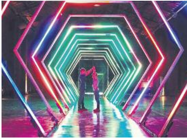
El Poblenou s'omplirà de llum aquest cap de setmana.

Concretament, el recorregut que proposa el festival fa un total de quatre quilòmetres a la zona de les Glòries. Alguns dels espais escollits per acollir les propostes artístiques són el Museu del Disseny, Betevé, l'e-