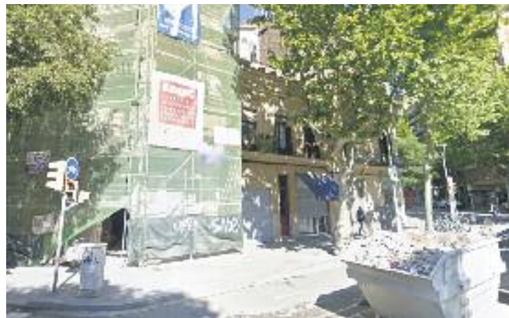
Una imatge d'arxiu del bloc que ara ha estat precintat.

també hi ha una part de l'obra, la que incrementava el volum de l'edifici, que s'haurà d'enderrocar perquè tampoc hi havia permís per fer-ho. El Districte va poder detectar les irregularitats perquè la propietat de l'edifici, Sort Bwok SL, només havia tramitat dos comunicats i quatre assabentats i havia demanat una llicència per poder comercialitzar els pisos de manera individual. En aquell moment els serveis tècnics van fer una inspecció a les obres i van detectar les irregularitats.