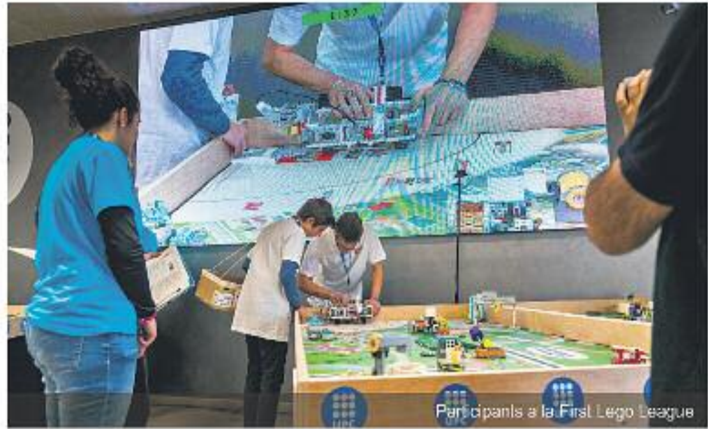
Participants a la First Lego League

Hi ha diferents premis i guardons per als concursants de les diferents fases. Aigües de Barcelona hi col·labora amb el guardó 1r premi al Projecte Científic com a agent coneixedor i impulsor de la gestió eficient del cicle integral de l'aigua. També