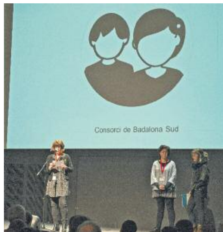
El Consorci Badalona Sud participa en el projecte Educació 360.