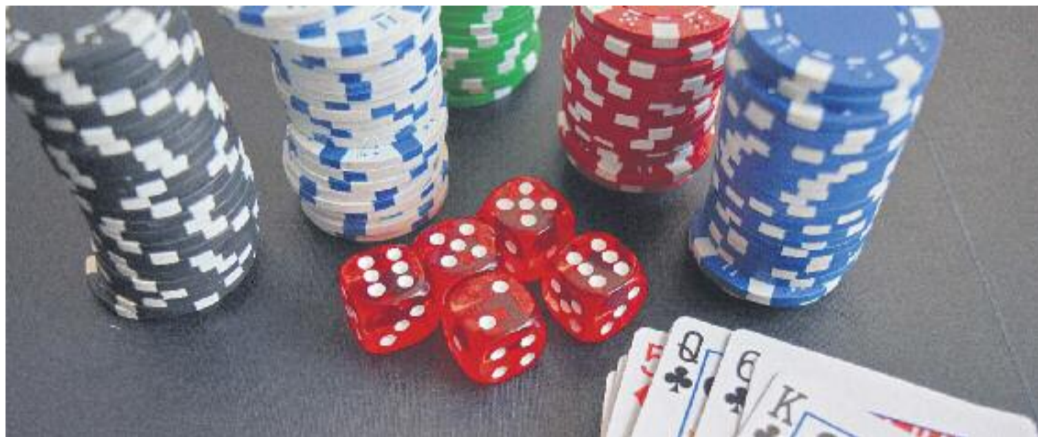
Jugadors Anònims fa trobades amb persones que pateixen ludopatia per ajudar-los a frenar la malaltia.