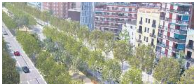
Imatge virtual de la futura Meridiana.

REMODELACIÓ ▶ Les obres de transformació de l'avinguda Meridiana ja tenen lloc i data d'inici. Serà a partir del pròxim mes de juny i el primer tram on l'Ajuntament començarà a treballar és el que va de la zona de les Glòries, a l'altura del carrer Independència, al carrer Mallorca.