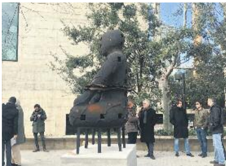
Un dels 'Guardians' que hi ha a davant de Can Framis.

Segons ha explicat l'Ajuntament en un comunicat, aquestes obres passen formar part de la col·lecció d'Art Públic de la ciutat i tenen com a objectiu im-