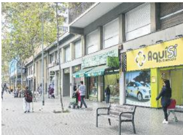
Sant Martí és un districte amb una alta activitat comercial.

D'altra banda, Sant Martí és un dels cinc primers districtes de la ciutat amb més concentració de locals dedicats al comerç al detall, concretament del grup que l'inventari anomena 'quotidià alimentari', on s'engloba la venda de begudes,