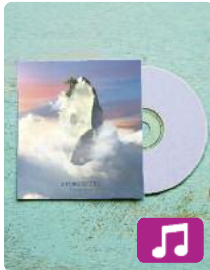
Atmosfera Senyor Oca

Guanyador de l'última edició del concurs de grups emergents Sona 9, Senyor Oca ha començat el 2018 combinant la gravació del seu nou disc amb diferents actuacions per Catalunya.