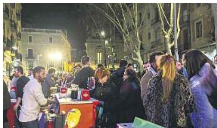
El Clot es va omplir per la Porkada.

El tram final de la jornada, que és el que va reunir més gent, va tenir de protagonistes el Porkatapes, una ruta per diferents bars animada per la xaranga ZeBRASS Marching Band, i el foc. Els Diables del Clot, amb el seu correfoc, van fer un recorregut que va passar pels carrers del Clot, Escolers, Escultors Claperós i Rosend Nobas.