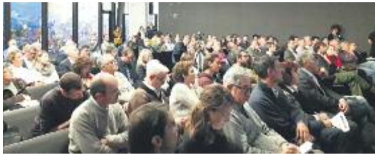
Una imatge de la sessió informativa de dimarts.

Aire Net va néixer fa uns mesos per denunciar les males olors i la contaminació -amb xifres elevades de partícules cancerígenes-, assegura, pateixen els veïns del Fòrum. Dimarts, en una sessió informativa al Museu Blau, representants de la plataforma es van trobar amb el regidor de Presidència, Aigua i Energia, i vicepresident de l'AMB, Eloi Badia, i amb el comissionat d'Ecologia, Frederic Ximeno. La plataforma ja va organitzar el passat mes de novembre una jornada per im-