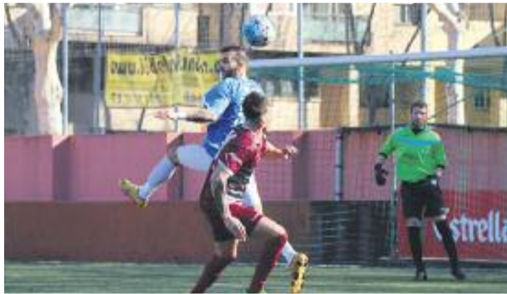
Un moment del darrer partit contra el Farners.