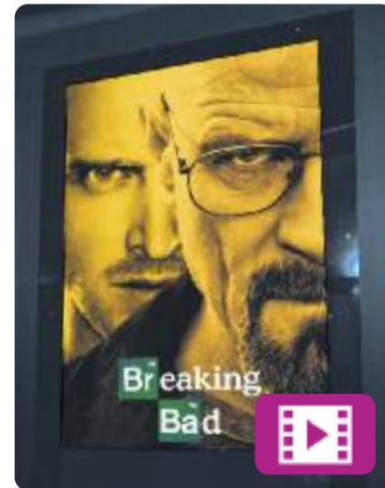
Breaking Bad Vince Gilligan

Aquest mes es compleixen 10 anys de l'estrena de Breaking Bad , una de les millors sèries del que portem de segle.