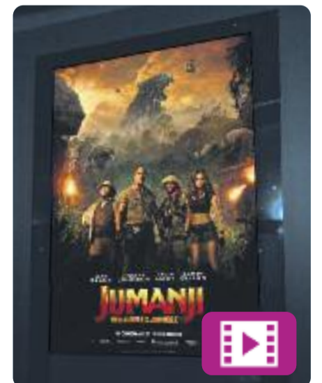
Jumanji: Benvinguts a la jungla

Rentat de cara a un dels clàssics del cinema d'aventures de finals del segle passat. A Jumanji: Benvinguts a la jungla , quatre joves amics són absorbits per un videojoc i es converteixen en personatges amb habilitats úniques.