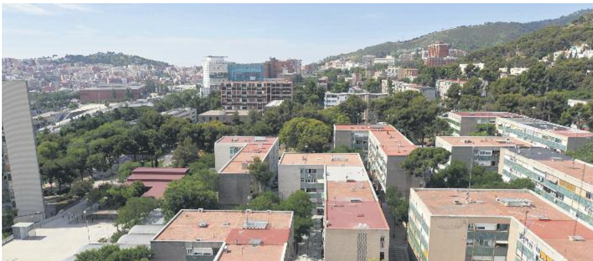
Camp de l'Arpa és un dels barris que han passat de ser considerats de renda baixa a renda mitjana.