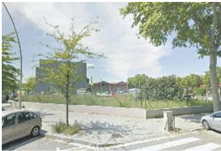
El solar on es farà la benziner.