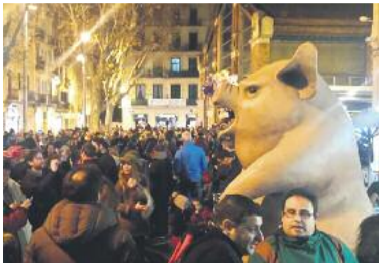
Una imatge de la Porkada de l'any passat.

La jornada festiva arrencarà a les 11 del matí amb el tastet de tapes al voltant del mercat. Hi haurà animació a càrrec del PorkdelClot, que estarà acompanyat de La Verreta i Lo Tosino de Tàrraga. A les cinc de la tarda arribarà l'hora de la tarda de tapes i la música. Cinc bars s'instal·laran a la plaça del Clot per oferir les seves creacions gastronòmiques. Per la seva banda el col·lectiu de DJ's Northern Clot començaran a animar la festa, que s'allargarà fins a la nit. Una hora més tard es posarà en marxa el Porkatapes. Es tracta d'una ruta que començarà