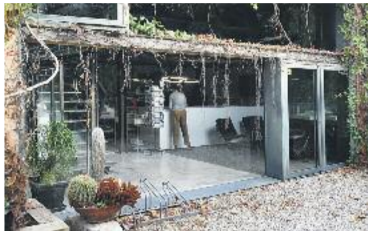
Una imatge del recinte del Palo Alto.

Els republicans també demanen que el consistori garanteixi "l'accés lliure i gratuït" dels veïns al recinte amb l'obertura d'entrades que, a parer seu, són "necessàries".