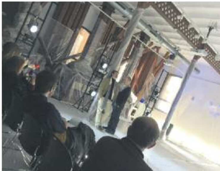
Un moment de la representació de 'Pornografia'.