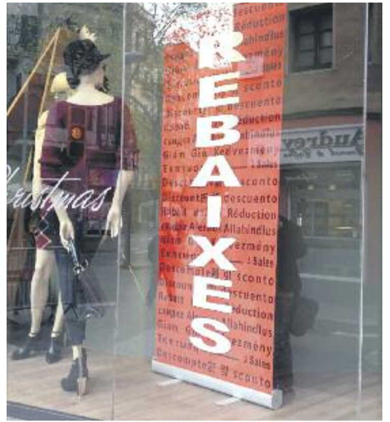
La campanya de rebaixes s'allargarà fins al març.