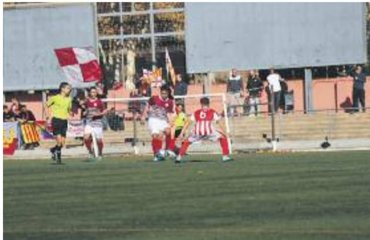
Els de la Verneda confien a millorar durant la segona volta.

En canvi, el Martinenc ha començat l'any natural amb mal peu i ha perdut les dues jornades que s'han disputat fins ara. Malgrat això, els de Míguel López continuen al capdavant del grup 2 de la Primera Catalana i pujarien directament a Tercera si la lliga s'acabés avui, però aquesta mala ratxa recent ha provocat que els seus principals persegui-