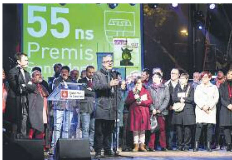
Una imatge d'un moment de la jornada.

Pel que fa al premi a la modalitat col·lectiva, aquest va anar a parar a la campanya de Reis del