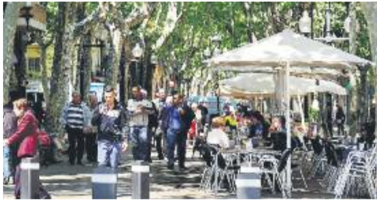
El Poblenou, un dels punts més turístics del districte.

Pel que fa a les zones del Clot i el Camp de l'Arpa i el Besòs, el Maresme i Provençals, els veïns veuen la inseguretat com el principal problema del seu