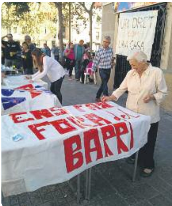
Una imatge del taller de pancartes.

Així doncs, des de bon matí la plataforma i els veïns afectats van sortir al carrer a preparar les pancartes amb els següents missatges de protesta: 'Ens fan fora de casa', 'Volem quedar-nos' i 'Un dret com una casa' per penjar-les als balcons. Des d'Ens Plantem defensen el dret dels veïns a continuar vivint al barri on han fet la seva vida o on l'estan construint i exigeixen que "les administracions intervinguin per garantir que aquest dret fonamental no sigui segrestat per les pràctiques especuladores dels fons inversors".