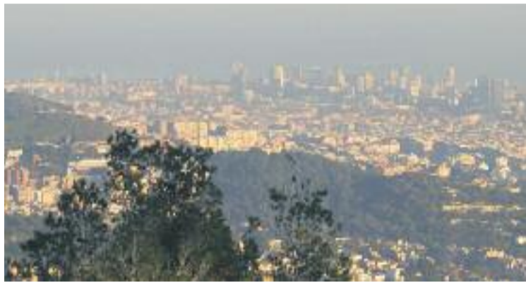
Els veïns alerten d'un possible problema sanitari.

Aquestes associacions de veïns asseguren que la concentració d'activitats industrials és molt alta a la zona, i posen d'exemple la incineradora de Sant Adrià de Besòs, la depuradora d'aigües i planta d'asseccament de fang. Aquests veïns han mostrat un estudi que tenen a les seves mans de la Universitat Rovira i Virgili, que demostra, entre altres coses, que els nivells de dioxines cancerígenes al voltant de la incineradora de Sant Adrià és 2,5 vegades superior al de zones similars. En paral·lel, tenen un altre estudi de l'empresa Socio Energia que determina que la depuradora d'ai-