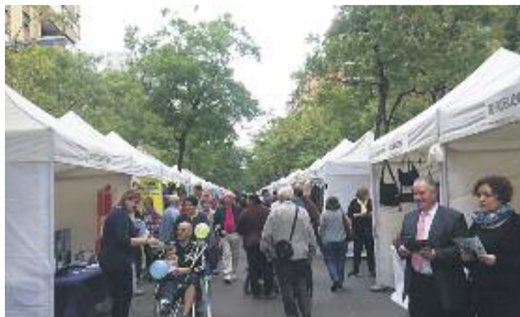
La Mostra de Tardor s'ha consolidat al barri. Foto: Eix Sant Martí

De totes maneres, Martínez fa un bon balanç global d'una mostra que es consolida any rere any. “Malgrat la pluja, vam poder ensenyar l'oferta dels comerços del barri i donar-los a conèixer entre el veïnat”, afirma el president de l'eix comercial.