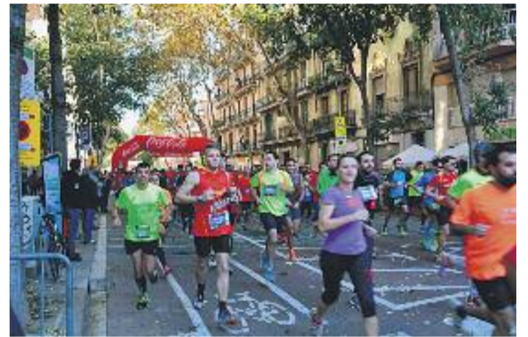
Un moment de la cursa.