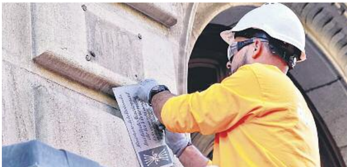
Aviat ja no hi haurà plaques franquistes al districte.

MEMÒRIA HISTÒRICA ▶ Aviat Sant Martí ja no tindrà plaques franquistes. I és que a finals d'octubre es va posar en marxa la retirada d'aquests vestigis de la dictadura a quatre districtes de la ciutat, entre els quals hi ha Sant Martí.