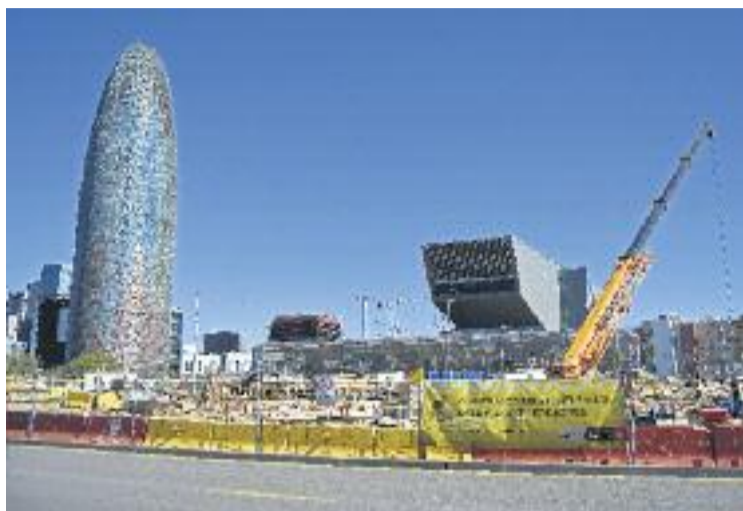
Les Glòries afronten la seva transformació verda.

Per altra banda, el projecte –amb algunes al·legacions de diferents partits polítics– con-