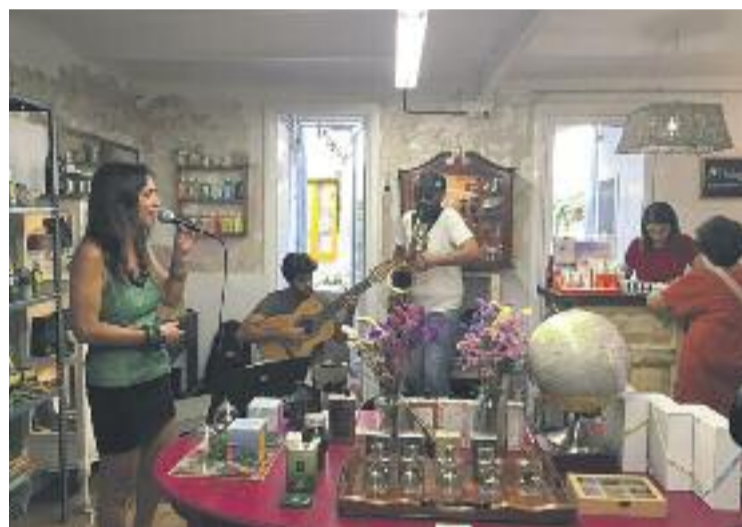
Les botigues es van convertir en improvisats escenaris.

El festival va tenir dues modalitats. L'Inaudit In va consistir en actuacions musicals a l'interior de botigues i va ocupar bona part d'aquella jornada. Per la seva banda, l'Inaudit Out va començar a les sis de la tarda i va aplegar concerts a diversos espais del barri. El festival va tancar la seva segona edició amb un gran concert final a Can Felipa a les 10 de la nit.