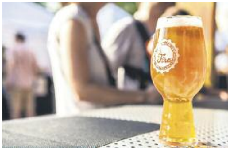
La fira arriba enguany a la seva sisena edició.

Per altra banda, una de les novetats d'aquesta sisena edició de la fira és la creació d'una zona de 'brew up', on els mateixos bars produeixen la seva cervesa. Aquest espai comptarà amb cinc representants: Black