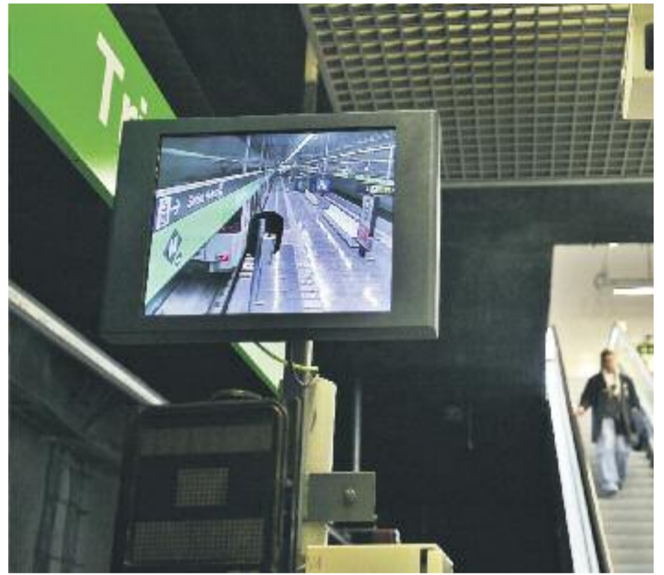
El nou pla de xoc per evitar robatoris estarà en marxa fins al 30 de setembre.