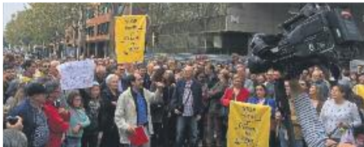
Els veïns han dit que continuaran plantant cara al projecte.

Així doncs, la Síndica ha desestimat la reclamació, tot i que al mateix temps recomana a l'Ajuntament que "faci un control adequat de les obres de l'alberg i de l'activitat que s'hi pugui dur a terme". Al mateix temps, també insta al govern municipal a aplicar "les mesures correctores necessàries per pal·liar els efectes negatius" que l'alberg "pugui tenir en l'entorn i en la vida del barri". De fet, la Síndica deixa clar que comparteix "la preocupació del veïnat sobre com impactarà aquest ma-