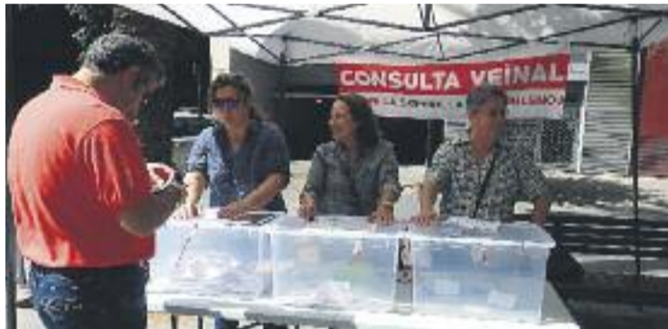
Una imatge de la segona jornada de votació.

Sigui com sigui, des de la Plataforma Afectats Superilla s'han mostrat molt satisfets amb la participació veïnal. Afirment que la consulta ha servit per "constatar novament que el rebuig del veïnat a la superilla és molt ampli". Al mateix temps, destaquen que "el rebuig per part dels comerciants i