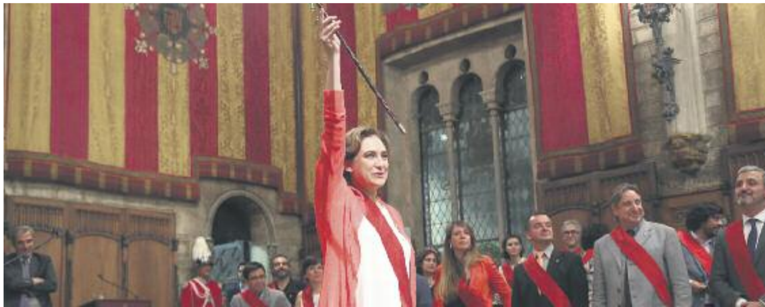
Colau, el dia de la presa de possessió com a alcaldessa.

L'actual alcaldessa, ara de baixa després d'haver estat mare, va iniciar el mandat amb molta ambició. Feia falta començar a complir les múltiples promeses fetes a la ciutadania durant la campanya electoral. Han passat dos anys i, segurament, la gran victòria de Colau i el seu govern —primer en solitari i després amb el PSC— és la d'haver canviat, i dominat, l'agenda política de la ciutat. El turisme i l'habitatge, els dos grans temes on els comuns van posar més èmfasi durant la campanya, ocupen ara la centralitat del debat polític. L'aprovació del Pla Especial Urbanístic d'Allotjaments Turístics (PEUAT), pactat amb ERC, ha