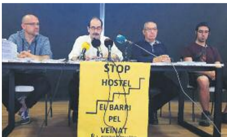
Imatge de la roda de premsa del 25 de maig.

El president de l'associació de veïns també va aprofitar la seva compareixença pública per demanar al govern municipal que es