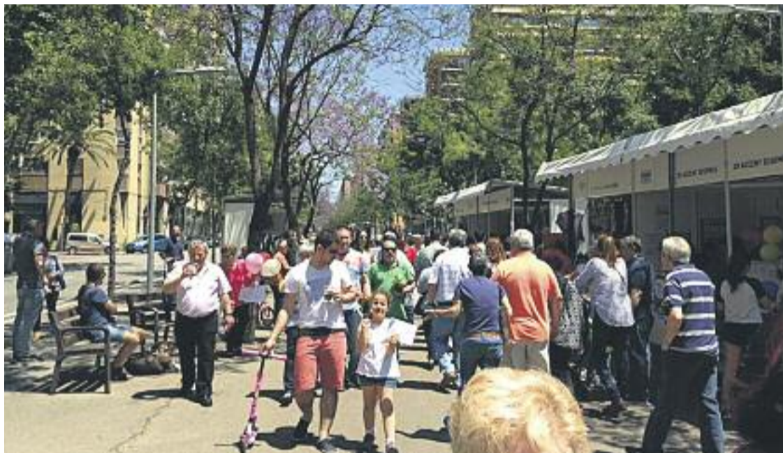
La Mostra de Comerç arribava enguany a la seva 18a edició.

» La mostra de diumenge va superar les xifres de la de l'any passat » Hi va haver exhibicions i es va fer la tradicional rostida de la vedella