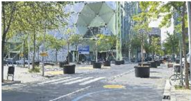
La superilla ha causat divisió veïnal al Poblenou.

Així doncs, aquest col·lectiu veïnal defensa ara que convoca "un acte democràtic" que té com a objectiu "informar de manera rigorosa als veïns del que està passant i d'habilitar espais de votació perquè els veïns més afectats puguem manifestar la nostra opinió".