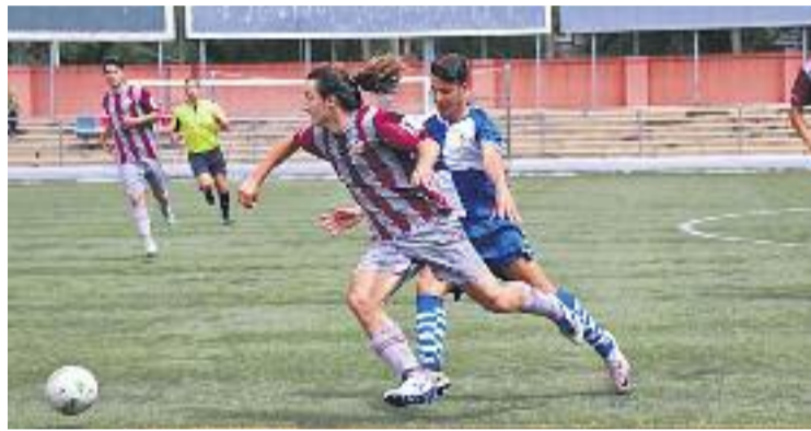
La victòria contra el Sabadell B va ser crucial.

Ara bé, per culpa dels descensos compensats, l'equip sap que no en té prou amb abandonar les tres posicions de la cua, sinó que ha d'escalar les màximes posicions possibles per evitar perdre la categoria. Les caramboles que permetrien que l'equip no jugués a Primera catalana la temporada que ve passen per guanyar els dos partits i que els equips que hi ha entre el Júpiter i el Santfeliuenc no sumin. Precisament, la pròxima jor-