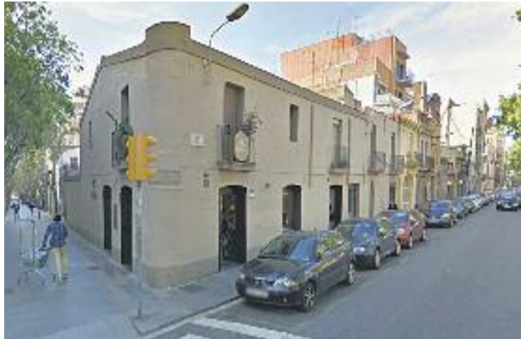
El Forn Elias, un racó emblemàtic del Clot.

Cap a les cinc de la tarda de dissabte les coques estaran enllestides i es trauran al carrer, on seran rebudes pels Gegants i els Diablers del Clot. Un cop es destapin, es repartiran entre els assistents, els quals també podran gaudir de diverses activitats com ara un photocall amb estris de forners per als més petits.