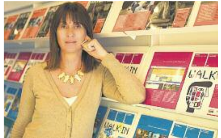
Imma Tubella , doctora en Ciències Socials i Catedràtica de Comunicació de la Universitat Oberta de Catalunya

Catalunya té una enorme necessitat de talent i el desenvolupament del talent comença amb una educació que obri portes i finestres, no que les tanqui o en el millor dels casos, tan sols les entreobri. D'altra banda, fa anys que té totes les condicions