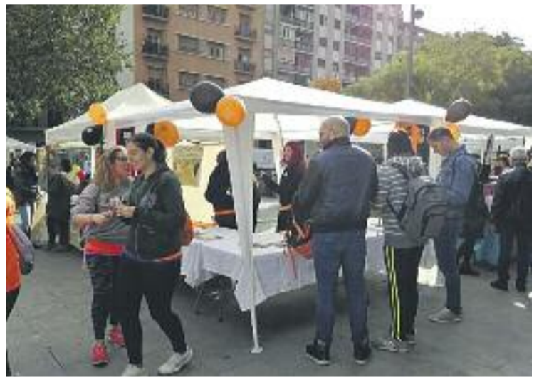
Un moment de la fira de l'any passat.

A més, els més petits de la casa podran gaudir de tallers infantils, molts d'ells perquè puguin fer un regal cent per cent personalitzat de cara a l'endemà de la fira, primer diumenge de maig i Dia de la Mare.