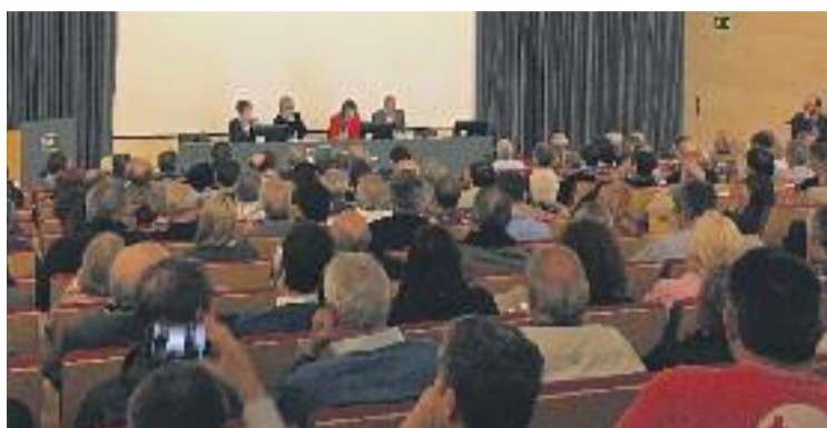
Una imatge de l'Audiència Pública d'ahir.

Posteriorment va arribar el torn dels veïns. La primera inter-