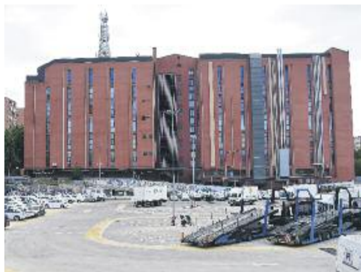
Actualment el solar és un aparcament.

Corp és una promotora immobiliària que es va fundar l'any 2008. L'empresa també es va fer seu el projecte d'un gratacel al 22@ que té un total de 126 habitatges després que quedés aturat durant la crisi.