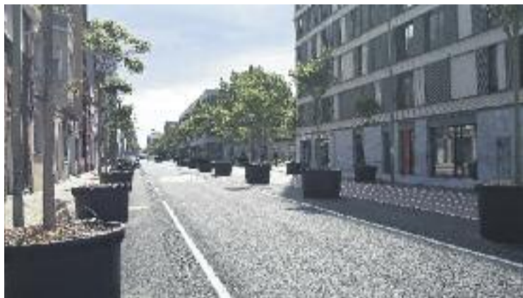
La superilla podria acabar ara als tribunals.

Qui veu les coses diferents és el Col·lectiu Superilla Poblenou, que reivindica la necessitat que el projecte tiri endavant per tal que "les persones puguin recuperar l'espai públic". Al mateix temps, defensen que "la superilla s'està convertint en un corredor per a vianants on cada dia