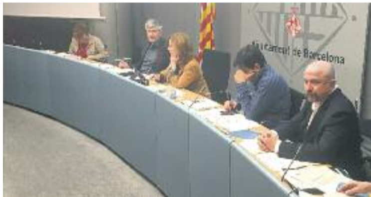
La comissió es va celebrar aquest dimarts.

Una proposta que sí que va tirar endavant va ser una d'ERC