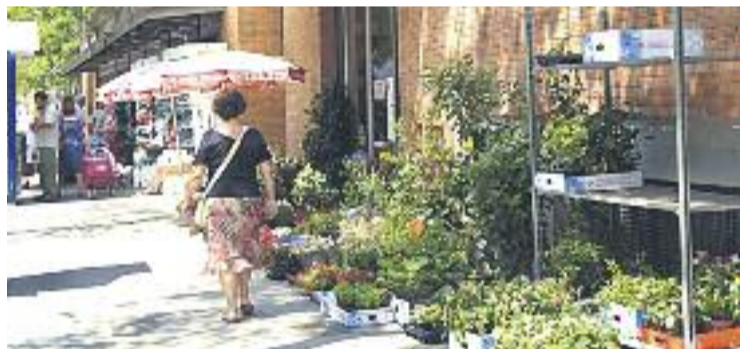
La dinamització del comerç, principal objectiu.

AJUDES ▶ El consistori ha anunciat que destinarà 1,2 milions d'euros a ajuts per al foment del comerç de proximitat. En total, se subvencionaran 189 projectes que impulsin associacions de comerciants i gremis. "D'acord amb les converses mantingudes amb els representants del comerç de proximitat", expliquen des de l'Ajuntament, les subvencions se centraran en quatre eixos diferents.