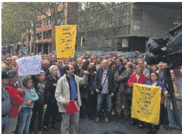
El futur alberg de la Vila Olímpica continua generant polèmica.