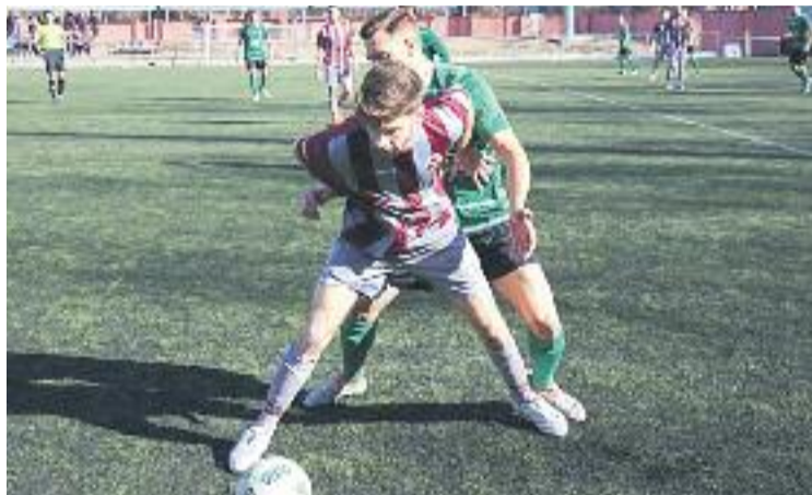
Els gris-i-grana ja no es poden permetre més ensopegades.

I és que l'empat que l'equip va aconseguir la setmana passada a la Verneda contra el l'EC Granollers (2-2) combinat amb la victòria del Manlleu contra el Sabadell B (2-1) fa que ara la dissetena posició, que ocupen els osenencs, sigui a sis punts quan només queden dotze per jugar-se. El repte és complicat, però després del partit contra els palamosins, el Júpiter afrontará dues jornades consecutives contra els altres equips que ara mateix ocupen po-