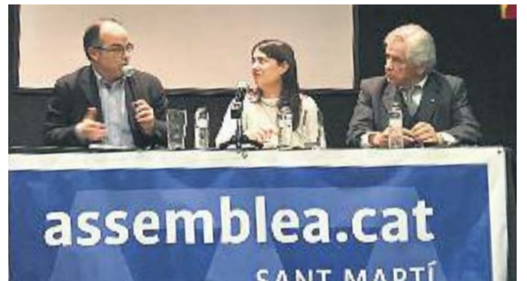
Una imatge del col·loqui de dilluns.