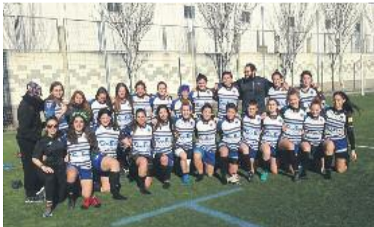
Les del Poble Nou estan completant una gran temporada.

ga s'atura i l'equip tornarà a jugar el dia 11 contra el Sant Cugat.