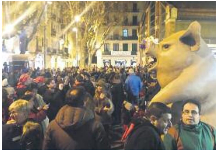
El porc va presidir tots els actes de la Porkada.

A la cita hi van participar els Salnitrats de Collbató, els Cremats d'Olost, els Diablers d'Argentona i els de Rubí, que també van portar les seves particulars mascotes. També hi va ha-