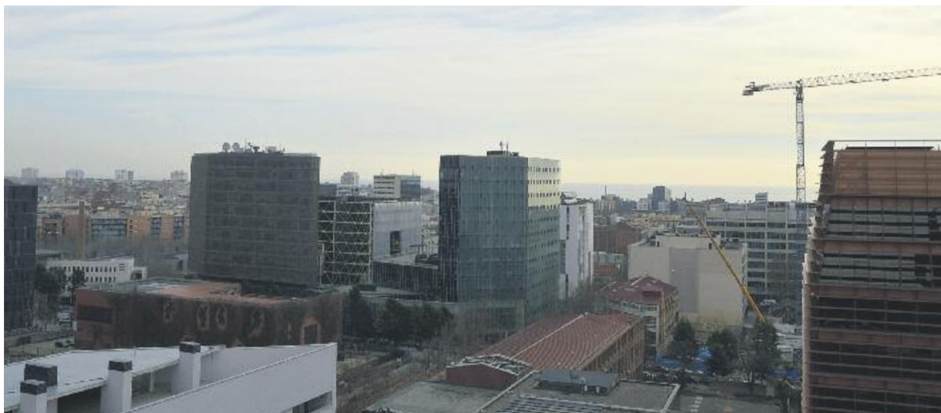
El districte tecnològic 22@ ha transformat part del Poblenou.