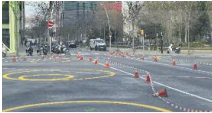
L'Ajuntament ja està fent canvis al carrer Boronat.

Fins ara, la superilla estava pensada de tal forma que quan un cotxe hi entrava el mateix disseny de l'espai l'expulsava. Ara, però, es podrà anar des del carrer Tànger al carrer Pallars passat per Roc Boronat. A banda d'aquest canvi, al llarg d'aquest mes de febrer l'Ajuntament també introduirà altres canvis. Les noves parades d'autobús dels carrers Almogàvers i Pallars s'acostaran a les que ja hi ha ara, mentre que la parada del carrer