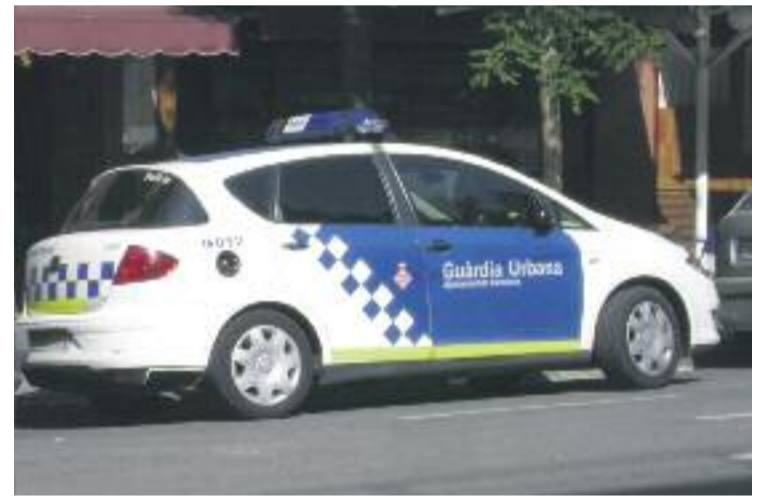
La Guàrdia Urbana va detenir els dos homes dijous passat.

Dijous passat, un cop els agents van poder accedir al local, van poder comprovar com s'estava utilitzant una quantitat d'electricitat molt superior als paràmetres normals, que fins i tot hagués pogut provocar un incendi a causa de la precarietat de la instal·lació. A banda de les plantes, la policia també va decomissar 16 làmpades de sodi i 16 potènciòmetres elèctrics.