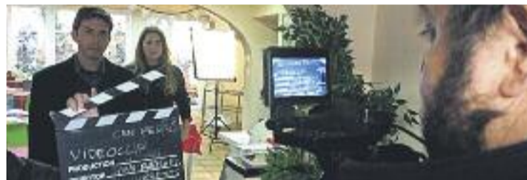
Rodatge del clip solidari, amb Planas i Fuentes.

CONCURS ▶ El començament de l'any és per excel·lència l'etapa més cinèfila del calendari, un fet al qual no és aliè el comerç de proximitat barceloní. I és que el pròxim dia 20 de gener se celebra la gala d'entrega dels premis del concurs de curtmétratges BCN Shopping&Shooting , una iniciativa que va néixer fa uns anys de la mà de l'Associació de Comerciants de Creu Coberta i que ha esdevingut un certamen on hi participen botiguers de tota la ciutat de la mà de la Fundació Barcelona Comerç. El CaixaForum acollirà la tradicional gala d'entrega de premis a partir de les nou de la nit, on s'entre-