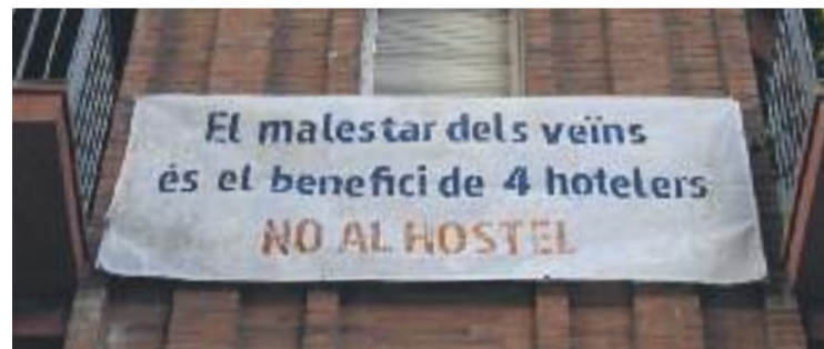
El futur alberg de la Vila Olímpica està envoltat de polèmica.

D'altra banda, veïns de la Vila Olímpica van tornar a manifestar-se dissabte passat per protestar contra la represa de les obres de l'alberg.