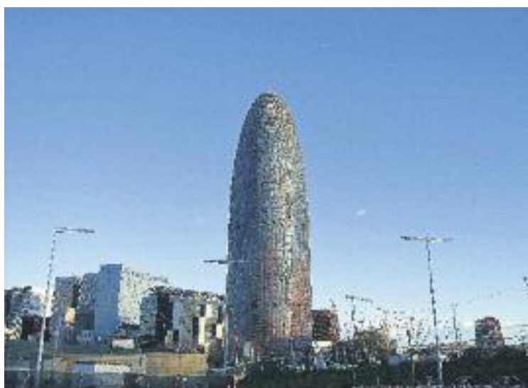
La Torre Agbar acollirà finalment oficines.

Les paraules de Montaner van provocar la ràpida reacció de CiU, PP i C's, que es van mostrar molt crítics amb el pa-