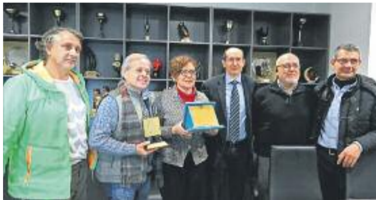
Moment de l'entrega del premi als paradistes.

L'entrega la va protagonitzar la regidora de Comerç, Montserrat Ballarín, que va aprofitar per