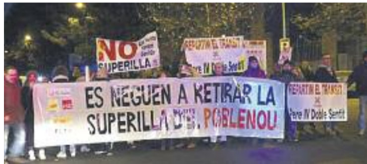
Una imatge de la protesta de dilluns.

La manifestació es va posar en marxa ben d'hora, a dos quarts de vuit del matí, i es va acabar al voltant de les vuit a la intersecció de Tànger amb Roc Boronat. Un cop finalitzada la protesta, els manifestants es van dirigir cap a la plaça Sant Jaume per entregar una carta a l'alcalde Colau amb les seves reivindicacions. Al document, la plataforma insisteix