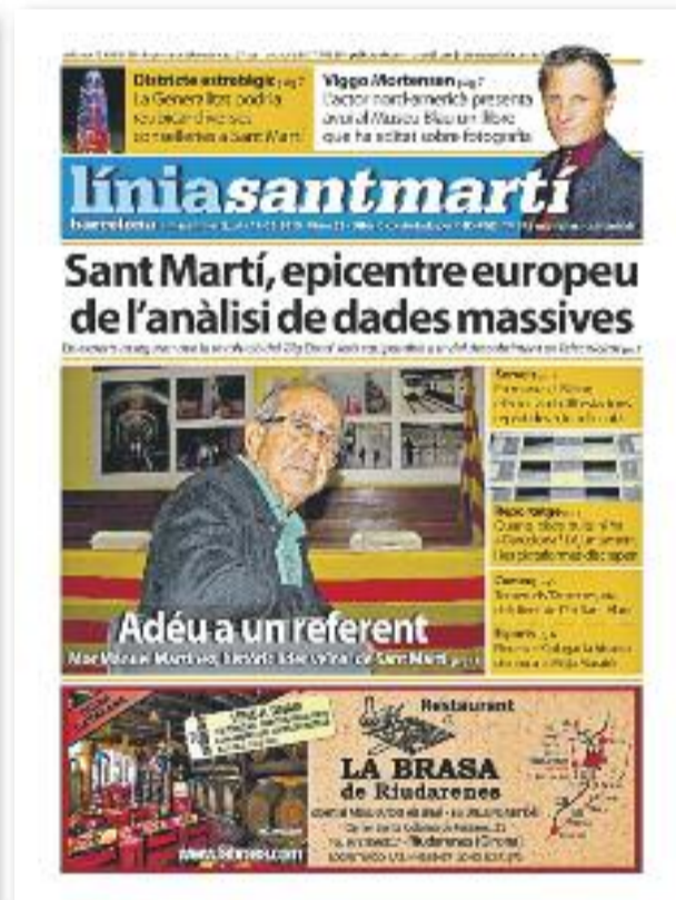
Número 63 · 19 de febrer de 2015