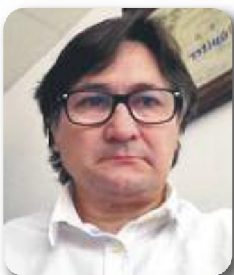
Joan Rión CE Júpiter

Des del Ball de Bastons del Clot us volem felicitar pels 100 primers números publicats i esperem que pugueu fer-ne molts més. Moltes gràcies per la tasca informativa que esteu fent al barri, ja que sou un dels mitjans que doneu veu a la gent per donar a conèixer les seves preocupacions i a les entitats del barri per difondre els seus actes i activitats.