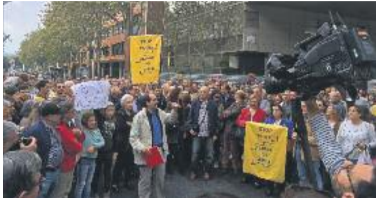
Imatge d'un moment de la protesta contra l'alberg.

El hostel , però, té els permisos en regla, ja que va aconseguir esquivar la moratòria hotelera de l'Ajuntament perquè el certificat d'aprofitament urbanístic es va tramitar a finals del passat man-