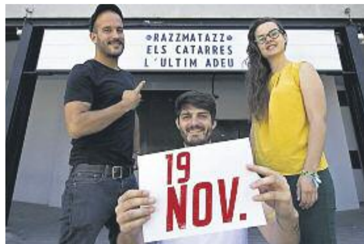
Els Catarres seran a Razzmatazz el dia 19 de novembre.

Durant la mateixa roda de premsa de presentació d'aquesta minigira, el grup també va explicar que després de 'L'últim adéu' faran una "aturada indefinida" d'un any i mig, com a mínim.