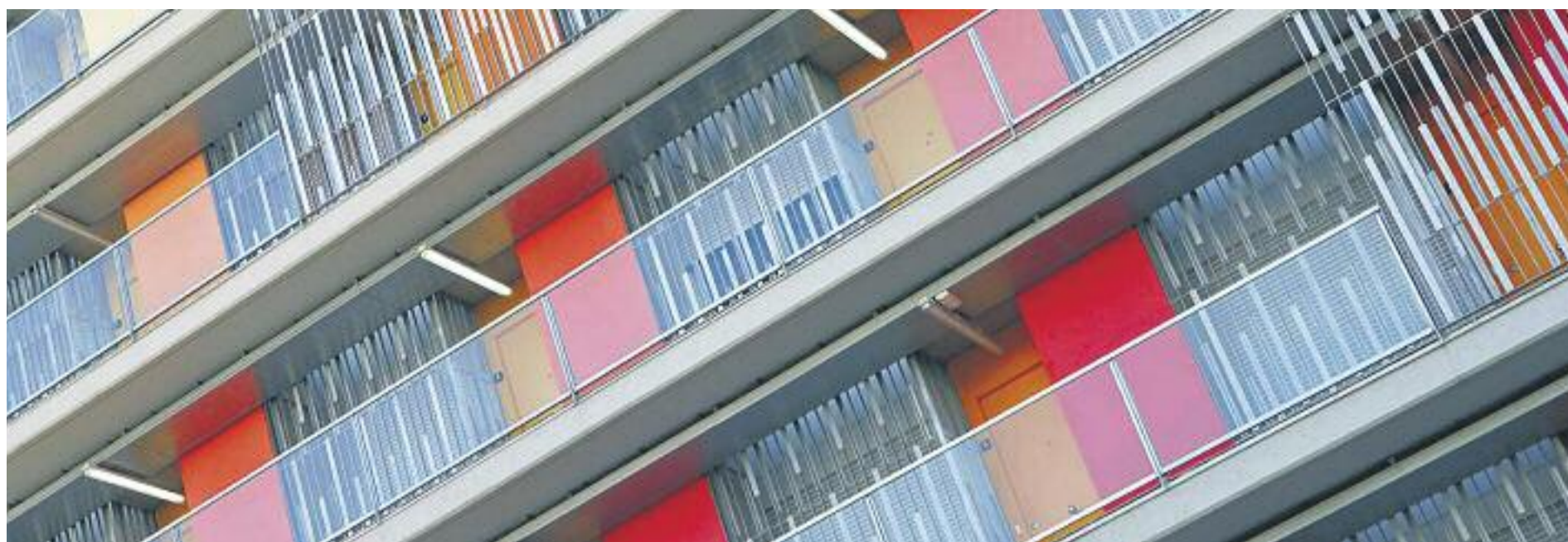
Els preus de lloguer dels pisos a la ciutat han experimentat un fort creixement des del 2014.