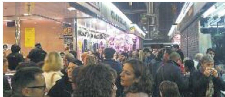
Els visitants van omplir el mercat de gom a gom.

GASTRONOMIA ▶ En el marc de la Festa Major del Clot-Camp de l'Arpa, el Mercat del Clot va acollir dissabte passat la seva quarta Nit de Tapes. L'esdeveniment, coorganitzat per l'Eix Clot, va aplegar més de 2.000 persones que van poder gaudir de les diferents creacions gastronòmiques realitzades pels paradistes amb els millors productes frescos.