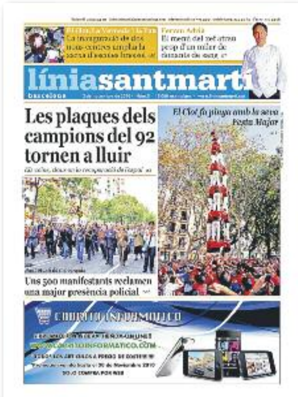
Número 5 · 3 de novembre de 2010