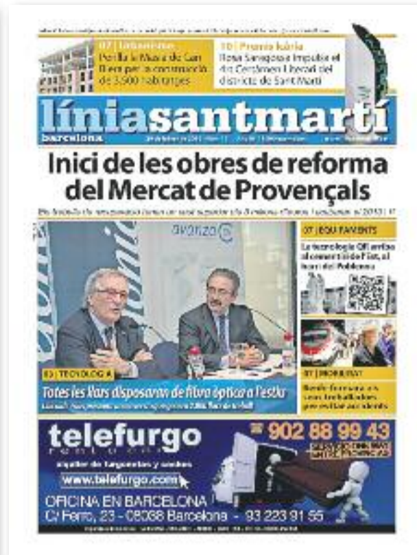
Número 17 · 29 de febrer de 2012