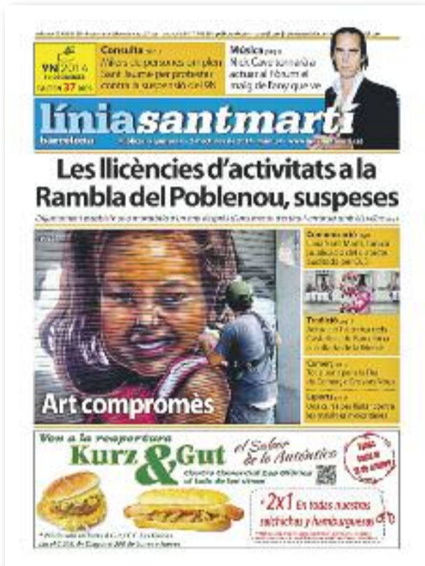
Número 54 · 2 d'octubre de 2014