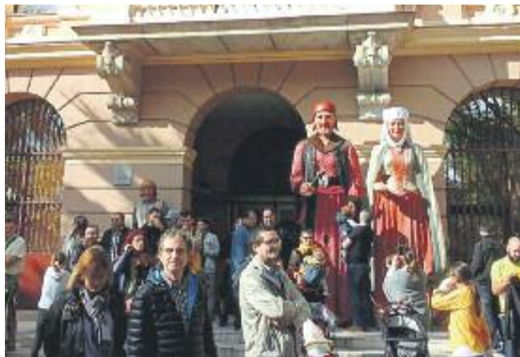
El Clot celebra aquests dies la seva Festa Major.