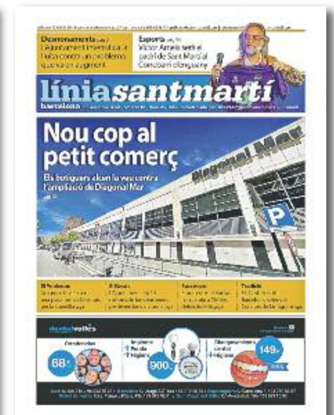
Número 98 · 6 d'octubre de 2016