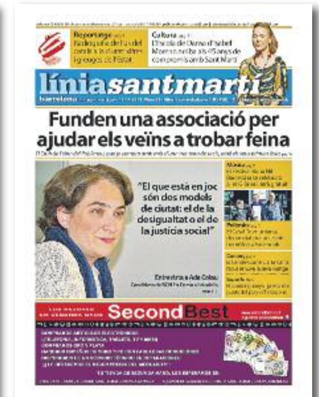
Número 66 · 16 d'abril de 2015