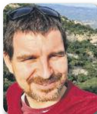
Pere Rovira Ball de Bastons del Clot

Els Castellers de Barcelona volem felicitar-vos efusivament per la vostra edició número 100, així com agrair-vos la vostra tasca de difusió que ajuda a entitats com la nostra a arribar a tots els racons del districte. El treball en equip per aconseguir un objectiu comú és un dels valors essencials que compartim amb vosaltres i que demostra que, quan les persones ens unim, la força humana no té límits. Enhorabona i que en siguin molts més!