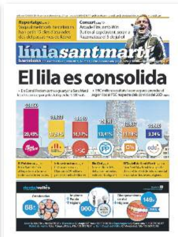
Número 93 · 29 de juny de 2016