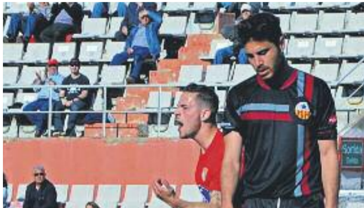
Els gris-i-grana no van poder puntuar al Vallès Occidental.

trobar-se amb la victòria diumenge al migdia, en el derbi contra el Sant Andreu a la Verneda.