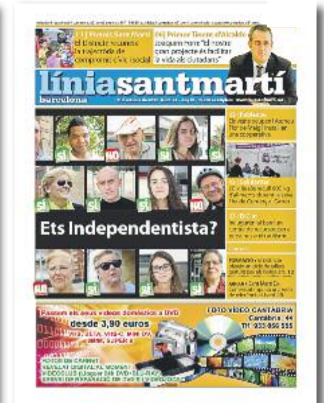
Número 24 · 31 d'octubre de 2012