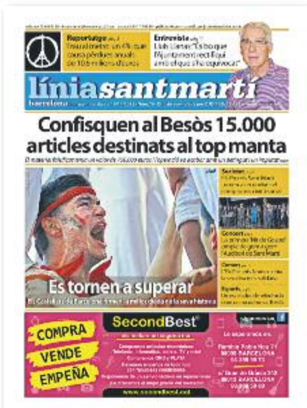
Número 79 · 19 de novembre de 2015