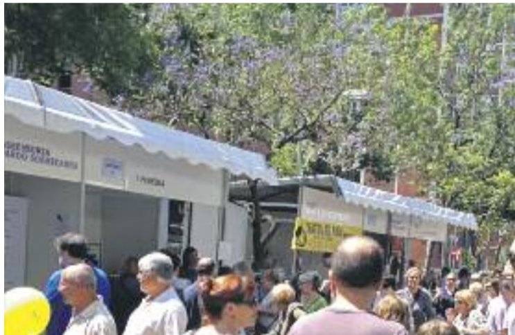
L'associació completa el seu cicle de fires d'enguany.

En termes de participació, des de l'eix asseguren que hi va haver "una bona afluència de visitants". Això s'explica perquè les previsions de pluja per a aquell dia no es van fer realitat, permetent que l'associació treís les seves botigues al carrer per escalfar motors de cara a la campanya de Nadal. De fet, va aprofitar la mostra per celebrar el sorteig dels quatre vals de compra