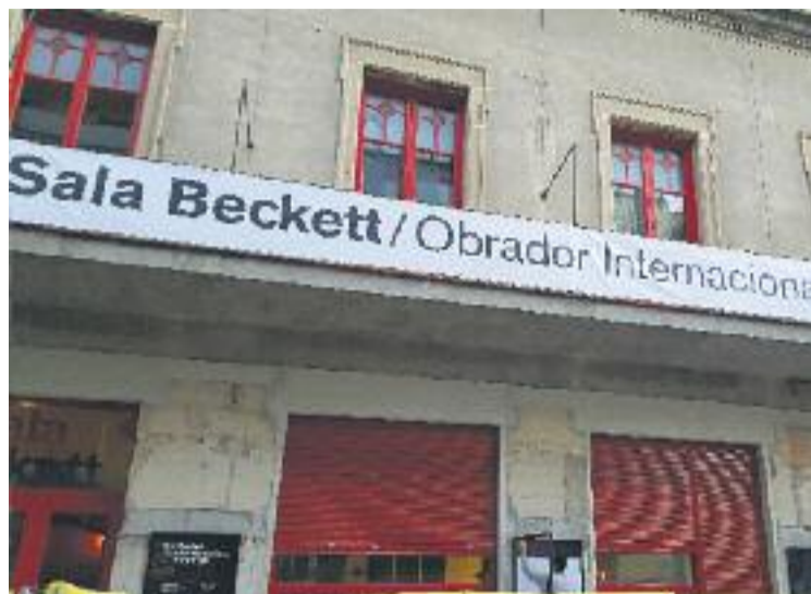
La nova Sala Beckett és al carrer Pere IV.

Així doncs, el projecte representa un canvi perquè estrena nova seu a l'antiga Cooperativa Popular de Consum Pau i Justícia del carrer Pere IV, però també perquè el projecte s'ha redifinit i ampliat, ja que s'ha adaptat al context socio-cultural actual i a la nova situació teatral, i ha adoptat un