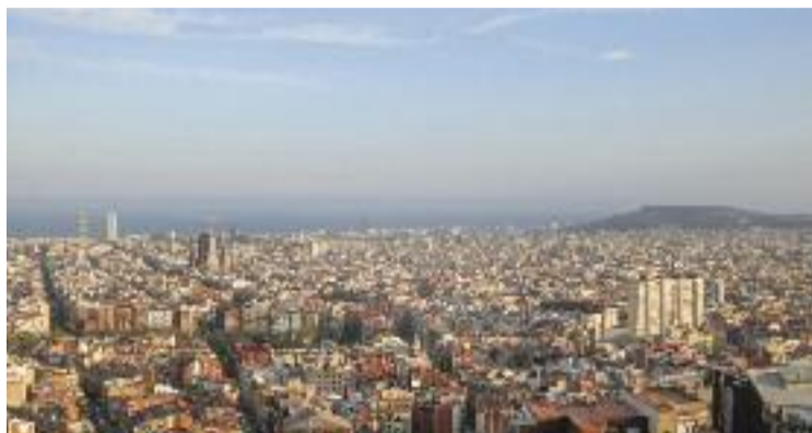
La ciutat està veient una millora en les xifres de l'atur.

Aquest acord ha de definir un full de ruta per als pròxims deu anys en matèria d'ocupació, incloent-hi perspectives de transformació social, sostenibilitat, innovació i abordatge de les desigualtats socials que compliquen l'accés al mercat laboral. Per assolir els objectius, es promourà la implicació de tots els agents socioeconòmics i la coordinació entre les diferents