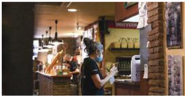
La restauració, un dels sectors que més ha patit la pandèmia.

AJUTS ▶ Un fons extraordinari de vint milions d'euros per donar suport als sectors econòmics que més han patit les conseqüències de la Covid-19: això és 'ReActivem Barcelona', un recurs que ha de donar un respir al comerç, la restauració i el turisme.