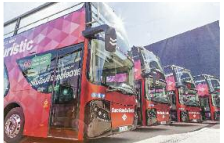
El servei ha tornat a funcionar aquest estiu després d'un any.

Quant a la sostenibilitat del servei, s'ha apostat per fomentar l'ús del transport públic en les visites, acostant les rutes a estacions com les de Sants o la Sagrera. Per últim, hi ha el compromís que els nous vehicles que s'incorporin a la flota siguin menys contaminants.