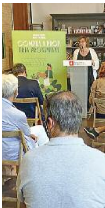
La presentació.

En aquest sentit, el consistori insisteix que "la lluita contra la desocupació i la precarietat és una prioritat absoluta del govern municipal" i recorda que, en els últims anys, ja s'han fet moltes accions en aquesta línia.