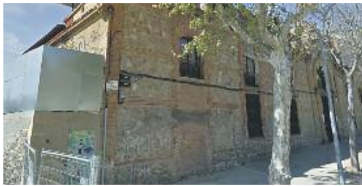
El centre es farà en aquest edifici de les Glòries.

HISTÒRIA ▶ El nou Centre d'Interpretació del Rec Comtal no tindrà, finalment, la seva seu a Sant Andreu de Palomar, tal com estava previst. L'Ajuntament va anunciar el passat 26 de març que aposta per la plaça de les Glòries com a ubicació definitiva, concretament a l'edifici de l'antiga fàbrica de paraigües del carrer Dos de Maig.