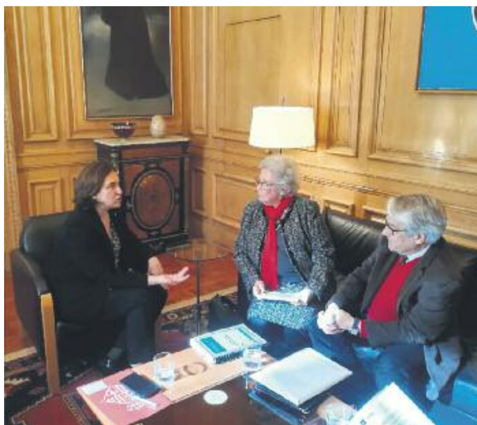
La situació del mercat immobiliari és una de les preocupacions que la Síndica ha exposat a l'alcalde Colau.