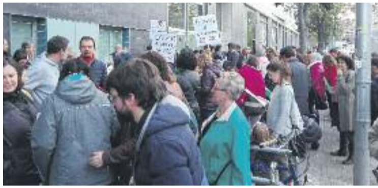
Imatge de la protesta del 16 de març.

Durant la protesta, que va tenir lloc al mateix CAP, els veïns van llegir un manifest per demanar "que es mantinguin els serveis de pediatria i ginecologia", al mateix temps que van deixar clar que no volen perdre "uns serveis sanitaris bàsics de proximitat que són necessaris i que fa temps que gaudim d'ells". Per últim, van deixar clar la seva voluntat de seguir manifestant-se fins que aconseguen el seu objectiu. Després de la lectura del manifest els veïns es van dirigir cap a l'escola El Sagrer,