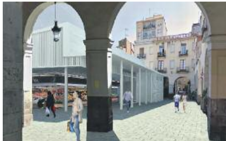
Imatge virtual de com quedarà el nou mercat.

El nou edifici del Mercat de Sant Andreu serà transparent, amb parets de vidre i un volum inferior a l'actual. Estarà format per dues plantes, una baixa i un soterrani. Les obres del nou mercat tenen un cost de 9,5 milions, els quals ja n'inclouen els 2,7 de la carpa provisional.