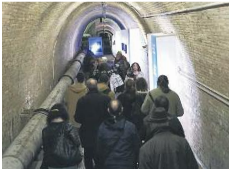
Fa uns dies ja es va fer una primera visita.

La Casa de l'Aigua va ser construïda per la companyia pública