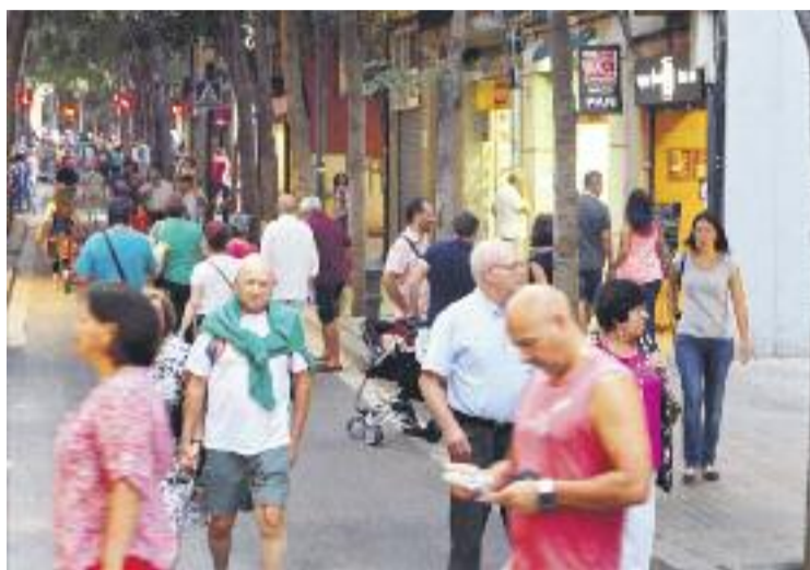
A l'Eix Sant Andreu gairebé no hi ha botigues de grans marques.