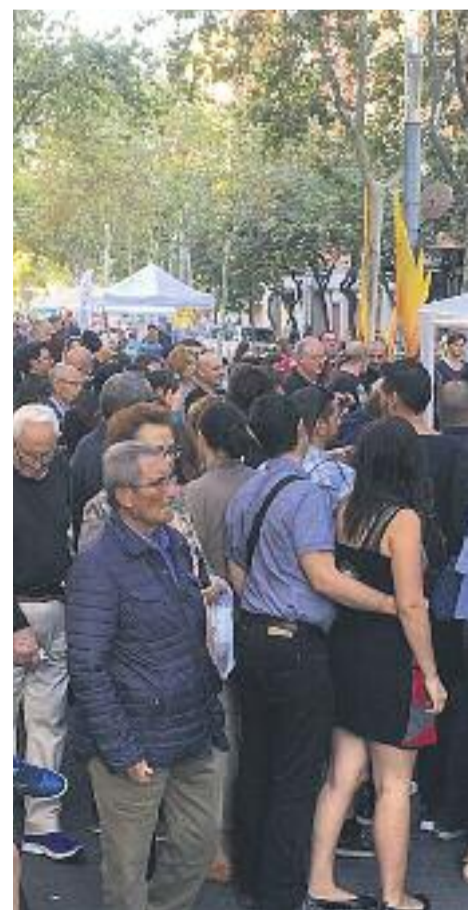
Moments de les darreres fires de l'entitat a la rambla.