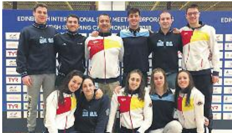
La representació del club a Escòcia.

dues victòries en el segon i en el tercer dia de competició. L'hortenca va tornar a exhibir el seu ritme imparable en la prova de l'hectòmetre el dia 2 i va aconseguir la victòria aturant el cronòmetre en 1 minut, 7 segons i 21 centèsimes. L'endemà, Vall va arrodonir la seva gran actuació individual amb una nova victòria, en aquest cas en la prova de 200 me-