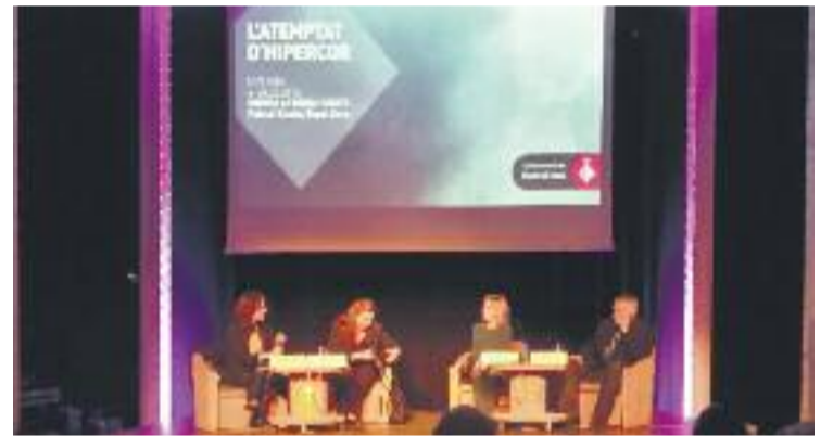
Un moment del debat celebrat el 13 de febrer.

Per la seva banda, Pilar Manjón va recordar que les víctimes de l'11-M van patir pels atemptats i per la posterior teoria de la conspiració amb els insults i el desprestigi que els va comportar.