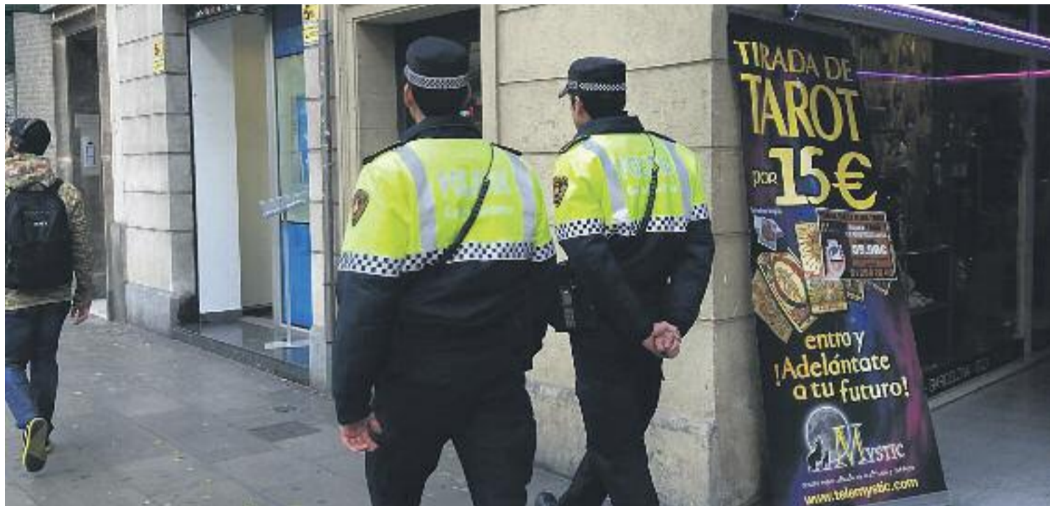
Una imatge de dos agents de la Guàrdia Urbana de servei.

SAPOL no és l'únic sindicat que denuncia aquesta situació des de fa temps. El sindicat CSIF (Central Sindical Independent i Transparent) va reclamar fa pocs dies una convocatòria immedia-