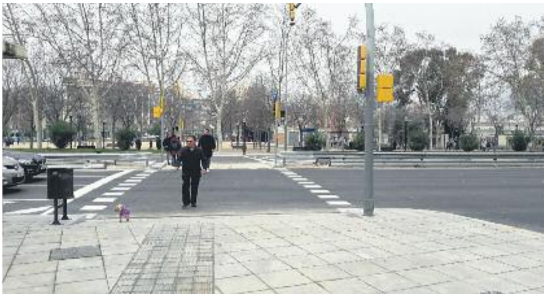
El nou pas de vianants inaugurat recentment.

A banda de l'exigència d'un compromís més definit per part de l'Ajuntament, Som Meridiana ha tornat a recordar que el projecte de reforma ha d'anar acompanyat d'una "millora dels