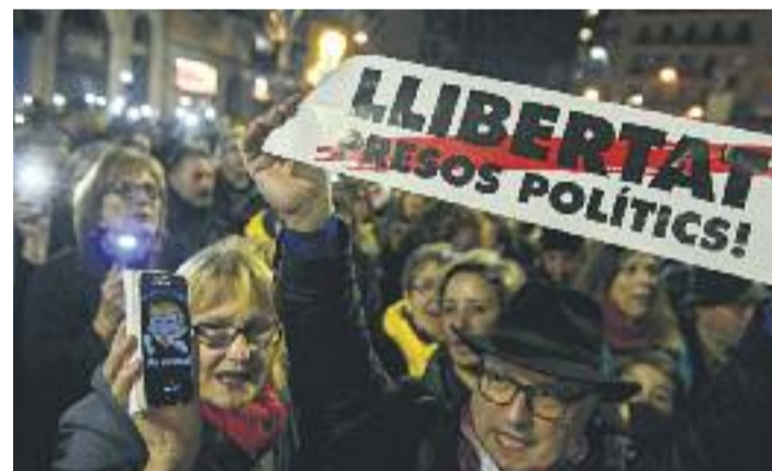
Línia Sant Andreu no comparteix necessàriament les opinions que els signants expressen en aquesta secció ni se'n fa responsable.

A Espanya la Democràcia està en llibertat condicional, imposada per la Brigada Político-Judicial.