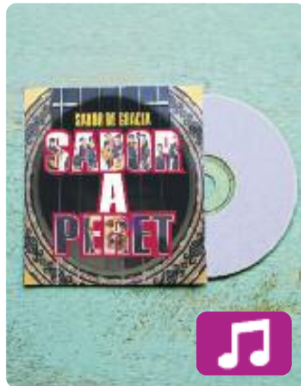
Sabor a Peret Sabor de Gràcia

Un àlbum d'homenatge al pare de la universalitat de la rumba catalana, Pere Pubill Calaf, més conegut com a Peret. Això és Sabor a Peret , el nou disc de Sabor de Gràcia, que es presentarà a la sala Luz de Gas el 15 de març.