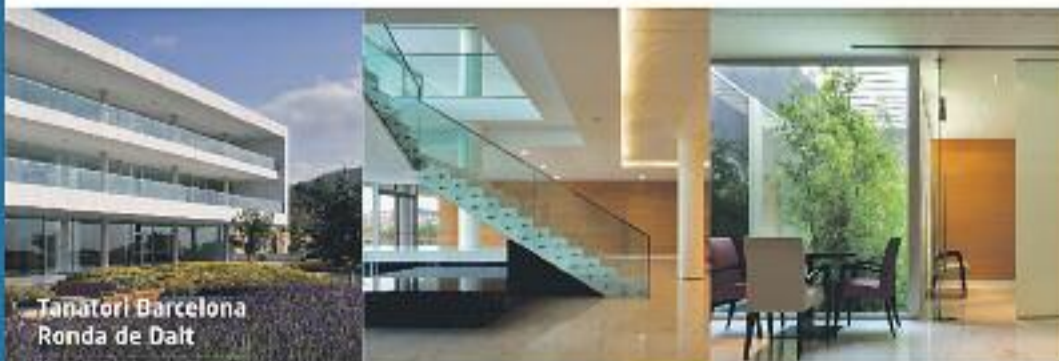
Tanatori Barcelona Ronda de Dalt

A ÀLTIMA preparem i dissenyem els serveis funeraris juntament amb les famílies, adaptant-nos als seus desitjos i a les seves necessitats. Per això, a ÀLTIMA sempre és la família qui decideix l'import total del servei contractat.