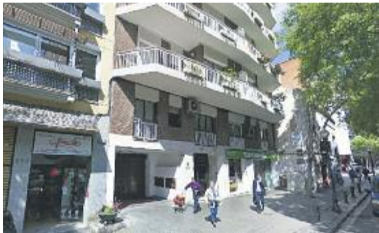
El preu del lloguer és un dels grans debats que hi ha a la ciutat.