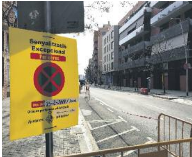
Els comerciants, molestos amb les obres.

En declaracions a Betevé, la vicepresidenta de l'Associació de Comerciants de l'Onze de