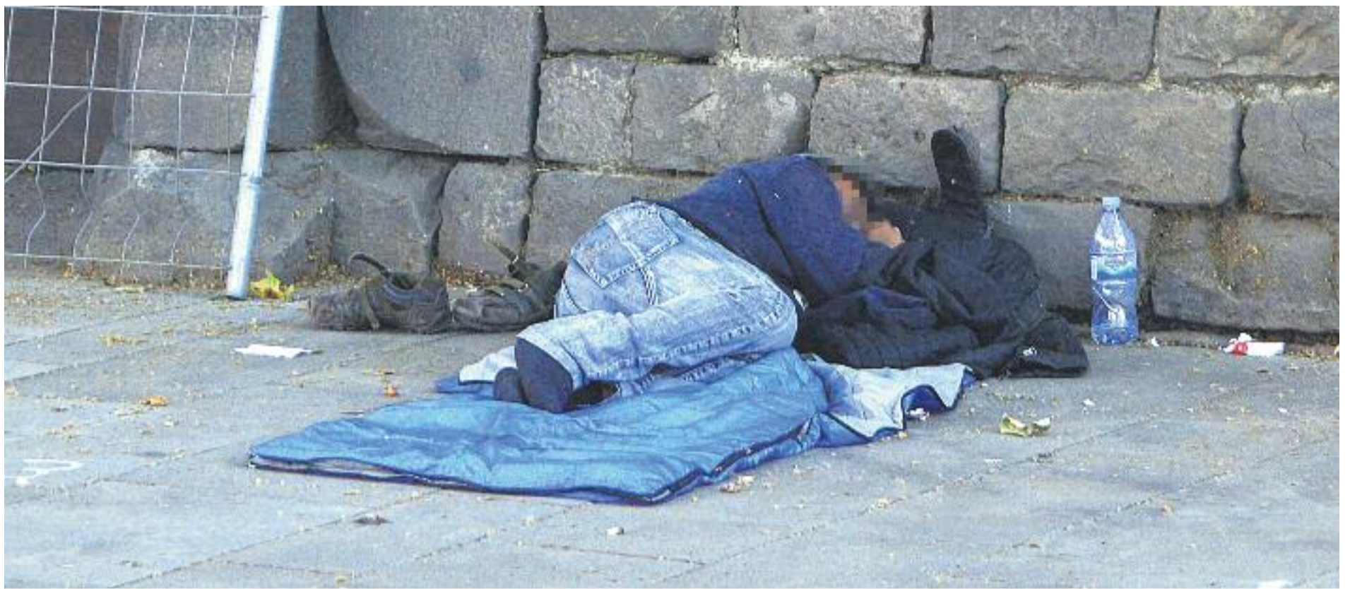
La pobresa també és la causa de situacions d'exclusió social.