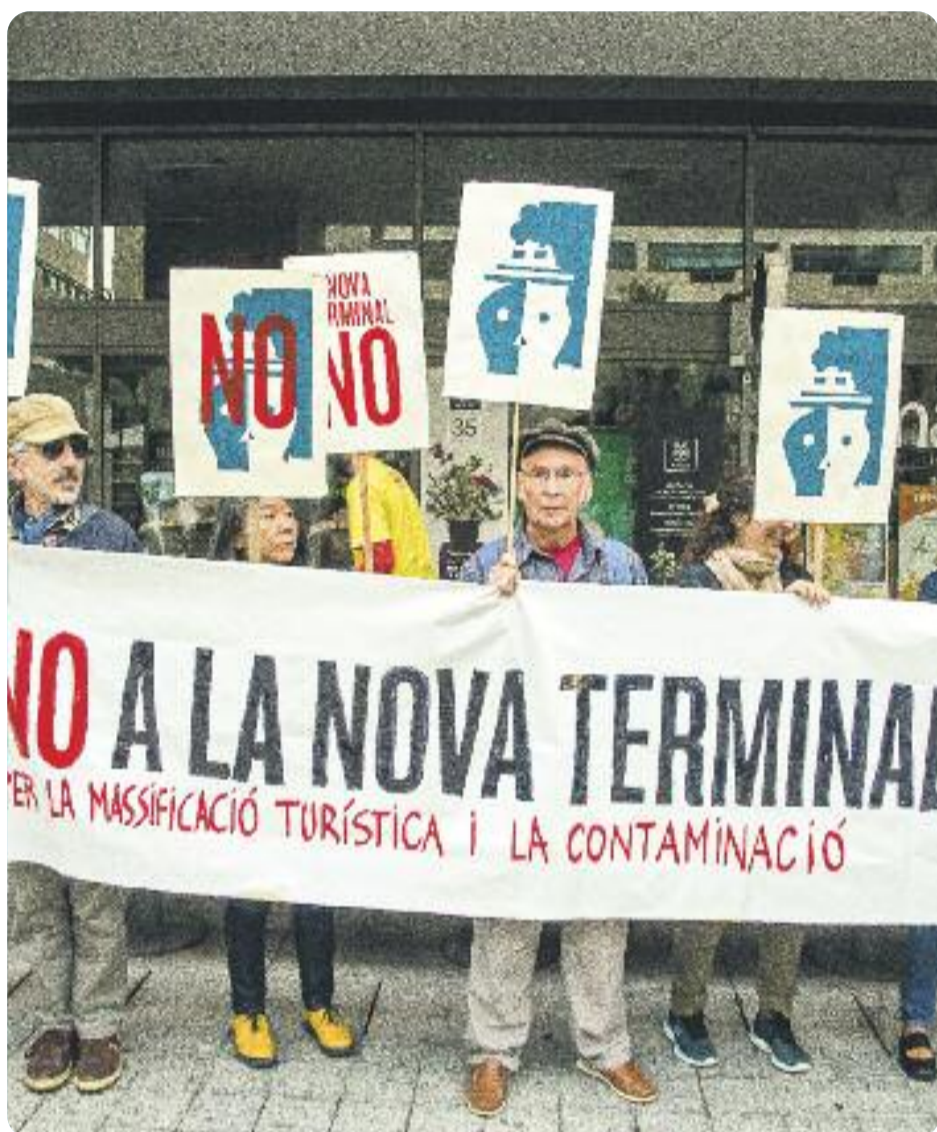
Una imatge de la protesta del 24 d'octubre.

Una cinquantena d'entitats rebutgen la construcció de la nova terminal de creuers del port