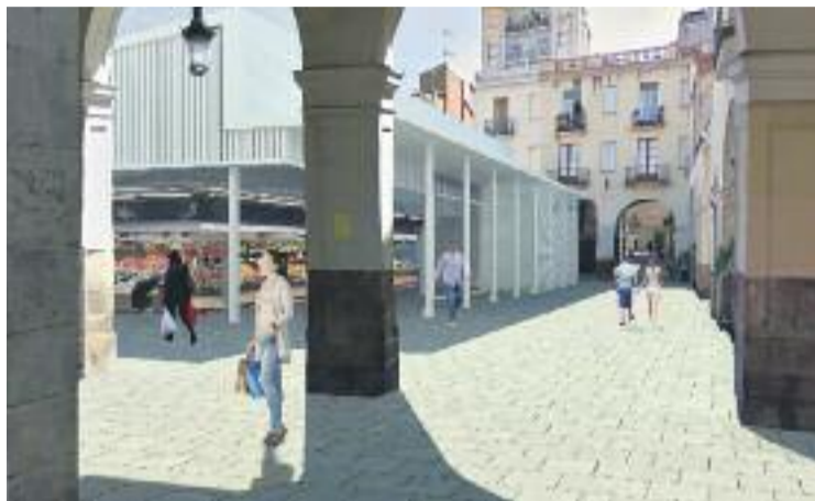
Una imatge virtual del futur Mercat de Sant Andreu.