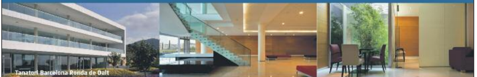
Tanatori Barcelona Ronda de Dalt

Ningú no vol venir a visitar-nos ni marcar el nostre telèfon.