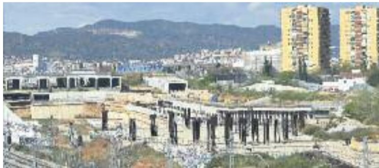
Les obres de la Sagrera s'han convertit en un malson veïnal.

Aquestes obres arribaran després que a finals de juny les de l'entorn de l'estació, concretament les del col·lector de Prim, que és fonamental per fer la resta de les obres. De fet el passat mes de juny el ministre de Foment, Iñigo de la Serna, va anunciar que les obres de l'estació acabaran el 2020.