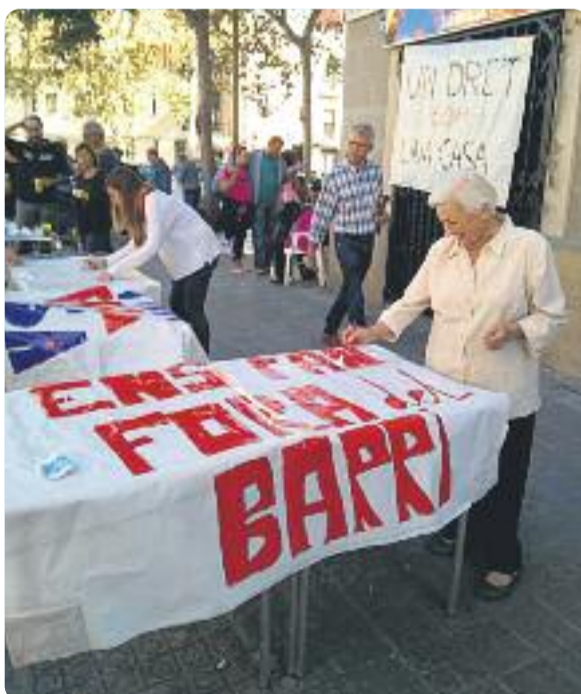
Una imatge del taller de pancartes.

Així doncs, des de bon matí la plataforma i els veïns afectats van sortir al carrer a preparar les pancartes amb els següents missatges de protesta: 'Ens fan fora de casa', 'Volem quedar-nos' i 'Un dret com una casa' per penjar-les als balcons. Des d'Ens Plantem defensen el dret dels veïns a continuar vivint al barri on han fet la seva vida o on l'estan construint i exigeixen que "les administracions intervinguin per garantir que aquest dret fonamental no sigui segrestat per les pràctiques especuladores dels fons inversors".