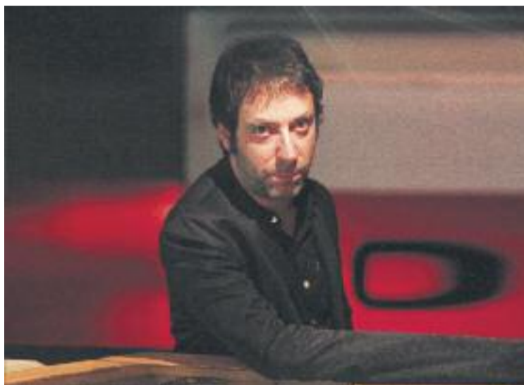
Mazoni serà el primer protagonista de l'enciSAT!.

Mazoni, consolidat com un dels grans noms de l'escena pop de Catalunya, passarà per Sant Andreu per presentar el seu nou disc 'Carn, os i tot inclòs'. El cantant de La Bisbal d'Empordà sorprèn amb un treball on torna a l'essència de la cançó acompanyat únicament de la seva guitarra i la seva veu. El disc és un viatge cap al cor de les cançons per mostrar-ne allò que és imprescindible: la melodia i la lletra. A les cançons es pot observar com les influències estilístiques del cantant són molt variades i van des del pop més melòdic ('Part d'un tot' i 'Sol') fins al rock més contundent ('Desig imbècil' i 'Opinió respectable'). Pel que fa a les lletres, hi ha des de les narracions llargues en forma de conte, filles d'altres cançons de Mazoni ('Finis Terre') fins a lletres que tracten la part emocional ('Mal, mel i mil i una nits') passant per la seva visió de l'escena política ('Pedres').