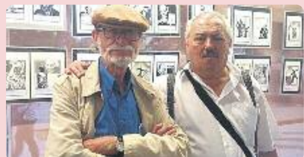
Ferrer, a l'esquerra, en una imatge d'arxiu.

Ferrer també va dirigir la revista juvenil Strong i va ser l'encarregat de descobrir al públic català personatges com Lucky Luke, els Barrufets, Spirou o Jano i Pirluit, entre molts altres.