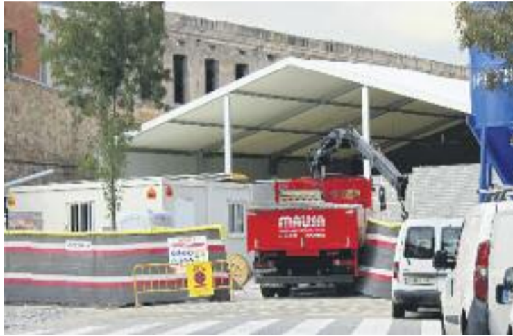
Imatge recent de les obres de la carpa provisional.

Aquest espai provisional està situat al carrer Sant Adrià, entre Segre i d'Otger –a 200 metres de l'antic mercat–, i estarà format per dos mòduls encaixats que acolliran 25 paradistes. L'accés principal al mercat serà a la confluència dels carrers de Sant Adrià i d'Otger, de forma que sigui ben visible i estigui a prop de la zona comercial del barri. Hi haurà, a més, una segona entrada a la façana lateral, just a davant de la biblioteca Ignasi Iglesias-Can Fabra. El cost de la seva construcció, que ha durat una mica més de quatre mesos, ha estat de dos milions d'euros.