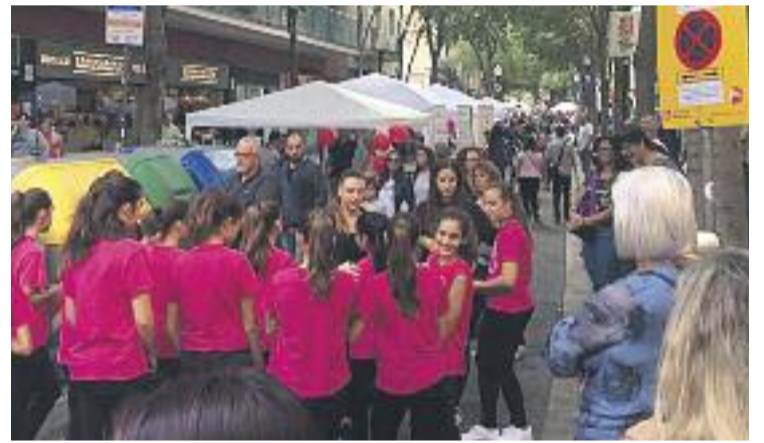
La festa va reunir milers de veïns al carrer Gran.