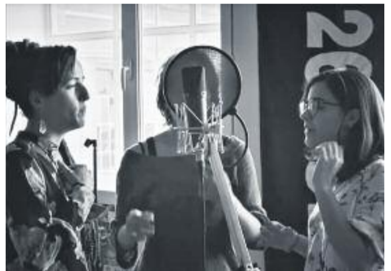
Les Marala interpreten una part de la cançó.

L'estètica del videoclip és combativa i es caracteritza per les imatges que hi apareixen tenyides de vermell. Des de l'Ateneu l'Harmonia han volgut donar les gràcies a Muguruza "per la cançó, per la força, per la lluita i per ser al nostre costat".