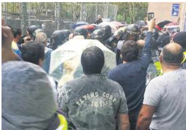
Imatge de la Policia Nacional a l'IES Joan Fuster.

L'IES Joan Fuster, però, no va ser l'únic punt on la jornada va quedar alterada. A l'Escola Estel els ciutadans que van voler votar també van patir l'actuació de la policia. Agents antidisturbis hi van entrar esbotzant la porta per tot seguit fer