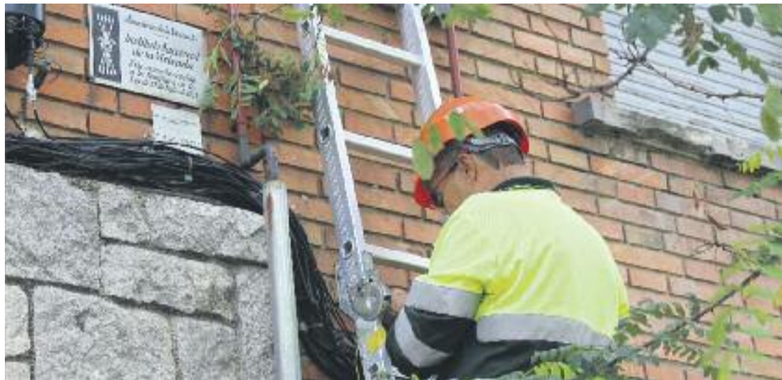
Un operari, a punt de retirar una placa franquista.

MEMÒRIA HISTÒRICA ▶ Sant Andreu ja no té plaques franquistes. El Districte ha retirat recentment les 128 plaques de l'institut públic de l'habitatge del franquisme que encara hi havia en diferents façanes dels set barris del districte. D'aquesta manera, Sant Andreu s'afegeix a Gràcia i Nou Barris, que ja havien fet el mateix procés anteriorment i esborra del seu espai públic el record del franquisme.