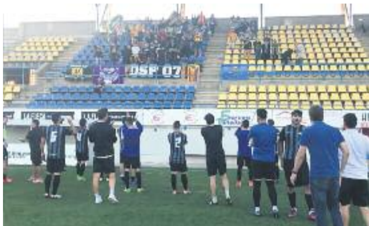
Jugadors i afició celebren la victòria a Palamós.

Les victòries a Granollers, a Palamós i a Castelldefels (entremig d'aquests enfrontaments l'equip va aconseguir un empat al Narcís Sala en el derbi contra la UA Horta) han permès que els d'Azparren abandonessin la zona perillosa de la taula (estaven empatats a punts amb l'avantpenúltim després de les cinc primeres jornades de competició) i que un cop s'han jugat les 10 primeres jornades de la competició, la realitat de l'equip sigui pensar molt més en un hipotètic play-off que no pas en fugir per evitar les posicions de descens. Fins ara, la