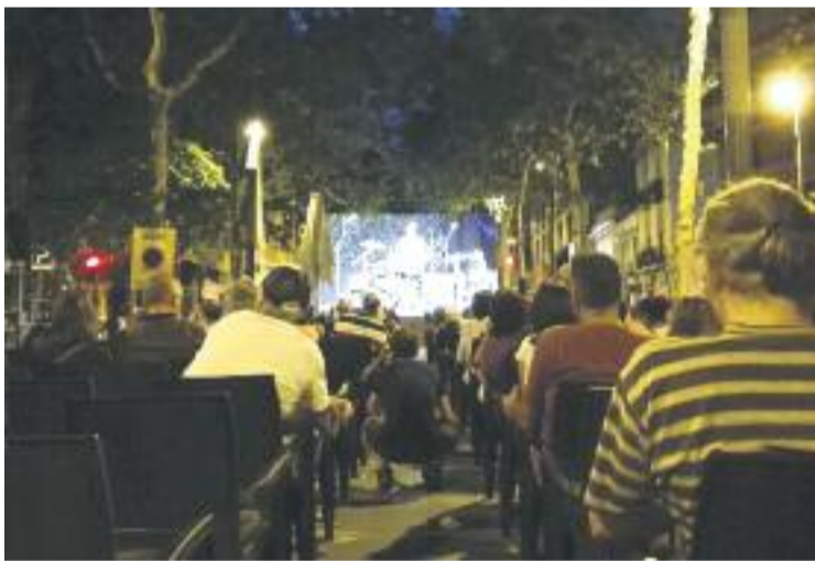
La rumba dels Gipsy Kings va animar el barri.