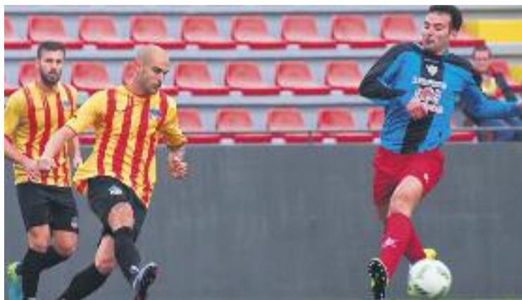
Els quadribarrats són a punt de tornar a la feina.

El primer equip ja és a punt de tornar a la feina, però en l'imaginari col·lectiu, el passat 28 de juny es van complir 25 anys del partit