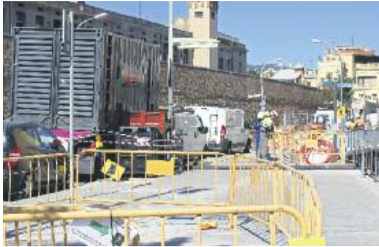
El mercat provisional s'està construint a prop de l'antic.

La reforma del Mercat de Sant Andreu suposarà l'enderroc