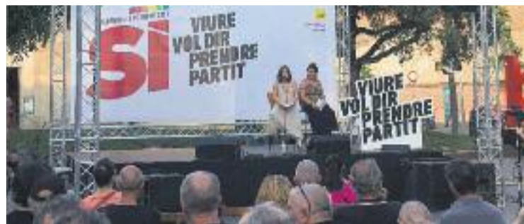
Una imatge de l'acte del passat dia 22.

REFERÈNDUM ▶ La CUP va donar el tret de sortida a la campanya pel Sí al referèndum del pròxim 1 d'octubre el passat 22 de juny des de la plaça Orfila de Sant Andreu davant més de 200 persones.