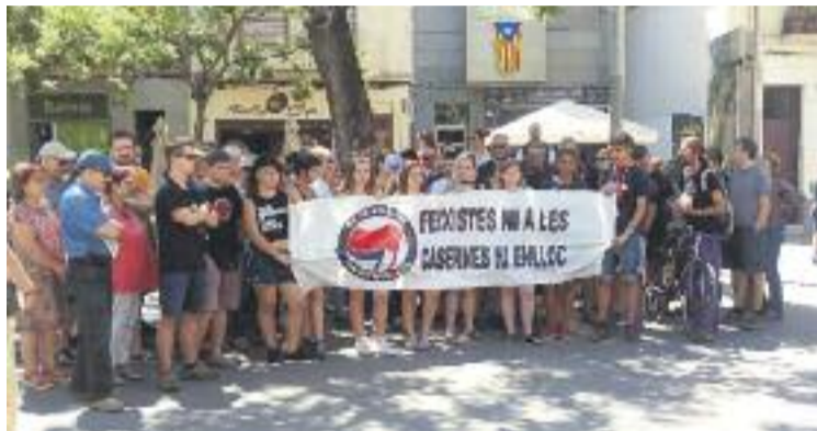
Una imatge d'abans de l'inici de la manifestació.

La marxa va arribar al local de la Hermandad on, tot i alguns