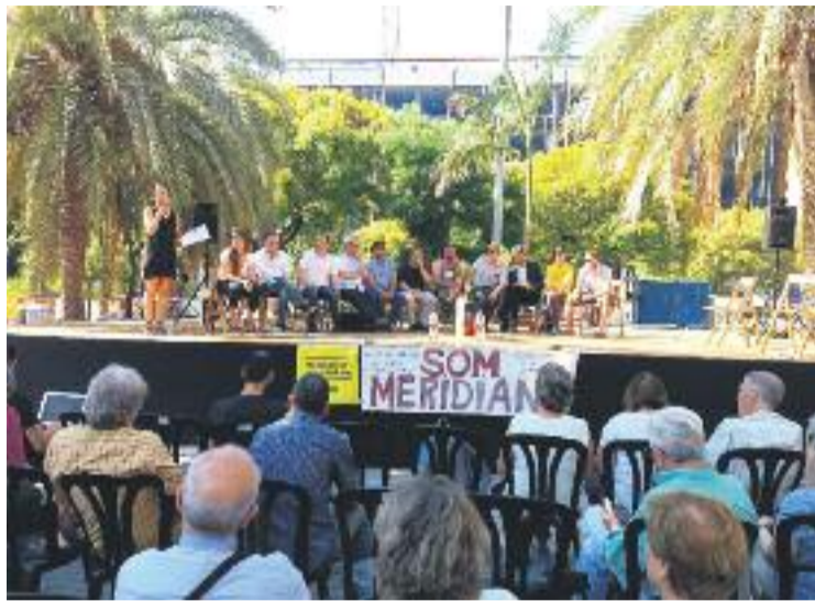
Una imatge de l'acte del 17 de juny.