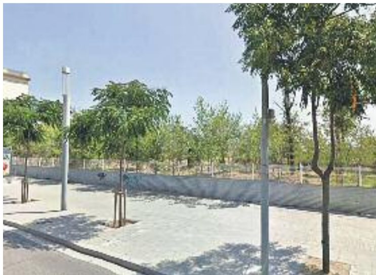
Un dels solars de les casernes on hi ha pendent fer habitatge públic.

Les dues associacions de veïns recorden que "després de tants anys de reivindicació hem vist passar diversos equips de govern a l'Ajuntament, i les excuses sempre giren entorn de les dificultats de tramitació i a la mala gestió de l'anterior equip de govern". Afegeixen que és