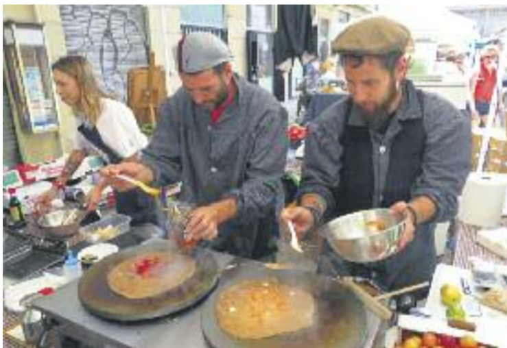
Els mercats s'han omplert d'activitats durant el maig.