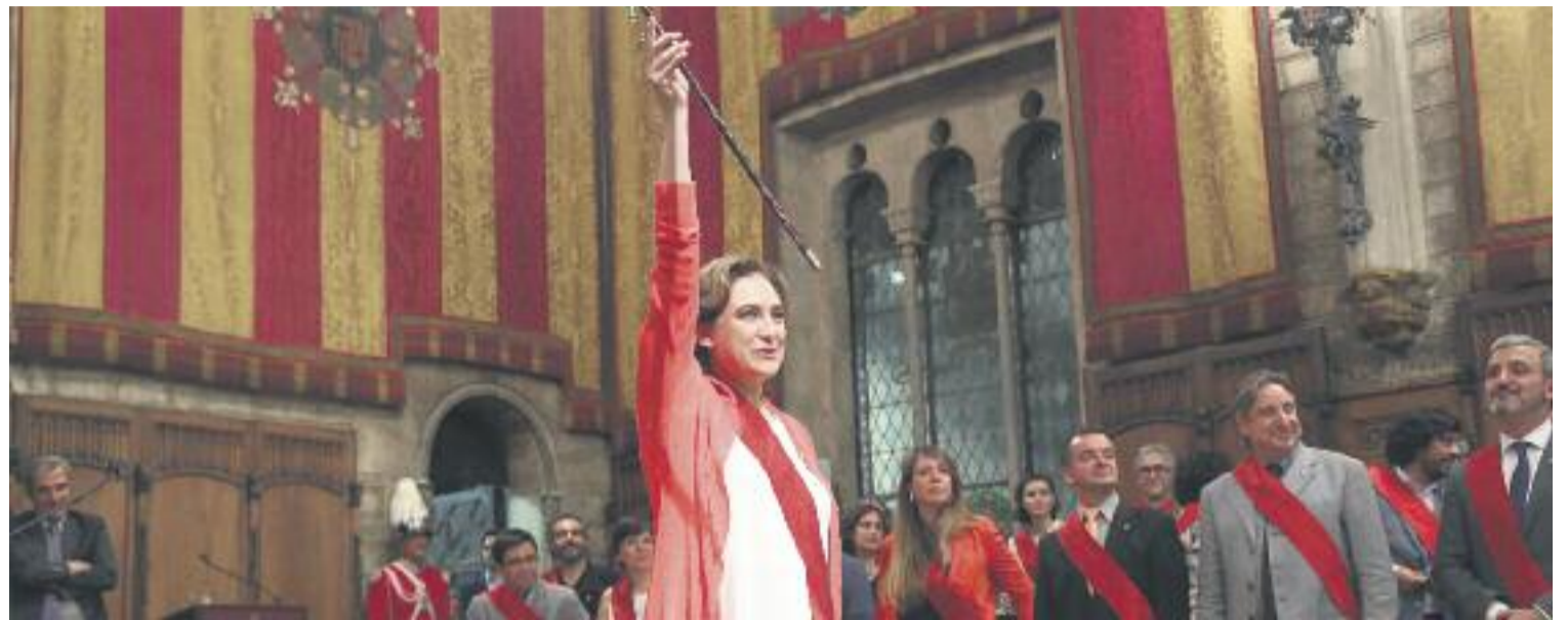
Colau, el dia de la presa de possessió com a alcaldessa.

L'actual alcaldessa, que ha estat mare recentment, va iniciar el mandat amb molta ambició. Feia falta començar a complir les múltiples promeses fetes a la ciutadania durant la campanya electoral. Han passat dos anys i, segurament, la gran victòria de Colau i el seu govern —primer en solitari i després amb el PSC— és la d'haver canviat, i dominat, l'agenda política de la ciutat. El turisme i l'habitatge, els dos grans temes on els comuns van posar més èmfasis durant la campanya, ocupen ara la centralitat del debat polític. L'aprovació del Pla Especial Urbanístic d'Allotjaments Turístics (PEUAT), pactat amb ERC, ha estat la seva victòria més