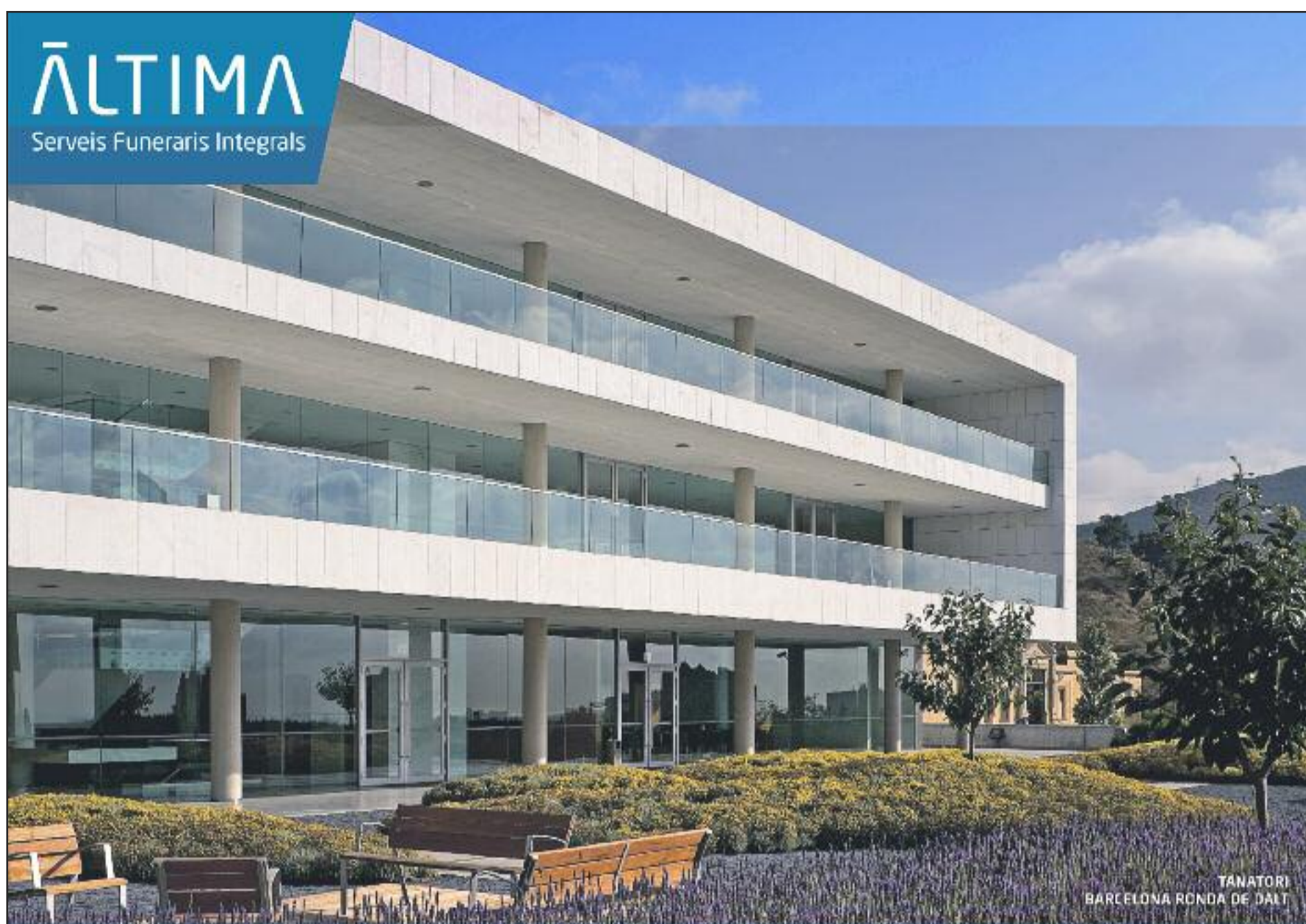
TANATORI BARCELONA RONDA DE DALT