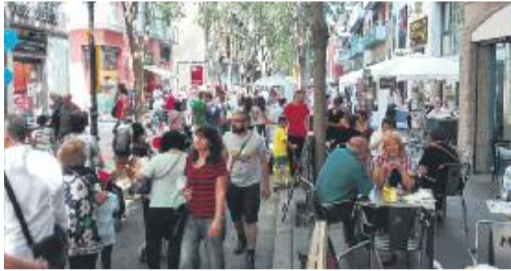
Els andreuencs van respondre a la crida dels botiguers.

Aquesta jornada, que sempre se celebra el primer cap de setmana de juny, es va decidir avançar cap a finals de maig per tal d'evitar fer-la a prop del pont del 5 de juny, durant el qual