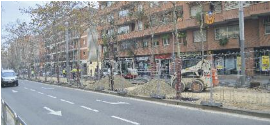
Les obres del primer tram van des del carrer de Santa Coloma a Gran de Sant Andreu.

OBRES ▶ El Districte va posar en marxa fa unes setmanes les obres de reforma del paviment de l'avinguda de l'Onze de Setembre. Està previst que la transformació completa es porti a terme en quatre fases diferents.