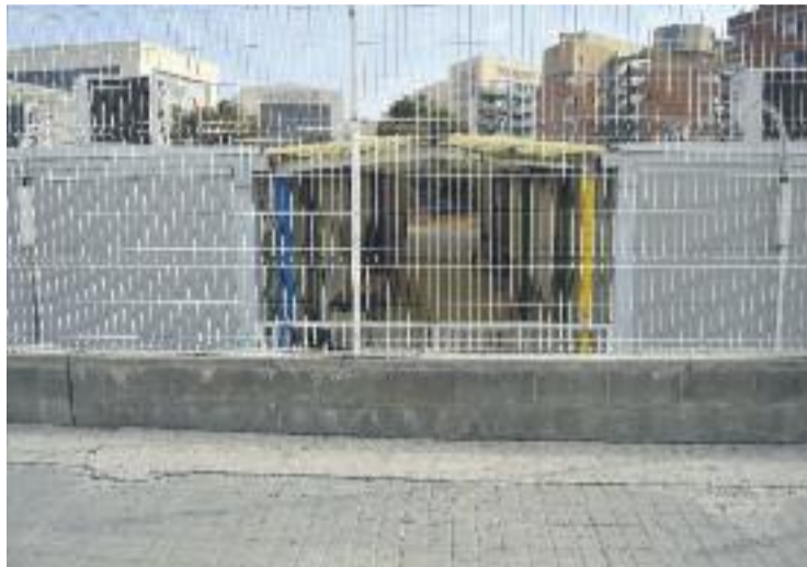
Una imatge dels barracons de l'escola La Maquinista.

La situació que pateix l'escola té el seu origen en el fet que la construcció del seu edifici definitiu no es pot fer sense el consentiment del centre comercial La Maquinista, que a canvi demana la construcció d'un nou aparcament amb capacitat per a 2.000 cotxes. El 2013 el govern de Xavier Trias va apostar per vincular la construcció definiti-