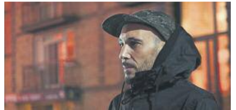
Mucho Muchacho, de 7 Notas 7 Colores.

FESTIVAL ▶ El Festival de cultura musical independent Cara B celebrarà la seva pròxima edició els dies 17 i 18 de febrer. I ho farà amb un cartell de luxe.