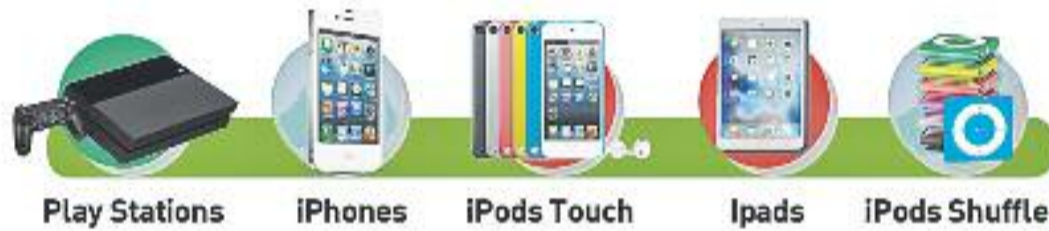
Play Stations iPhones iPods Touch Ipads iPods Shuffle