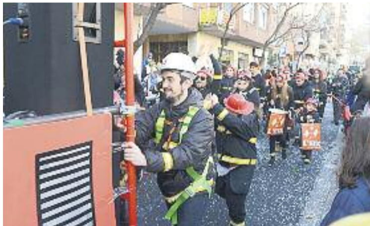
La rua del dia 26 recorrerà el barri de dalt a baix.

Això pel que fa a dissabte, ja que l'endemà serà el torn de la ja tradicional Rua de Carnestoltes de l'eix, que enguany arribarà a la tretzena edició.