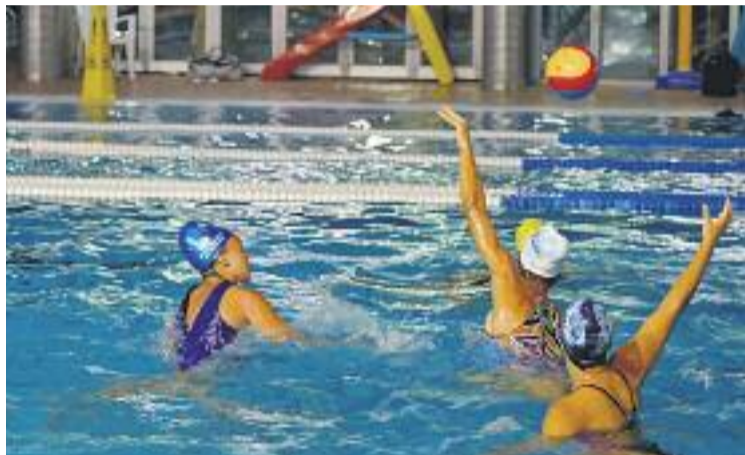
Les de Javi Aznar hauran d'afrontar un repte duríssim.

L'eliminatòria contra les vallesanes (i la resta de partits de la Copa de la Reina) es podran seguir en directe via streaming al portal web de la Federació espanyola de natació ( www.rfn.es ).