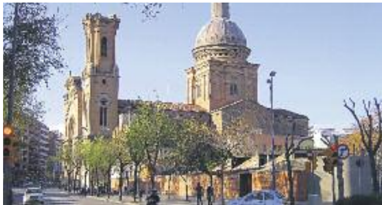
Sant Andreu és el segon districte amb una renda familiar més baixa.

Així doncs, l'estudi mostra com La Trinitat Vella, Baró de Viver, El Bon Pastor, Sant Andreu i El Congrés i els Indians van acabar el 2015 sent més pobres que a finals del 2014. En aquests barris, l'índex de la Renda Familiar Disponible (una xifra que col·loca els districtes i els barris en una puntuació respecte de la mitjana, situada en 100) va patir un descens. Al mateix temps, també va servir per confirmar que la Trinitat Vella és el barri on la pobresa colpeja en més força: el seu índex de Renda Familiar Disponible se situa en 43,1 punts, cosa que fa que si-