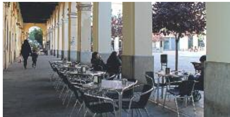
Les terrasses s'instal·len a l'interior dels pòrtics.

TERRASSES ▶ El consistori ha aprovat la distribució prèvia de les terrasses de l'emblemàtica plaça Masadas. La nova distribució preveu retirar els vetlladors del centre de la plaça i, d'aquesta manera, garantir la visió de les façanes neoclàssiques. Segons informen des de l'Ajuntament en un comunicat, la redistribució ha estat consensuada amb els veïns.