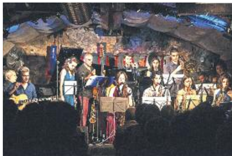
Una imatge del concert del passat mes de novembre.

El repertori ret homenatge a les grans dames del jazz, com ara Billie Holiday, Ella Fitzgerald, Sarah Vaughan i Dinah Washington, entre altres. Es tracta d'una relectura dels clàssics gràcies al talent del magnífic planter de jazz de Sant Andreu.