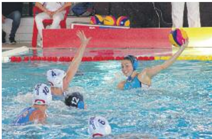
L'equip va tancar la competició derrotant el Bogliasco.

I és que, malgrat l'eliminació, el club ha acabat amb unes sensacions notables pel rendiment de l'equip, un dels blocs més joves de la competició, i confia en