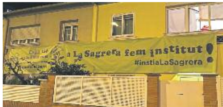
Imatge d'una pancarta reivindicativa.

ENSENYAMENT ▶ Un grup de famílies de les cinc escoles públiques del barri de la Sagrera han posat en marxa la campanya 'A la Sagrera Volem Institut' per reclamar la construcció d'un nou institut.