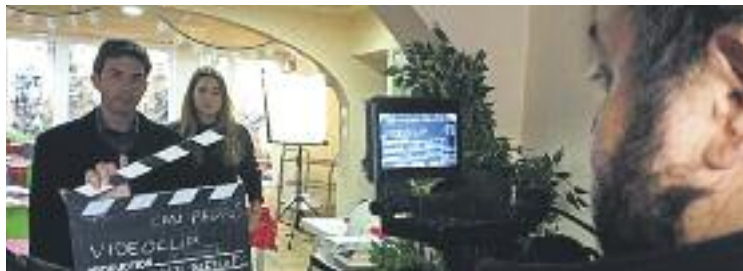
Rodatge del clip solidari, amb Planas i Fuentes.

El certamen té el mateix format que en les passades edicions. Els equips que s'han presentat han elaborat un curtsmetratge d'una durada màxima