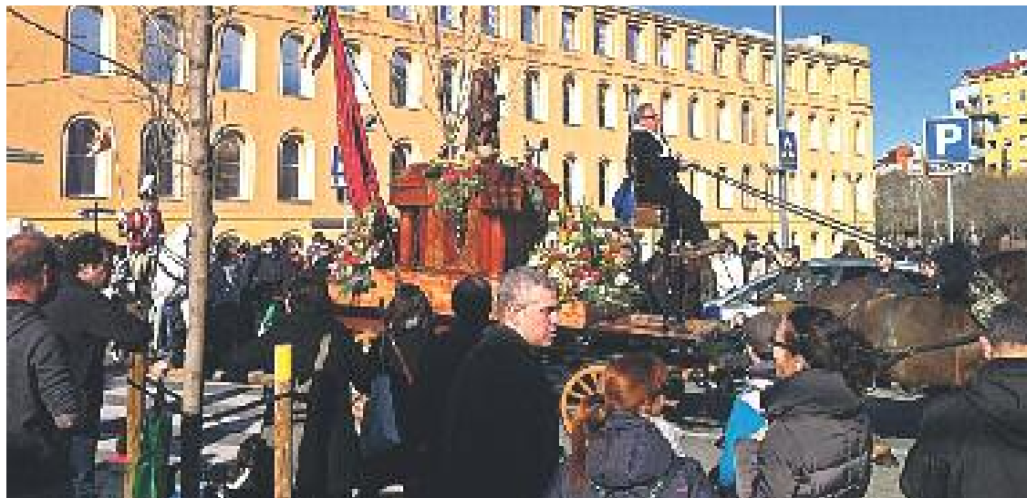
Els Tres Tombs d'enguany van tornar a ser un èxit.

TRADICIÓ ▶ Els Tres Tombs és una de les tradicions més importants del calendari de festes de Sant Andreu. Els passats 14 i 15 de gener va tornar a quedar demostrat quan, un any més, els andreuenes van sortir al carrer per gaudir d'aquesta celebració en honor a la festivitat de Sant Antoni Abat.