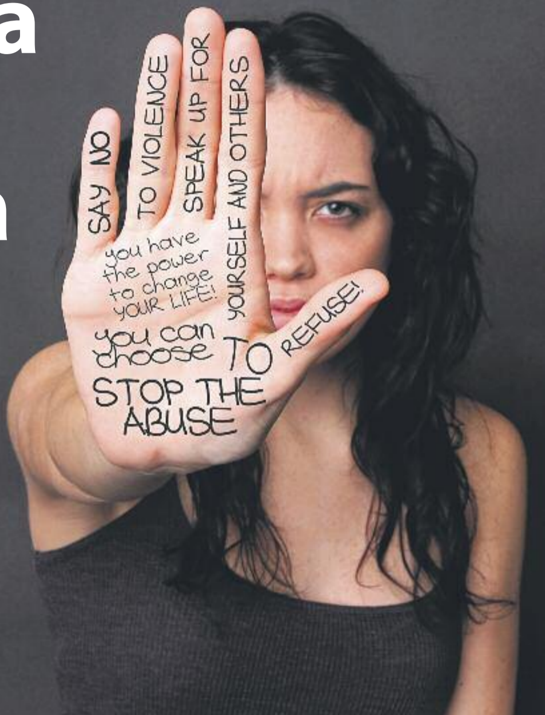
L'any passat 1.445 dones van denunciar haver estat víctimes d'una agressió o abús sexual a Catalunya.

» Tot i les xifres alarmants, es "naturalitza" i es menysté un problema que cal afrontar des de tots els àmbits