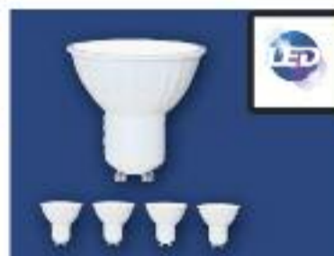
DICROICA LED SMD 220v-5w angulo 120° Color 4000k 450 Lumenes 84339573101502