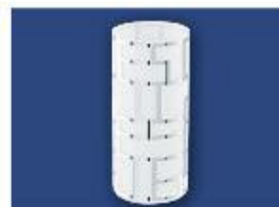
SOBREMESA CRISTAL BAYMAN COLOR BLANCO Y CROMO PORTALAMPARAS E27 9002759919719