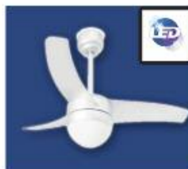
VENTILADOR DE TECHO CON LUZ DE LÍNEAS MODERNAS IDEAL PARA HABITACIONES. BOMBILLAS DE LED INCL Y COLOCACIÓN