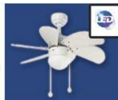
VENTILADOR DE TECHO CON LUZ IDEAL PARA HABITACIONES. BOMBILLA AS DE LED INCLUIDAS Y COLOCACIÓN