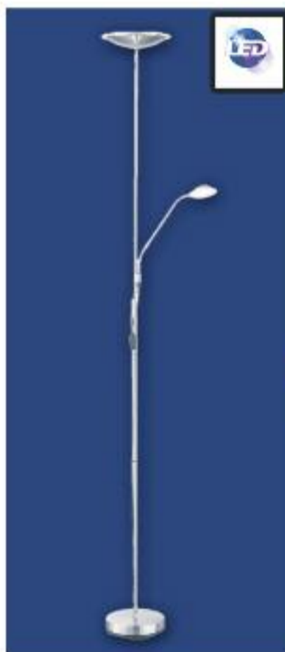
PIE SALÓN DE LED