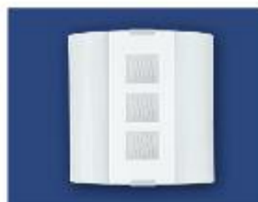
APLIQUE PARED DE CRISTAL GRAFIC PORTALAMPARAS E27 9002759831349