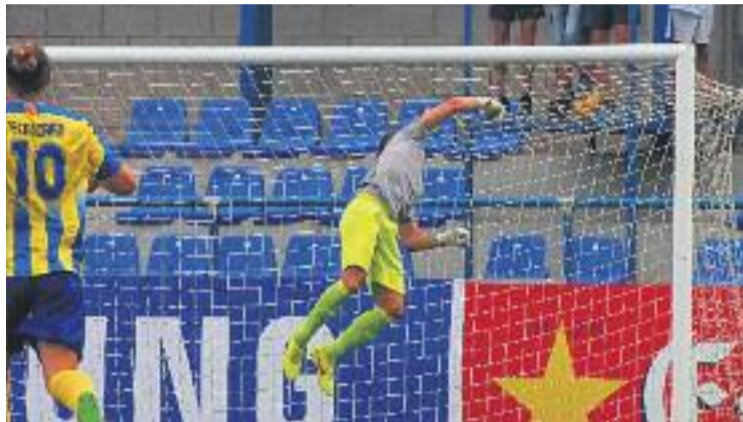
Segovia va ser un dels millors a Palamós.

Els arlequinats, avant penúltims, encara no han aconseguit guanyar en el que va de lliga, però visitaran el Narcís Sala amb la moral pels núvols després d'haver su-