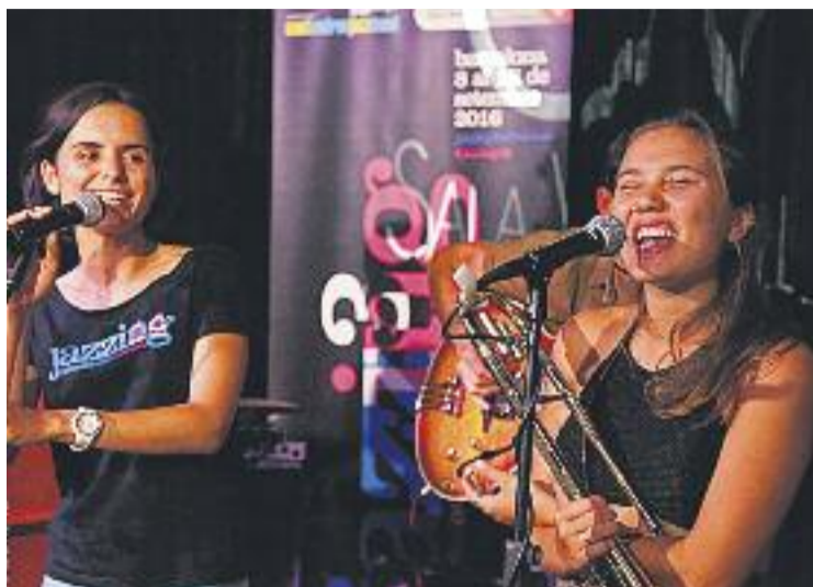
El talent jove ha tornat a emergir en la tercera edició del Jazzing.