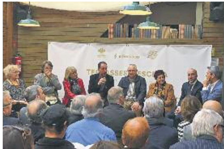
El llibre es va presentar a la llibreria Laie.

Després de l'acte de presentació es va fer un aperitiu amb cervesa, proporcionada per San Miguel.