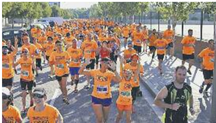
Un moment de la cursa de l'any passat.

ATLETISME ▶ Ja queden pocs dies per a una nova edició de la Cursa solidària de la Maquinista per la integració, que tindrà lloc el pròxim 16 de maig, en una jornada festiva –la segona Pasqua– per intentar incrementar la participació.