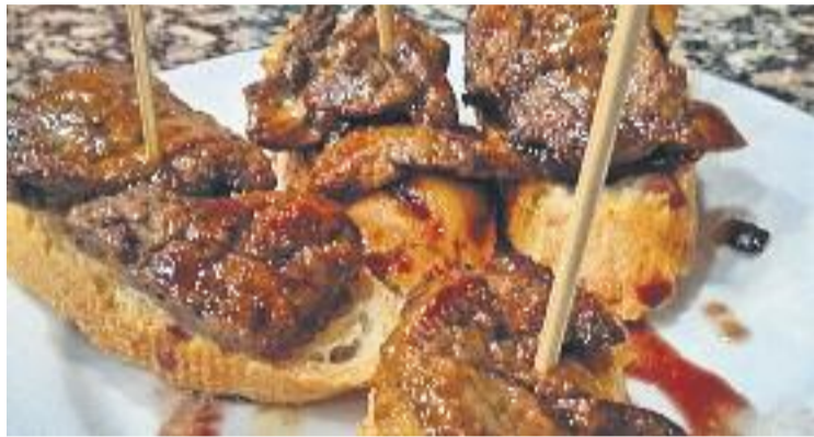
La ruta començarà el pròxim 12 de maig.

Pel que fa a les anteriors edicions, l'associació afirma que van ser "un èxit de participació",