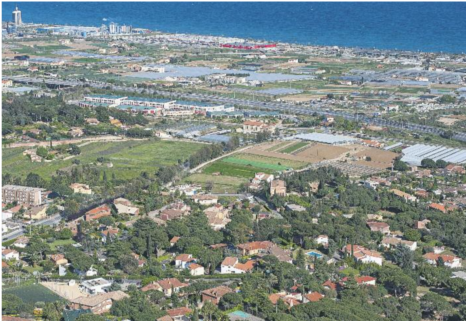
El programa està destinat als municipis de la demarcació i inclou dues línies de suport.

» La Diputació impulsa un nou programa de foment de l'ocupació i de suport a la integració social » El pla beneficiarà 5.000 persones i dóna llibertat als contractadors i autonomia als ajuntaments