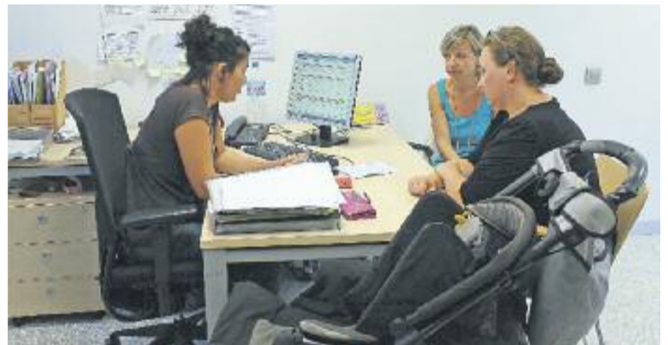
El SAIER dona suport als refugiats (a l'esquerra i a baix a la dreta), 41 dels quals viuen ara a la Casa Bloc de Sant Andreu, districte on s'han fet xerrades informatives (a dalt a la dreta).