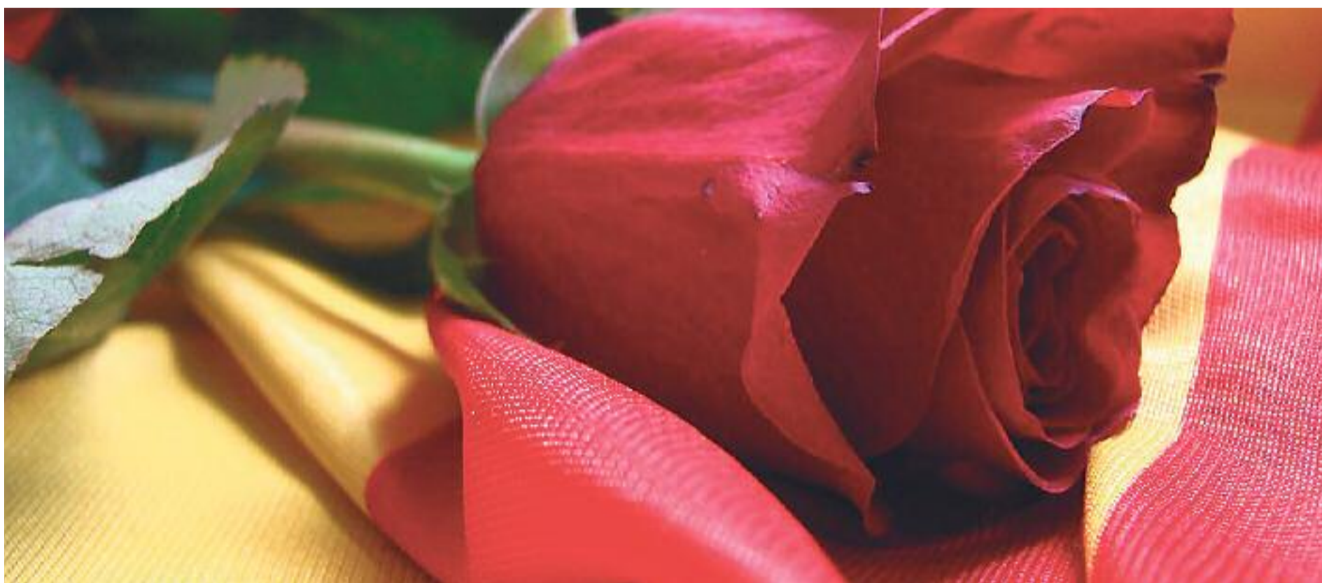
Ja està tot a punt perquè Sant Jordi torni a omplir els carrers de llibres i roses.