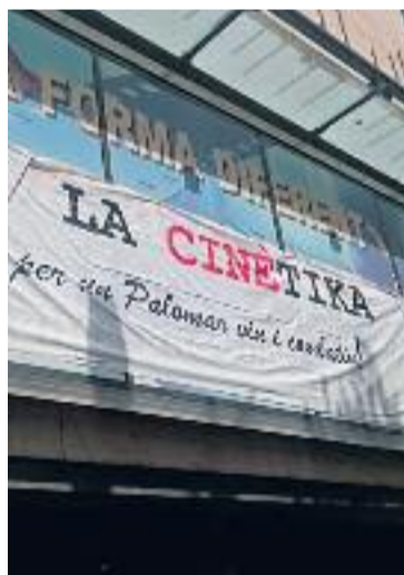
La Cinètika.

El nou espai ja ha acollit diferents activitats. Una de les primeres va ser un dinar amb membres de la PAH i aquest diumenge va acollir una jornada que va arrencar amb un dinar popular i va continuar amb l'actuació musical de Malamara soundsystem, la projecció del documental Somonte i un col·loqui amb "lluitadores per la terra".