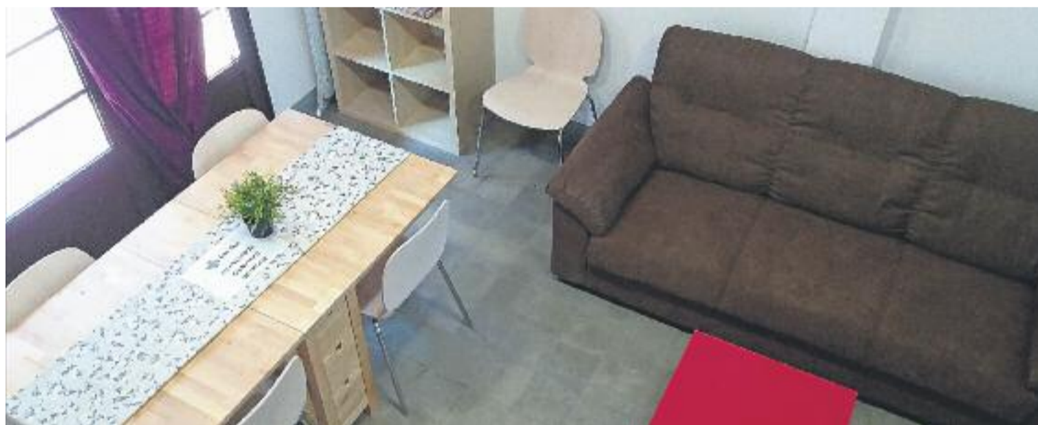
La Casa Bloc és un exemple d'arquitectura racionalista i ara ha estat reformada interiorment per acollir les persones refugiades.

Comissió Catalana d'Ajuda al Refugiat (CCAR) –una de les tres entitats que gestiona l'acollida–, explica que l'objectiu que es marquen les entitats mentre les persones refugiades són a la Casa Bloc és que aquestes "comencin a tenir un espai de tranquil·litat, de saber que estan en un lloc segur i que se les protegirà". Pareja explica que durant aquest procés també es busca que el refugiat "conegui l'entorn, aprengui l'idioma i pugui fer gestions ràpides com l'empadronament, la targeta sanitària o l'escolarització dels que tenen fills", al mateix temps, aconseguir "benestar emocional i tenir una bona salut física i mental".