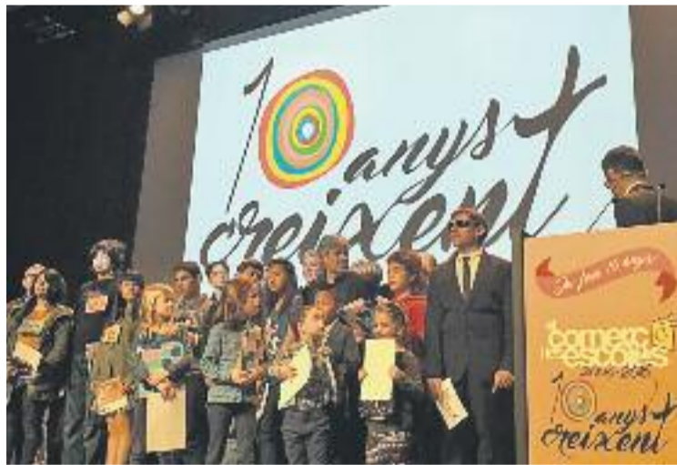
Un moment de la gala del passat dia 12.