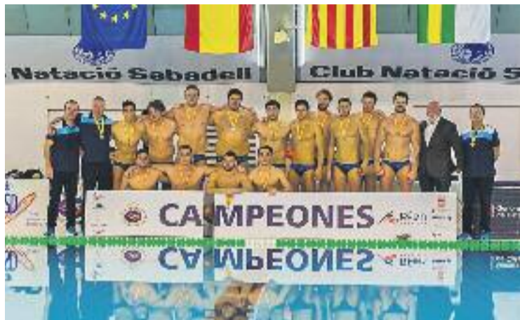
L'equip va lluitar fins al final però no va poder guanyar.

Després del descans va començar un intercanvi frenètic de