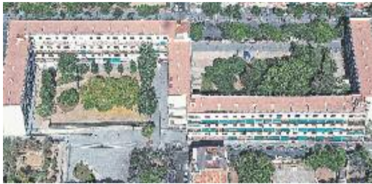
La Casa Bloc acollirà aviat els primers refugiats.

Fonts del departament de Treball, Afers Socials i Famílies de la Generalitat han afirmat a Línia Sant Andreu que durant el que queda de setmana no hi haurà novetats, però que "de cara a la setmana que ve és molt probable que els primers refugiats comencin a arribar a la Casa Bloc". Això serà possible després que les obres que van començar el passat novembre acabessin a finals de febrer. El pri-