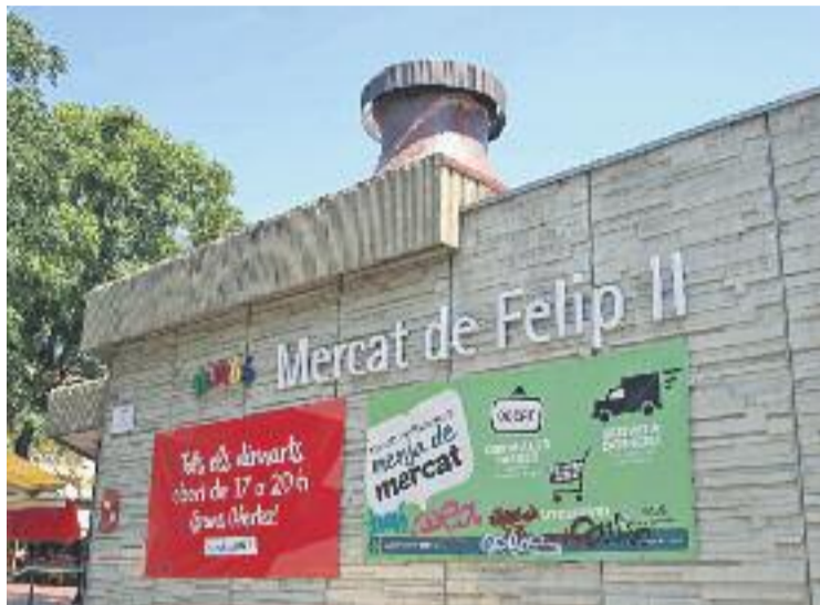
Una imatge d'arxiu del mercat.

Aquesta, però, només és la primera d'un conjunt d'activitats que s'impulsaran des del mercat per celebrar aquesta efemèride. Divendres de la setmana que ve a les 5 de la tarda hi haurà una jornada d'animació infantil. A més, durant el matí del dia 23 d'abril, els paradistes s'afegiran a la celebració de Sant Jordi regalant una rosa per cada compra. Les activitats continuaran el mes de maig. El dia 6 hi haurà un dels plats forts de l'a-