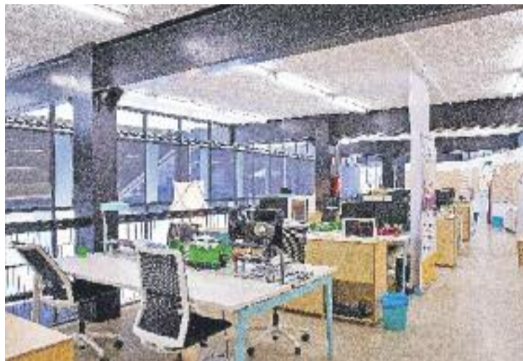
Una imatge de l'interior del nou Canòdrom.

Així doncs, a partir d'ara l'antic Canòdrom de la Meridiana, batejat com a Parc de Recerca Creativa, és un espai al servei dels emprenedors culturals i té com a objectiu convertir idees creatives, en àmbits com el de la cultura digital, en projectes d'emprenedoria. A l'espai, que té 1.300 metres quadrats destinats a espais de treball, sales de reunions, una sala polivalent i diferents zones pel treball en equip i 1.000 metres quadrats de terrassa, també s'hi portaran a terme programes de formació ocupacional, de suport a la creació d'empreses i d'alfabetització digital.