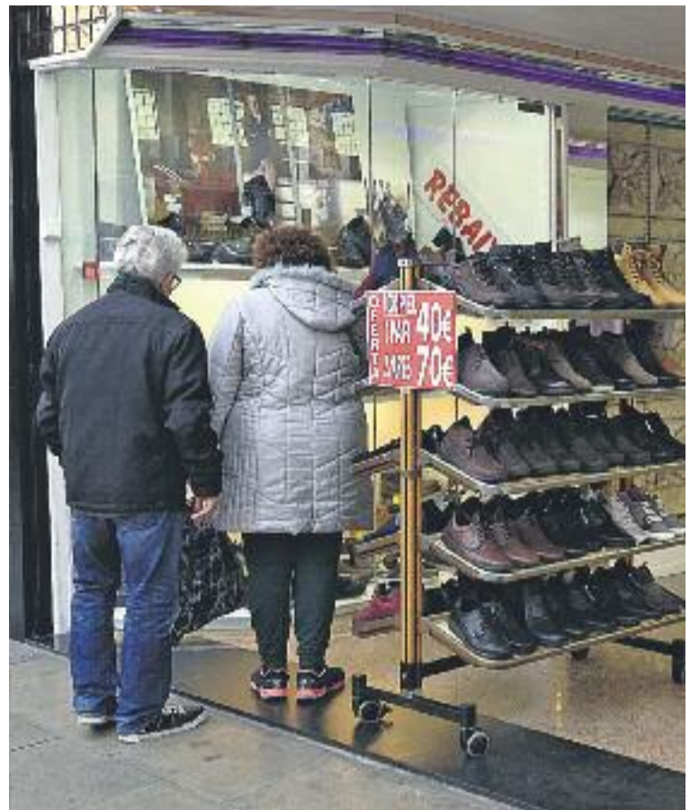
Els descomptes de la campanya de rebaixes han oscil·lat entre el 30 i el 70%.