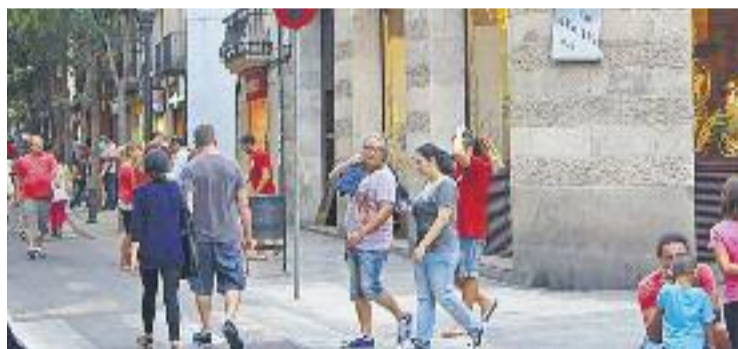
El consistori vol eliminar els diumenges d'obertura a l'estiu.

PROPOSTA ▶ Mig pas enrere de l'Ajuntament respecte dels horaris comercials. Si a principis de mes presentava una proposta que contemplava l'eliminació dels 10 diumenges d'obertura a l'estiu i la creació de quatre de nous al maig i a l'octubre –una proposta que va ser rebuda amb divisió entre els botiguers i bel·ligerància entre els partits de l'oposició–, ara el govern local ha plantejat que aquests dies festius d'obertura s'ampliïn a cinc.