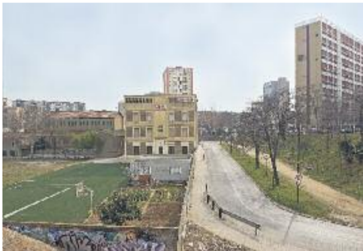
El Besòs, una de les zones fotografiades.

Anna Oswald Cruz viu a Barcelona des del 1986. Després d'haver fotografiat molts espais del centre de la ciutat, des del 2009 ha desplaçat la seva mirada cap a la perifèria.