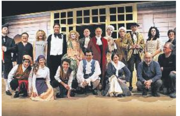
Foto de família del grup teatral Sant Pacià Teatre.

L'Avar de Molière és una comèdia clàssica en cinc actes del dramaturg francès Jean-Baptiste Poquelin, conegut com a Molière, que no ha perdut força amb el pas del temps. L'espectacle se centra en la figura de Harpagon, un home molt ric dominat per una avarícia extrema i que està disposat a fer el que calgui per casa els seus dos joves fills.