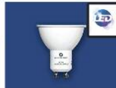
DICROICA LED SM-Potencia 4w Lúmenes 340-Voltage 220V Ángulo 120°-Base GU10-G5.3 Color 4000k Vida Útil 30.000h Ledesma