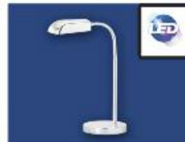
Flexo de LED Potencia 5W, Lúmenes 360, 220V, Ángulo 80, Color 3000k, Vida útil 30.000h