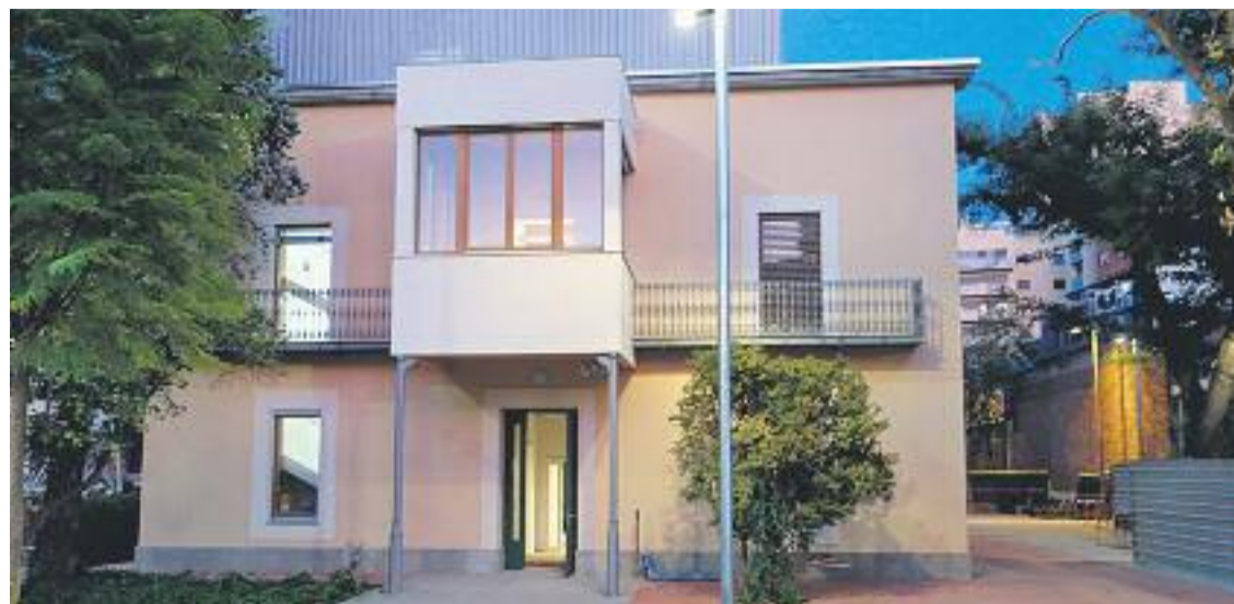
Imatge de Can Portabella un cop acabada la seva transformació. Foto: Ajuntament