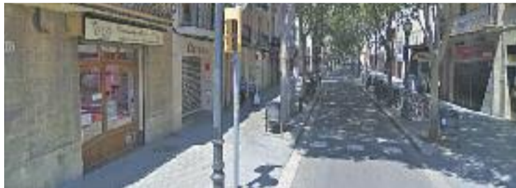
La cansaladeria Puig és una de les botigues protegides.

En total, la nova proposta municipal inclou 211 establiments que seran beneficiaris de pla de protecció de les botigues històri-