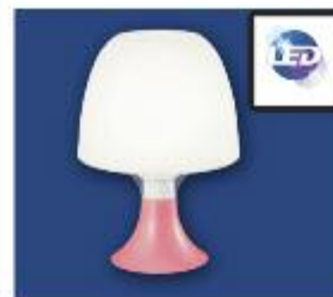
Sobremesa LED potencia 4w. Lúmenes 320, 220v, Ángulo 80 Color 3000k-6500k.