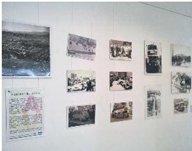
Fotografies històriques del barri.

Així doncs, aquest procés de recuperació de la memòria ha permès que en determinats carrers, places o altres espais del barri es mostrin fets històrics relacionats amb el barri. D'altra banda, el projecte també ha permès la recuperació de fotografies, dibuixos, documents i escrits aportats pels veïns que fan que la memòria històrica del Bon Pastor continuï molt viva.