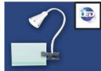
Lámpara de pinza. Led incluida 5w Lúmenes 350. Acabado en plata.