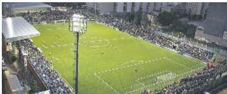
Les obres de reforma del Narcís Sala estan aturades.

Segons Royo, aquest anunci del conseller tècnic col·loca la represa de les obres, com a mínim, per a l'any vinent, una situació que "generarà molèsties als aficionats i al club". De moment, el club ha explicat que seguirà "reivindicant" unes intervencions que considera "urgents", ja que mai en els 46 anys de vida de l'es-