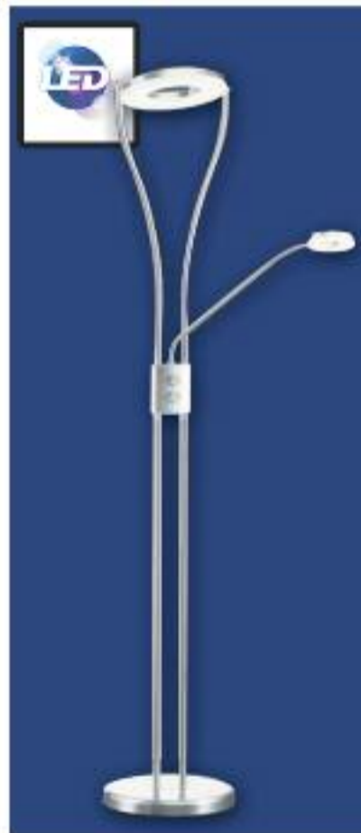
Pie de salón LED Potencia 18w 1200 lúmenes y 5w 450 lúmenes, Regulable, 220v Color Cromo, parte de arriba dirijible.