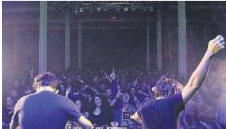
Una imatge de l'edició del Cara-B 2015.

Després de l'exitosa primera edició de l'any passat, el Cara-B d'enguany presenta un programa amb un total de 13 artistes, on també hi haurà Guadalupe Plata, Yung Beef (PXXR GVNG), Extraperlo, The Parrots, Le Parody, El Coleta, Beach Beach, Sen Senra i The Sauris. El festival aposta per un format que proposa una àmplia visió sobre la cultura musical independent i amb la intenció de ser el reflex del seu estat actual tant a Cata-