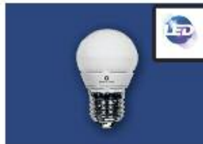
Esferica LED -SMD Potencia 4w Lúmenes 300-voltage 220v Ángulo 270°-Base E-27-E-14. Color: 3000k-y 6500k Vida Útil 30.000h draf.

Al tener una vida larga, los productos LED no necesitan ningún mantenimiento. Esto es especialmente importante en entornos en el que es difícil o complicado cambiar bombillas o llevar a cabo mantenimiento.