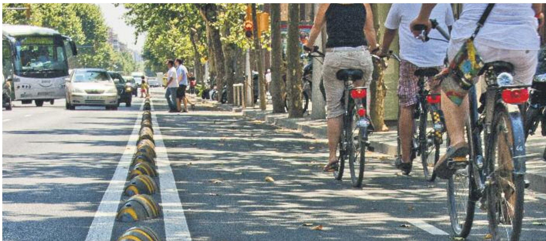
El debat sobre la convivència entre ciclistes i vianants torna a agafar força.