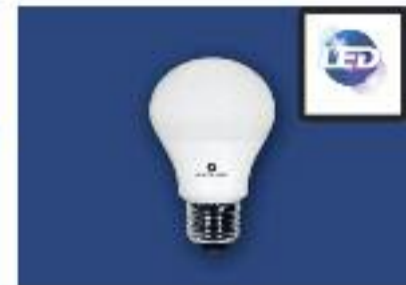
Estandar LED-SMD Potencia 9w Lúmenes 820-Voltage 220v Ángulo 270° -Base E27 Color 3000k y 6500k Vida Útil 40.000h ledmundo