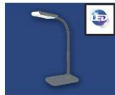
Flexo de LED Potencia 3W, Lúmenes 360, 220V, Ángulo 80, Color 3000k, Vida útil 30.000h