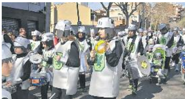
La rua de l'eix ha esdevingut una tradició al barri.

FESTA ▶ L'Eix Sant Andreu està enllestint els últims detalls de la seva dotzena Rua de Carnestoltes, que tindrà lloc el pròxim diumenge dia 7 de gener. La desfilada arrencarà a partir de les 11 del matí a la cruïlla de la rambla de Fabra i Puig amb Concepció Arenal i recorrerà els principals carrers del barri.