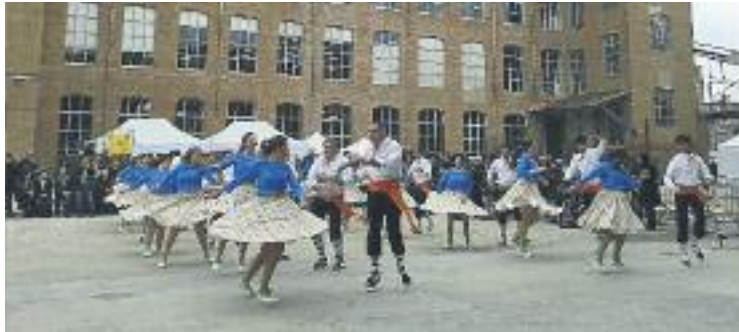
La mostra té la intenció de fer una edició cada dos anys.

Al llarg dels quatre dies un total de 13.000 persones van passar per l'antic recinte industrial andreuenc en una trobada que va reunir 130 associacions i que va permetre al públic gaudir de gairebé 300 actes, que es van dividir entre els dirigits als grups de cultura popular i al món científic i, de l'altra banda, els dirigits al públic en general.