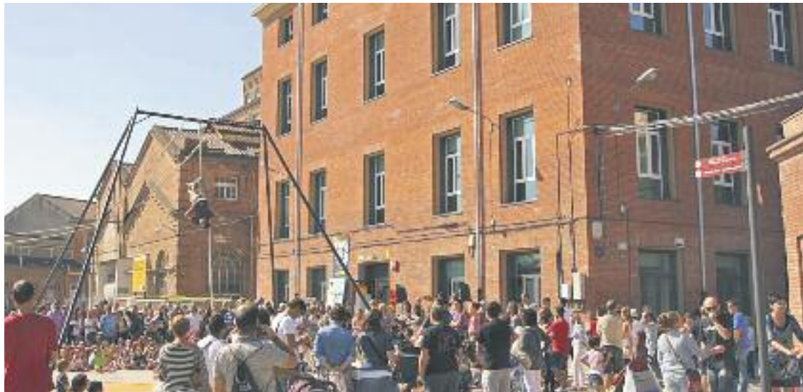
A l'exterior de l'Harmonia sovint s'hi fan activitats.