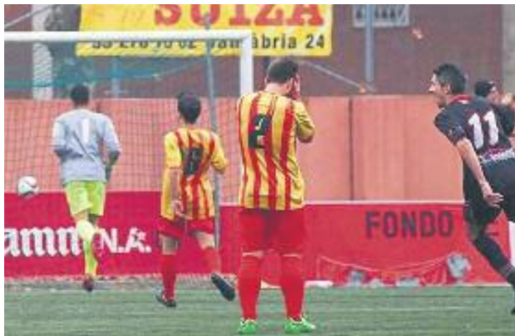
La defensa es lamenta després del primer gol gris-i-grana.

En els primers instants de la represa el Sant Andreu va continuar buscant la porteria dels de la Verneda, mentre que el Júpter re-