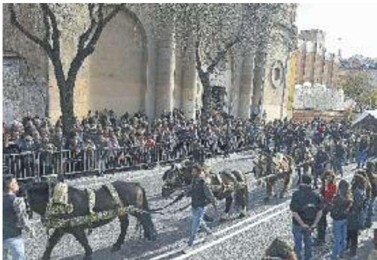
Els animals són els grans protagonistes dels Tres Tombs.