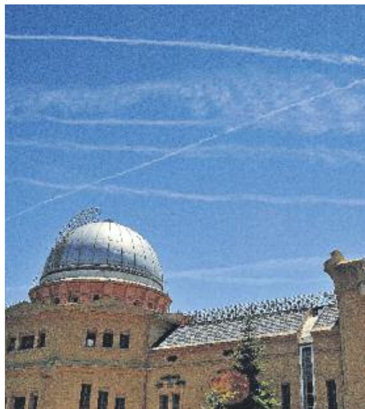
A causa de la poca pluja els episodis d'alta contaminació han estat més freqüents (esquerra). L'Observatori Fabra recull les dades meteorològiques (dreta).