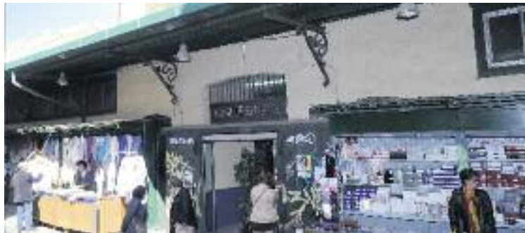
L'edifici del mercat data de l'any 1914.