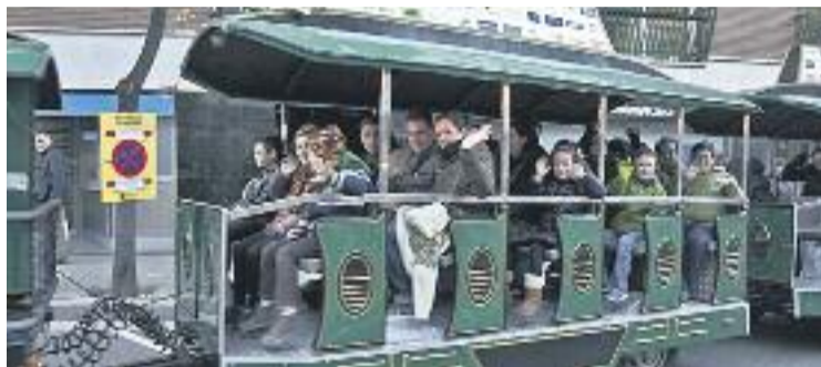
El trenet segueix sent un dels grans atractius.

Aquesta campanya coincideix amb una altra que estan posant en marxa algunes botigues de l'eix on el Tió n'és el protagonista: els aliments que els clients portin al personatge aniran a parar al Banc d'Aliments. Per la seva banda, el dia 28 de desem-