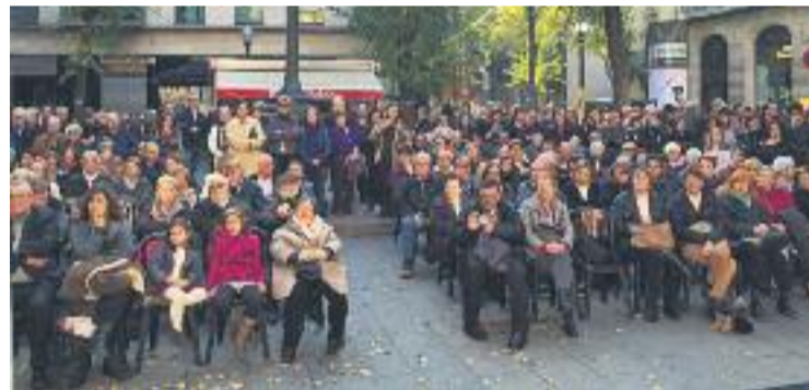
Imatge del públic durant l'entrega dels premis.