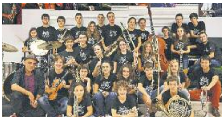
La banda és una de les més joves de tot el continent.

De fet, va ser justament diumenge quan van acabar d'enregistrar el nou disc, on ha participat el famós músic Luigi Grasso. "Aquest serà un treball increïble i especial", s'enorgulleix Chamorro, que indica que l'àlbum oferirà no només música, sinó també fotografies i la història de la banda.