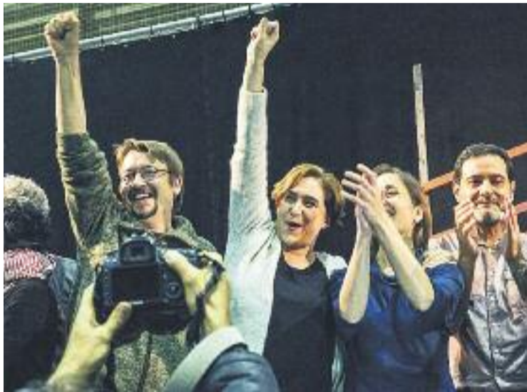
En Comú Podem va celebrar amb eufòria la victòria.

Qui va estar a punt d'ocupar aquesta segona posició va ser ERC. Els republicans es van quedar a pocs vots de superar els socialistes després d'aconseguir 12.380 sufragis i un 15,32% de suport. La candidatura republicana, encapçalada per Gabriel Rufián, va superar amb escreix els resultats del 2011. Mentre que fa quatre anys només va obtenir el 6,93% dels vots