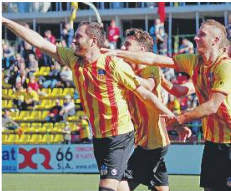
L'equip va sumar la setena victòria de la temporada.