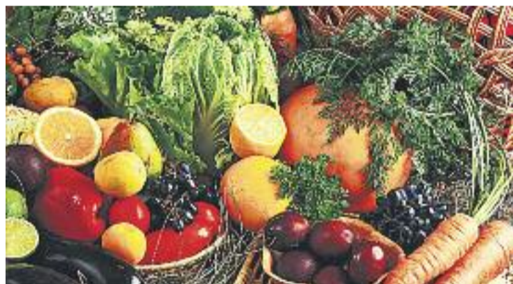
Els productes de proximitat, protagonistes del mercat.