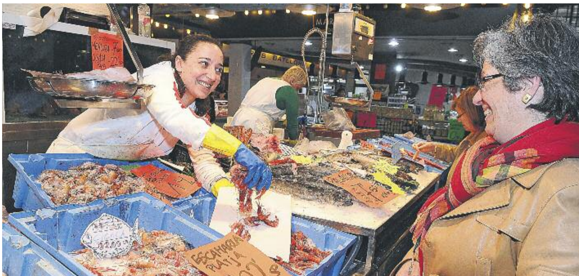
Els botiguers tenen a tocar el canvi de tendència amb el gran inici de campanya que han viscut.