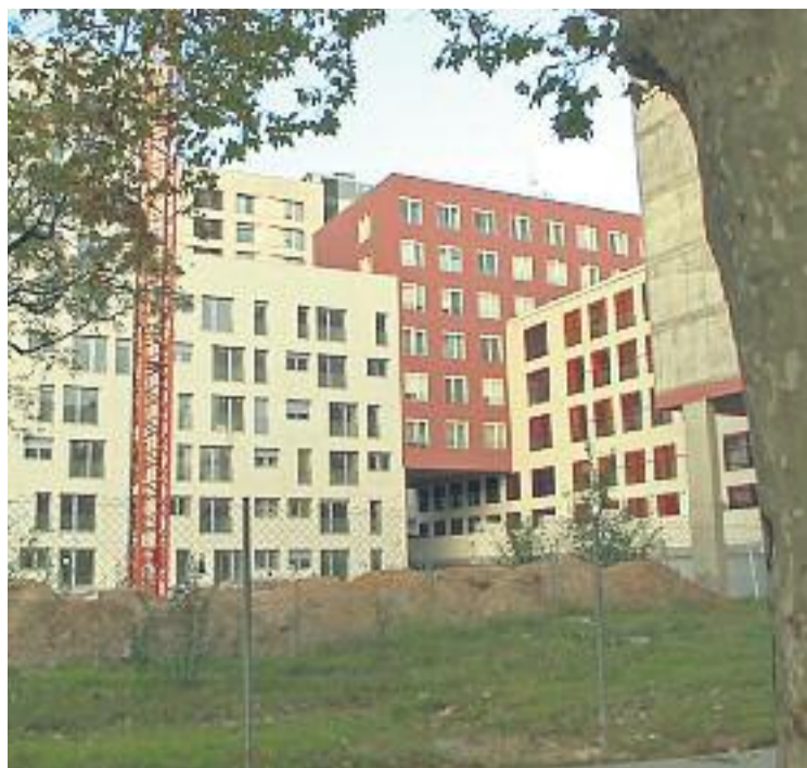
La zona de les antigues Casernes fa temps que espera la reforma.