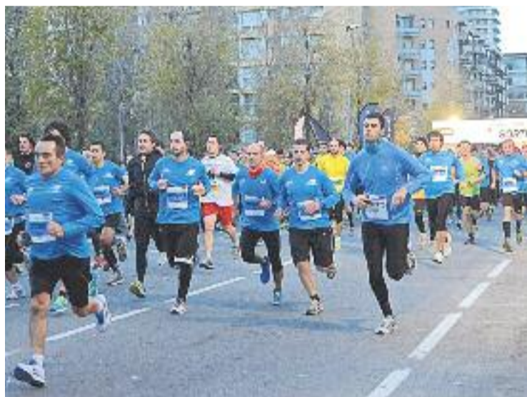
Una imatge de l'edició de 2012 de la Cursa dels Nassos.

Com ja és habitual, el dia 2 de desembre es va organitzar un macro entrenament a la pista d'atletisme Pau Negre, a la muntanya de Montjuïc, on els participants van poder començar a familiaritzar-se amb aquesta distància. El Club d'Atletisme La Sansi, un dels organitzadors de la cursa, va encarregar-se d'aquesta sessió preparatòria.