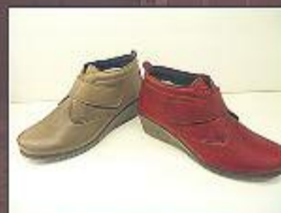
Botins velcro pell 49,95 €