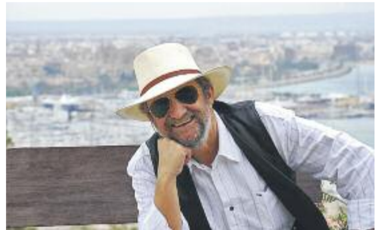
Tomeu Penya, en una imatge d'arxiu.