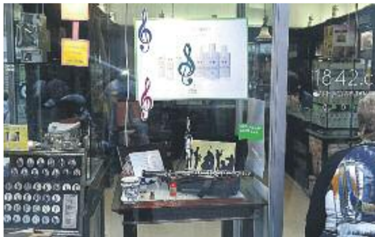
Un dels aparadors participants en el concurs.

Per haver participat en aquest certamen especial es podrà entrar en un sorteig d'una samarreta oficial del festival de música.