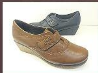
Sabates velcro pell 49,95 €