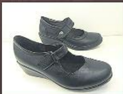
Mercedes pell 45 €