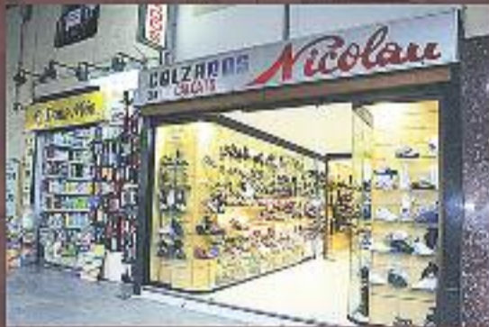
Plaça Mercadal, 30 Telf. 933 465 311

Sabates fabricades a Elx, Arnedo i Toledo. Comoditat, qualitat i preu. Tot en pell.