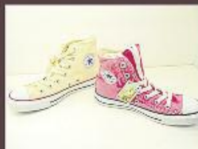
Converse Oferta 44,95 €

VAL per 10% de dte. excepte en ofertes vàlids fins el 20 d'octubre 2015