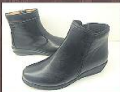
Botins pell 49,95 €