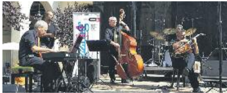
Imatge d'un dels concerts de l'edició de l'any passat.