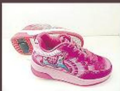
Esportius amb rodes 34,95 €