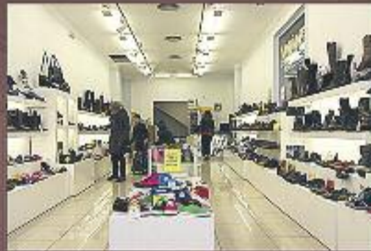
C/ Gran de Sant Andreu, 199 Telf. 933 465 019