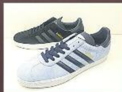
Adidas Gazelle de 85 a 42,50 €