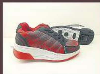
Esportius amb rodes 34,95 €