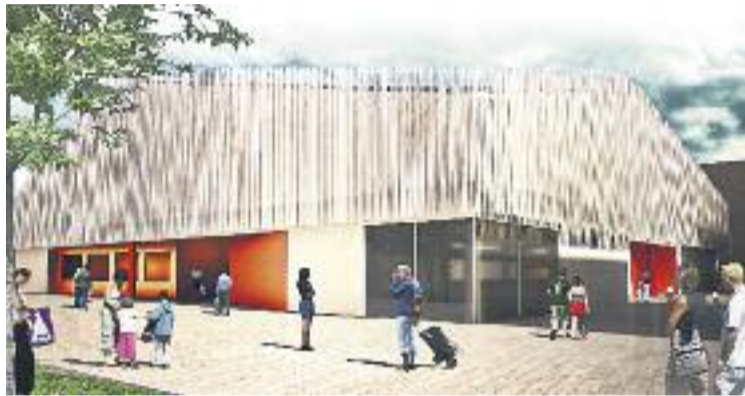
Una imatge virtual del futur mercat del Bon Pastor.

Llavors els paradistes es van instal·lar en una carpa provisional del mateix carrer Sant Adrià on hi havia el mercat vell amb la promesa que s'hi haurien d'estar cinc anys però ja n'hi porten sis. Una ubicació, que segons els paradistes està molt a l'extrem del barri, i que ha provat que les vendes hagin decaïgut en els últims anys. Durant aquest temps han tancat tres de les 16 parades que es van haver de traslladar i d'altres han canviat de propie-