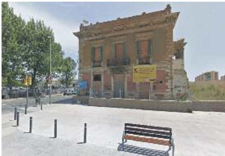
La reforma de la Torre de la Sagrera acaba de començar.