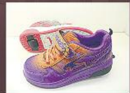
Esportius amb rodes 34,95 €