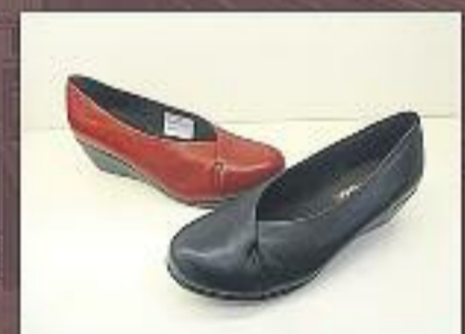
Salons pell 45 €