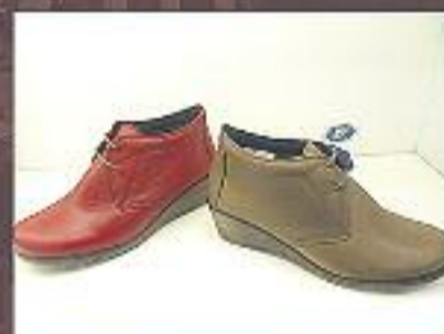
Botins pell 49,95 €