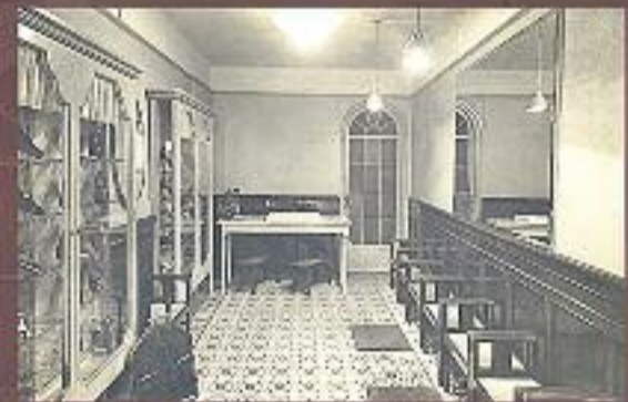
C/ Hospital, 65 Telf. 933 013 880