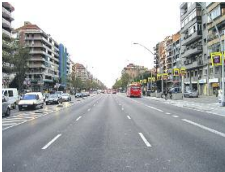
La Meridiana és un dels eixos viaris d'entrada a la ciutat.

Les associacions, un total de 10, van fer públic un comunicat el dia 7 de setembre per "posar de relleu la problemàtica que suposa l'avinguda Meridiana per als nostres barris". Aquests veïns structuren les seves demandes en quatre punts principals que apunten les "deficiències" que ells denuncien. Consideren que "la Meridiana ha de deixar de ser una autopista" i aposten perquè es "prioritzi el transport públic i la bicicleta", ja que ara mateix l'avinguda és un "espai deshumanitzat. Tot això provoca, segons aquestes associacions veïnals, que ara mateix la Meridiana sigui "un mur innecessari, no només metafòricament parlant, sinó un mur físic