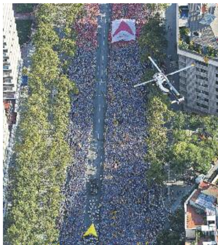
L'avinguda Meridiana va presentar un aspecte immillorable al llarg de tota la Via Lliure.