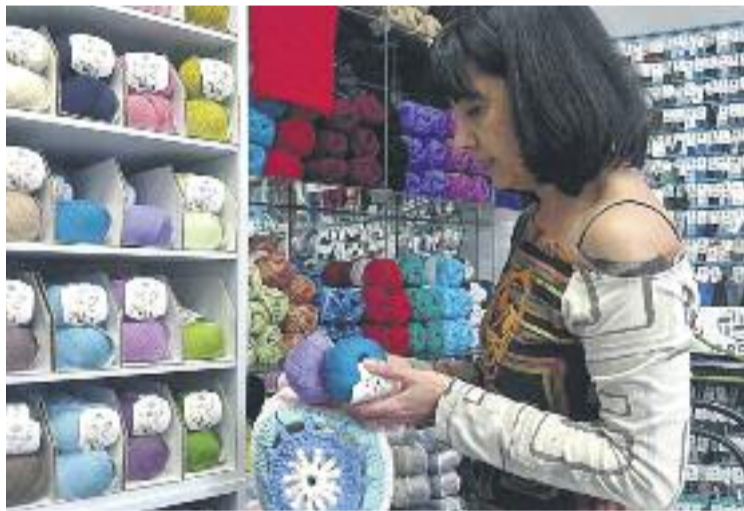
L'Obert al Futur és un programa gratuït.