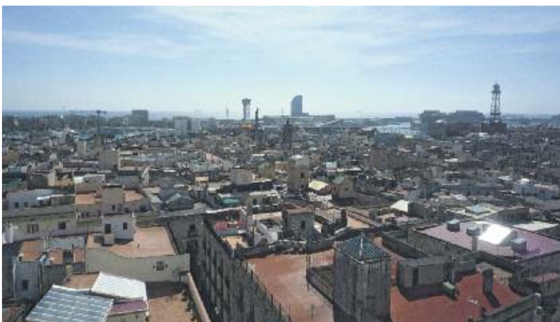
Després dels bons resultats de l'edició de 2014, l'Ajuntament ha tornat a impulsar la campanya de rehabilitació.