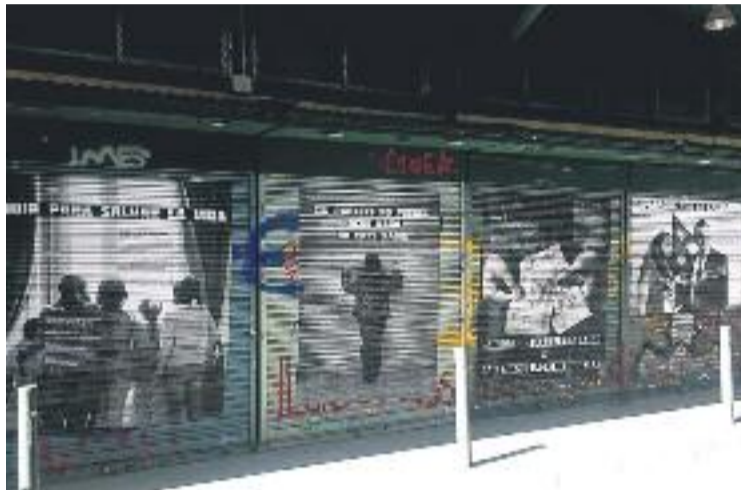
Alguna de les persianes del mercat.

Al mercat hi ha prop d'una desena d'obres que volen servir per generar un debat a la socie-