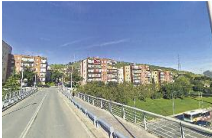
Les obres del Pont de Sarajevo acabaran el 20 d'agost.

D'altra banda, ahir també van començar els treballs de substitució dels elements metàl·lics que, segons el consisto-