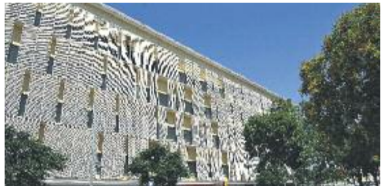
El CAP és un dels equipaments acabats.

PROTESTA ▶ L'Associació de Veïns de Sant Andreu de Palomar va tornar a denunciar el passat mes de juny el retard "de nou anys" de la construcció d'equipaments als terrenys que ocupaven les antigues casernes del barri.