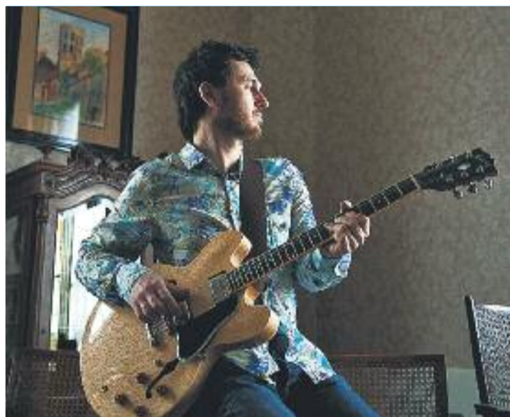
Sanjosex serà el primer protagonista de l'EnciSAT!.

El 2016 l'EnciSAT! arrencarà amb el tradicional concert de Reis i al febrer serà el torn d'An-