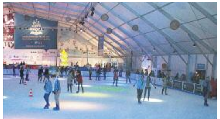
Bargelona és una iniciativa de la Fundació BCN Comerç.

POLÈMICA ▶ La pista de gel de Nadal de plaça Catalunya ja és història, almenys tal com s'ha conegut fins ara. L'alcaldesa, Ada Colau, va anunciar en una entrevista a Btv que Bargelona no tornarà a instal·lar-se en aquella ubicació, ja que serà substituïda per altres activitats "atractives per a les famílies", que en el fons "és el que volen els comerciants".