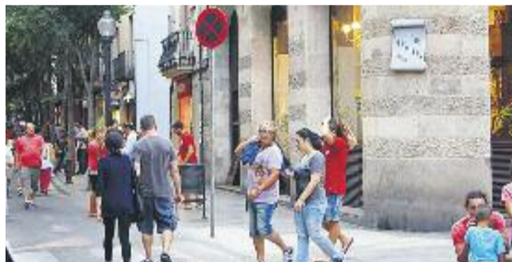
Els municipis han d'escollir dos dies addicionals més als decretats.

HORARIS ▶ La Generalitat va aprovar a principis de setmana el calendari comercial d'obertura en diumenges i festius per als anys 2016 i 2017. El calendari establert proposa vuit dies festius durant els quals podran obrir les botigues. El nou calendari posa èmfasi en les festes locals per tal de prioritzar el consum intern.