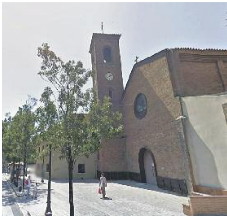
L'església del Bon Pastor es va projectar el 1944.