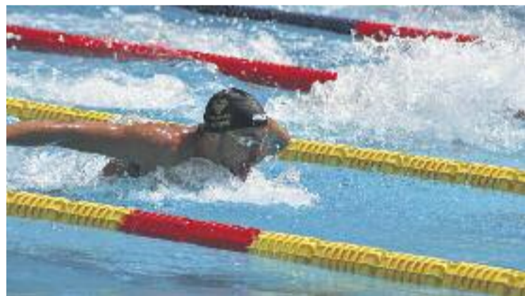
La prova ha arribat enguany a la 36a edició.

NATACIÓ ▶ Més de 560 nedadors i nedadores d'un centenar de clubs d'arreu del món es van donar cita ahir i abans-d'ahir a la Piscina Pere Serrat en el 36è Trofeu Internacional Ciutat de Barcelona, la segona etapa del Circuit Mare Nostrum 2015.