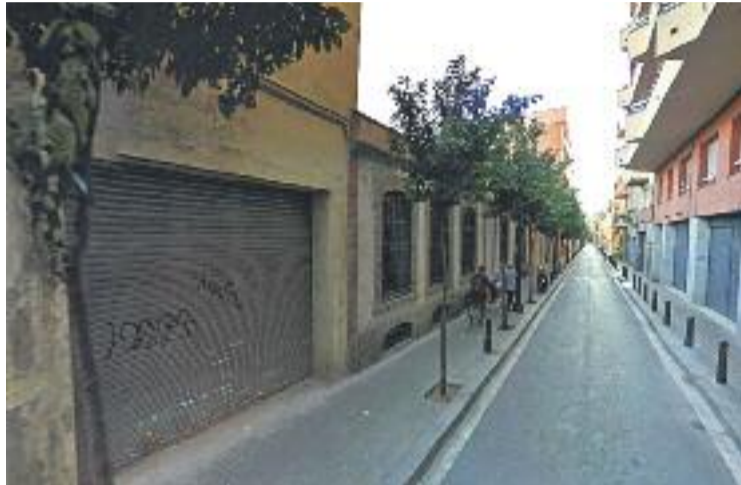
El refugi està situat al carrer Ramon Batlle.