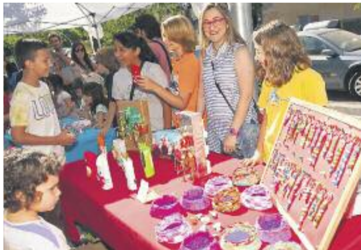
Els escolars van vendre articles fets per ells.