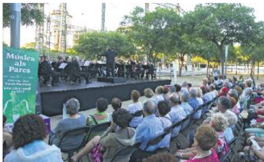
Diverses imatges de l'edició de l'any passat.