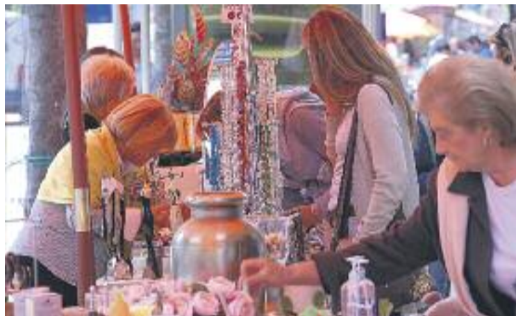
El comerç sortirà al carrer demà durant tot el dia.

"Aquesta és una bona oportunitat per donar-se a conèixer i que la gent passegi pel barri per-