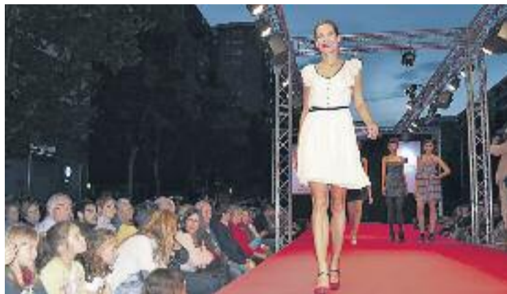
La passarel·la també oferirà alguna actuació.

El segment de comerç barceloní dedicat a la moda i els complements representa gairebé el 40% dels negocis. Per tant, esdeveniments com aquest ajuden perquè "la botiga rebi un retorn comercial molt bo", segons asseguruen des de l'Eix Sant Andreu, ja que la gent "va l'endemà de la desfilada a la botiga a comprar la peça que li ha agradat", afegeixen.