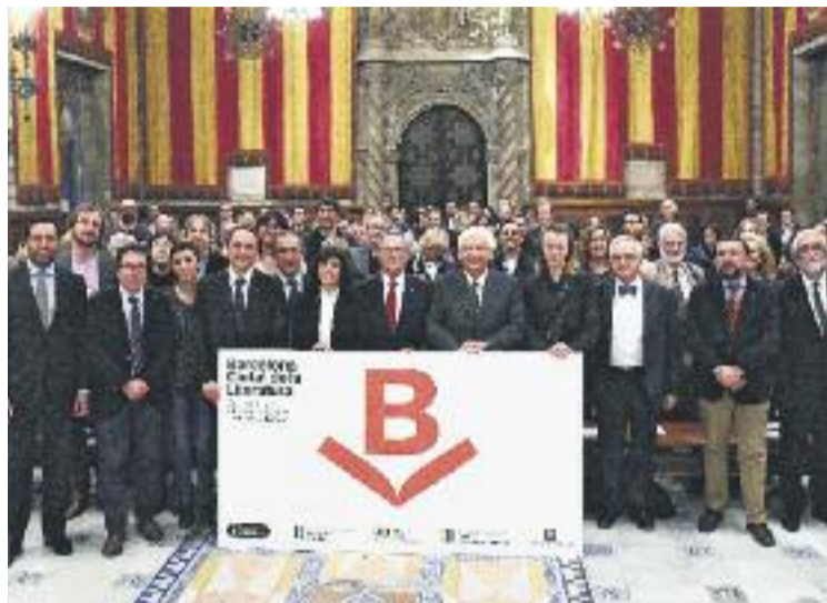
Foto de família dels assistents a l'acte de presentació.

L'Assemblea Nacional Catalana (ANC) ha anunciat recentment que la mobilització independentista de la pròxima Diada tindrà com a objectiu omplir la Meridiana. Aquesta avinguda creua els districtes de Nou Barris, Sant Andreu i Sant Martí. Segons explica la presidenta de l'ANC, Carme Forcadell, la Meridiana simbolitza algunes de les zones on l'entitat no ha aconseguit fer créixer el seu missatge.