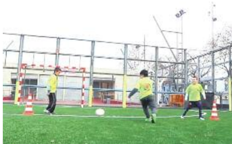
La nova imatge del camp de Baró de Viver.