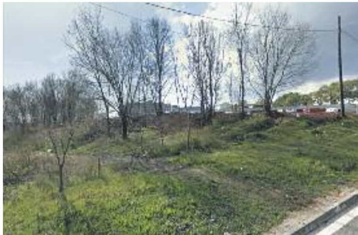
Actualment el solar està ple de vegetació.

El projecte, que està previst que s'acabi entre finals del 2016 i principis del 2017, permetrà que aquest indret, que és l'únic de tota la ciutat on hi ha restes del rec i l'aqüeducte i també del Molí de Sant Andreu, quedi protegit i es blindi el seu patrimoni. Aquesta troballa va tenir lloc l'any 2004, després d'una tasca de reivindicació de l'espai del Centre d'Estudis Ignasi