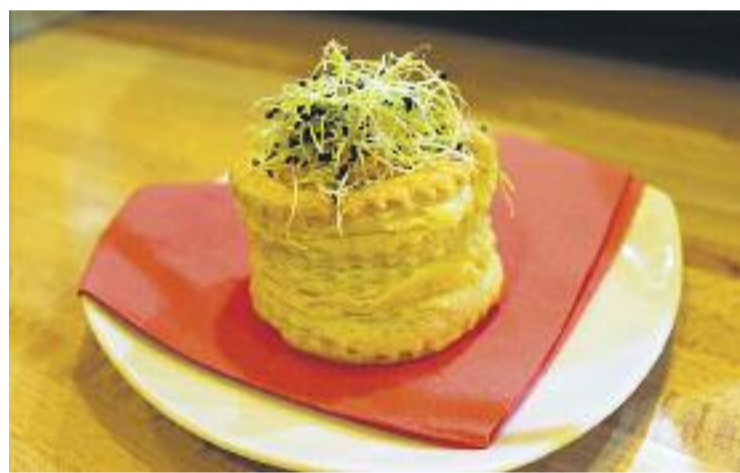
La primera edició de la ruta ha deixat bones sensacions.

Com a novetat de la nova edició, l'horari de la ruta s'ampliarà una hora més. Si en la primera edició l'Atrapa la Tapa tenia lloc els dijous de 7 a 10 del vespre, ara serà a les 11 quan finalitzi la promoció, que ofereix una tapa i una beguda per 1,95 euros.