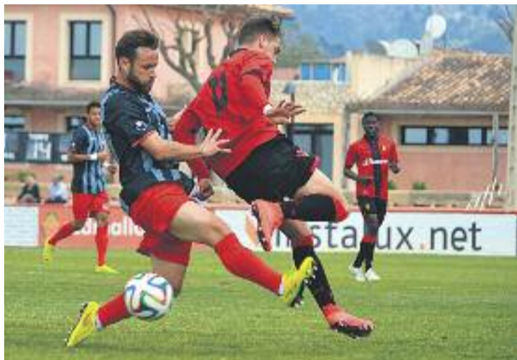
Els quadribarrats no van poder puntuar a Mallorca.