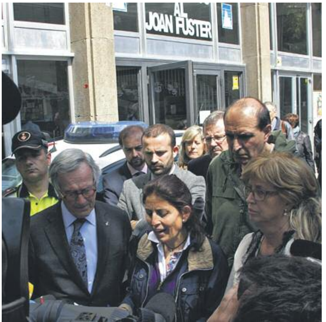
Imatges de diversos moments viscuts a les portes de l'institut Joan Fuster després de la tragèdia.