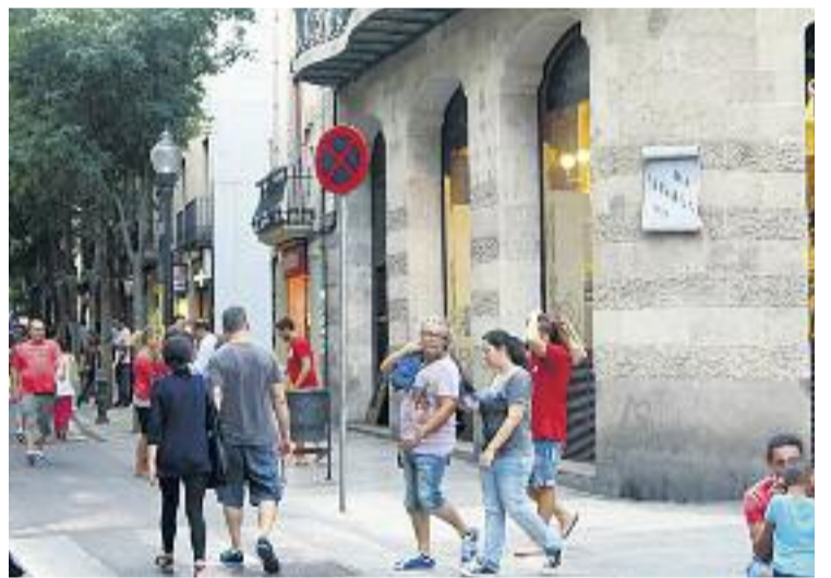
El carrer Gran de Sant Andreu és l'eix vertebrador del barri.

Segons el tinent d'alcalde d'Hàbitat Urbà, Antoni Vives, amb aquest pla "es protegeix i preserva la identitat del nucli antic de Sant Andreu".