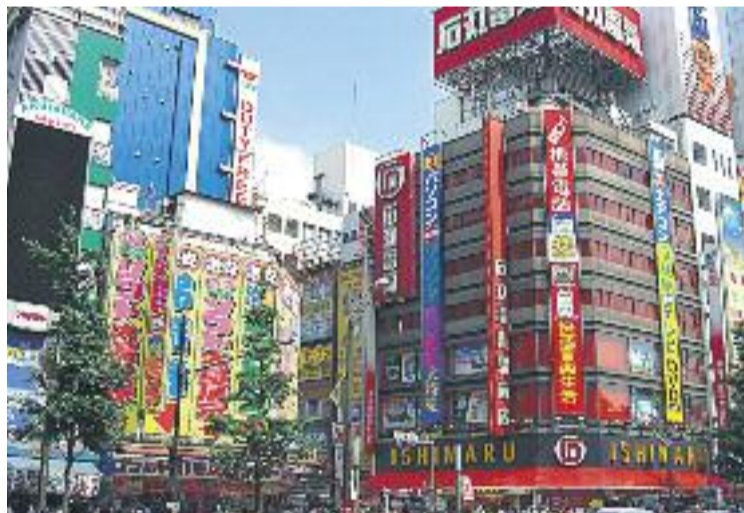
El viatge a Tòquio tindrà lloc del 9 al 16 de maig.