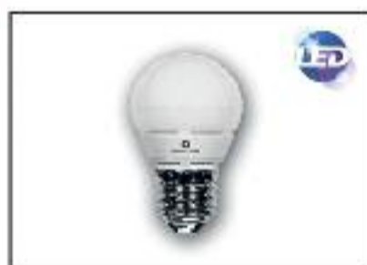
Esferica LED -SMD Potencia 4w Lúmenes 300-voltage 220v Ángulo 270°-Base E-27-E-14. Color :3000k-y 6600k Vida Util 30.000h draf.

5. Sin mantenimiento: Al tener una vida larga, los productos LED no necesitan ningún mantenimiento. Esto es especialmente importante en entornos en el que es difícil o complicado cambiar bombillas o llevar a cabo mantenimiento.