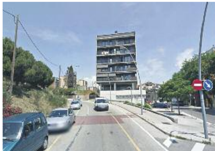
La reforma de la carretera de Ribes s'ha desencallat.

Aquesta reforma, pendent des del moment de la construcció del carril bus VAO, tot i que ja va formar part d'un pla urbanístic específic que el govern de l'exalcalde socialista Jordi Hereu va aprovar l'any 2010.