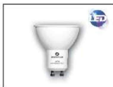
DICROICA LED SMD-Potenola 4w Lúmenes 340-Voltage 220V Ángulo 120°-Base GU10-G5.3 Color 4000k Vida Util 30.000h Ledesma