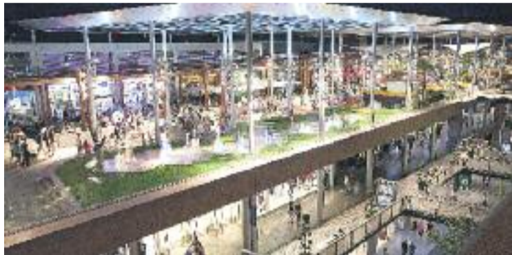
L'ampliació de la Maquinista segueix amb el seu camí.

Algunes de les mesures que vol implementar el pla és la professionalització de la gestió dels eixos comercials, prioritzar la digitalització de les botigues, millorar la seva sostenibilitat i fo-