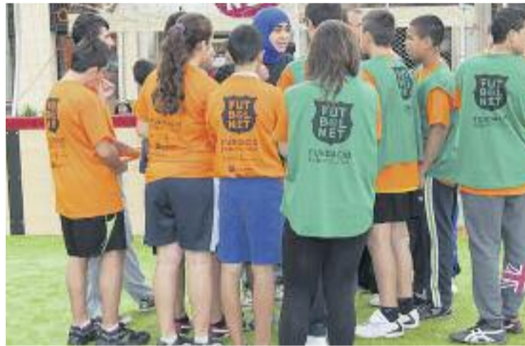
La iniciativa FutbolNet ja compta amb el seu propi llibre.

SOLIDARITAT ▶ Promoure els valors associats a l'esport a través de la pràctica del futbol. Aquest és el principal objectiu de la campanya FutbolNet, que organitza la Fundació FC Barcelona, i que ara fa uns dies va presentar el llibre i l'exposició FutbolNet. Valors a través del futbol , una obra que recull en imatges les històries de nens i nenes de tot el món que han participat en aquest programa.