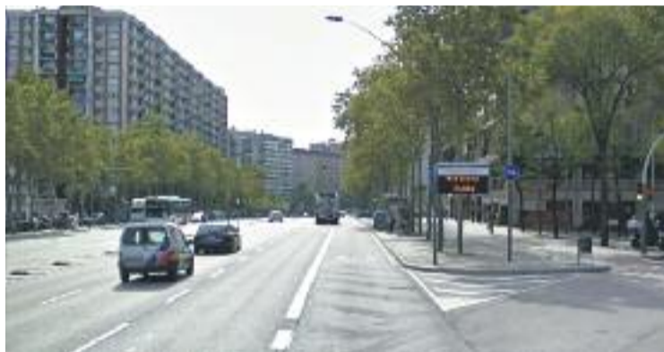
Millorar la Meridiana, una de les reivindicacions.