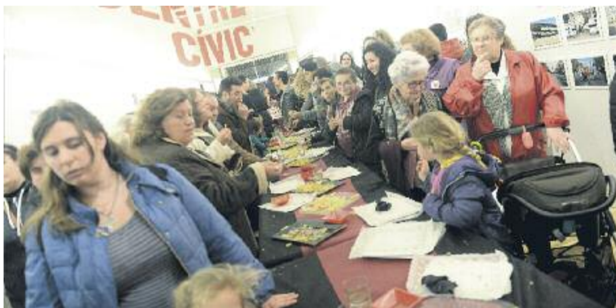
Diferents moments de la inauguració del Centre Cívic i de la plaça.