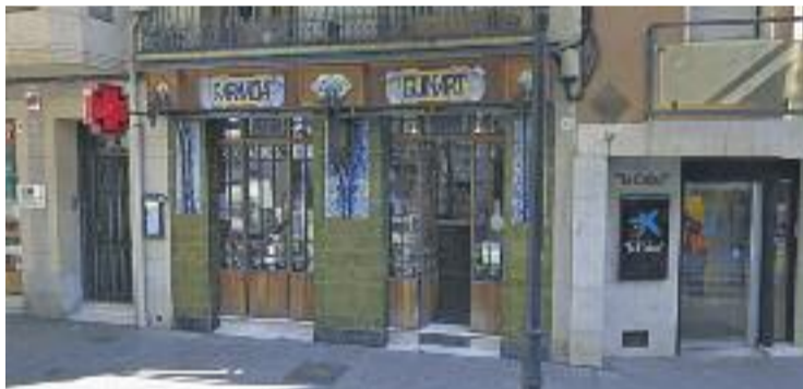
La històrica Farmàcia Guinart, de Sant Andreu.

EMBLEMÀTICS ▶ Finalment, el nou catàleg d'establiments històrics de la ciutat només identifica 228 botigues d'aquestes característiques a la ciutat, de les 389 que va delimitar ara fa un any en un primer catàleg. Per tant, 161 comerços queden descartats i se'ls aixeca la suspensió de llicències decretada aleshores.