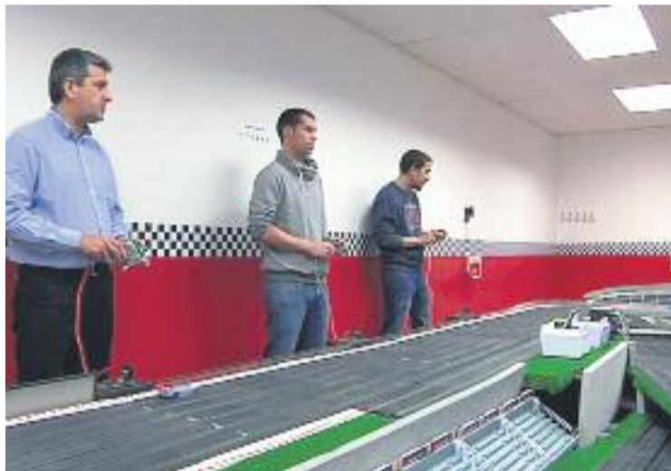
Al circuit hi poden competir 6 cotxes alhora.

A més de fer córrer els cotxes, els membres del Gasclavat adapten els seus cotxes als reglaments de cada categoria. En aquest sentit, acostumen a competir amb cotxes a escala 1:32 i 1:24 i n'arrangen peces del motor, els engranatges i la suspen-