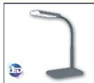
Flexo de LED Potencia 3W, Lúmenes 360, 220V, Ángulo 80, Color 3000k, Vida útil 30.000h