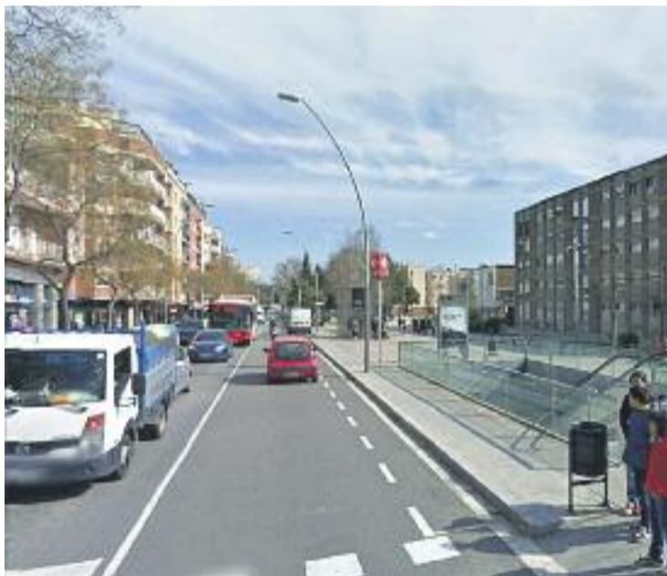
Una imatge del carrer de Sant Adrià, al Bon Pastor.

per a aturats de llarga durada, ja que els agents estan contractats a través de la Fundació Trinijove. Des que els quatre agents cívics van començar a desenvolupar la seva tasca a Trinitat Vella, les seves intervencions han estat relacionades principalment amb l'ús incorrecte de les papereres i els contenidors - com per exemple amb la recollida selectiva-, per donar informació als propietaris dels gossos o per gestionar i comunicar problemes relacionats amb el soroll.