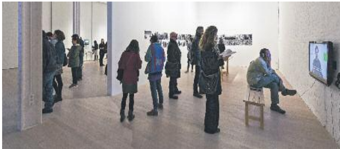
L'exposició 'After Landscape' ja ha acollit un bon nombre de visites.