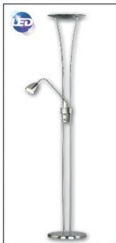
Pie de salón LED Potencia 20w 1200 lúmenes y 6w 460 lúmenes Regulable, 220v Color Niquel Satinado