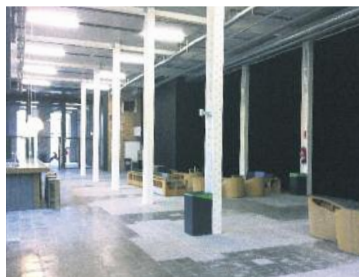
El portal i la senyalització serveixen per reafirmar el creixement de l'antic recinte industrial andreuenc.