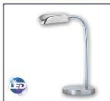
Flexo de LED Potencia 4,2W, Lúmenes 240, 220V, Ángulo 80, Color 3100k, Vida útil 20.000h