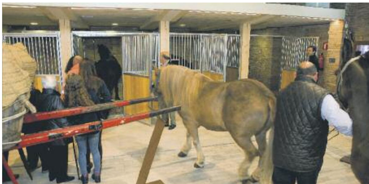
Els veïns van gaudir de la jornada d'inauguració de Can Fontanet.