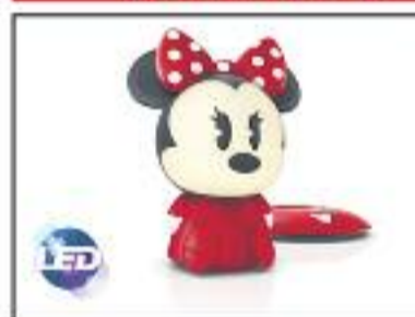
Un pequeño amigo .MINNIE MOUSE PHILIPS LEDS , se carga por inducción en la base , se enciende al inclinarla , varios modelos