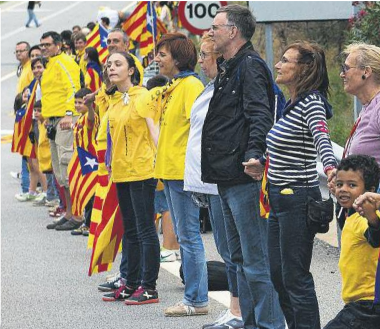
El nou preacord sobre el full de ruta pretén relançar la il·lusió que el procés sobiranista ha despertat en els darrers anys.

4. Culminació democràtica del procés per part del poble de Catalunya.