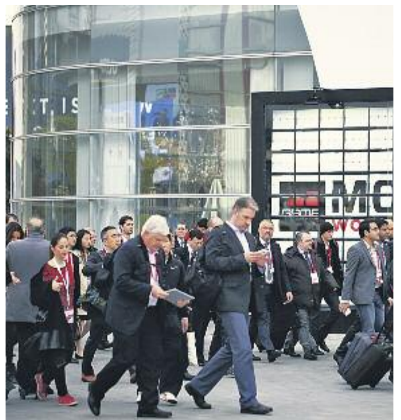
El congrés de cardiologia i el de mòbils són dos dels més importants.