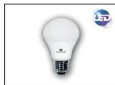
Estandar LED-SMD Potencia 9w Lúmenes 820-Voltage 220v Ángulo 270° -Base E27 Color 3000k y 6600k Vida Util 40.000h ledmundo