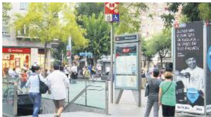
La iniciativa vol dinamitzar l'activitat comercial de la zona.

Aquesta iniciativa compta amb el suport del teixit social i comercial del districte.