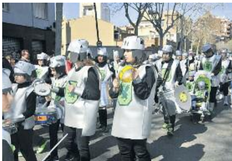
La Rua de Carnestoltes arriba a la seva onzena edició.