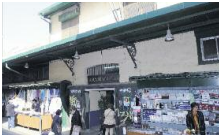
El mercat va ser construït l'any 1914.

L'adjudicatari del contracte és el responsable de la redacció