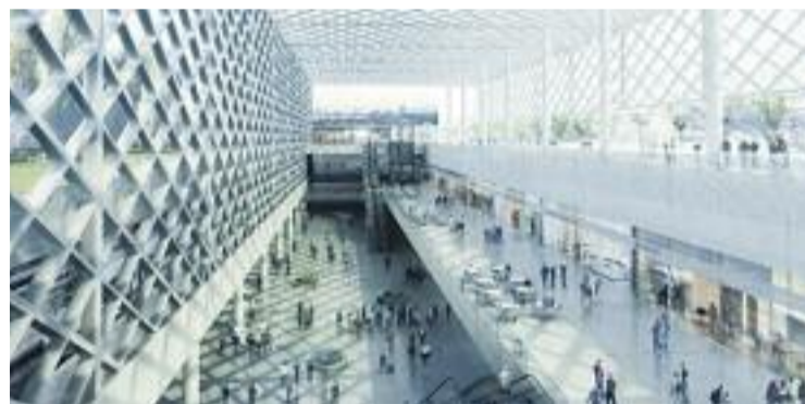
Reproducció virtual de la futura estació.

INFRAESTRUCTURES ▶ El projecte de l'estació de la Sagrera es va desencallant. Recentment, tal com ha avançat La Vanguardia, s'ha conegut que l'estació haurà d'estar a punt a començaments del 2020 i serà més petita, a causa de la nova realitat econòmica, que la prevista en el projecte original.