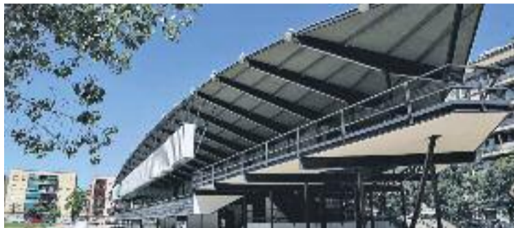
El Canòdrom de la Meridiana va ser construït el 1962.

El regidor de Cultura, Jaume Ciurana, va afirmar durant la presentació del projecte que l'objectiu d'aquest nou equipament serà "connectar el talent creatiu amb el teixit econòmic i empresarial de la ciutat". Amb el projecte per a aquest edifici, que va ser dels darrers canòdroms en funcionament a l'Estat -va tan-