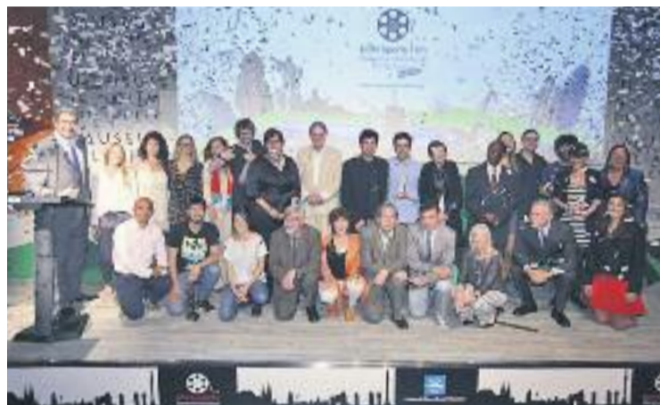
Foto de família dels guardonats de l'any passat.

FESTIVAL ▶ La sisena edició del BCN Sports Film ja comença a caminar. El període per presentar la candidatura per participar en aquest festival de cinema esportiu ja està obert, i seguirà així fins al pròxim 28 de febrer.