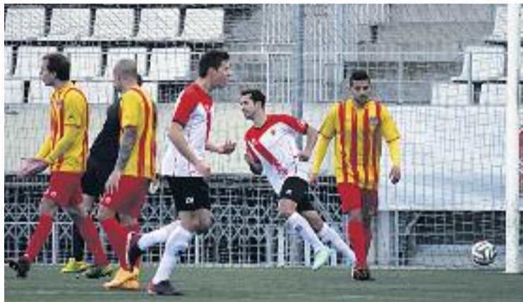
Una bona acció d'Haro va decidir el partit.

Contra l'Hospi, els de García van rebre molt d'hora el primer i únic gol del partit, després d'una bona acció d'Haro a l'àrea andreuenc que va finalitzar amb la pilota a la xarxa de la porteria de Morales. A partir del gol, el Sant Andreu es va desinflar en un