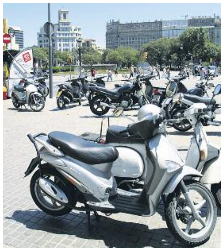
Les motos representen el 30% del parc mòbil de la ciutat i es fan servir en el 34% dels desplaçaments.