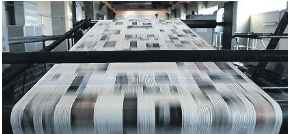
Línia és la capçalera gratuïta local no diària amb més difusió de Catalunya.