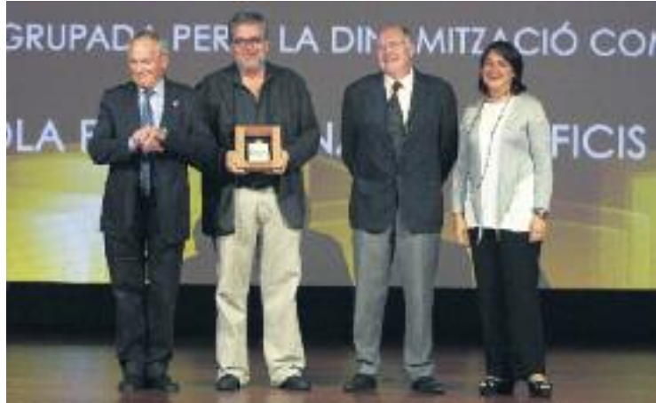
Una imatge de la cerimònia dels premis de l'any passat.

Enguany se celebra la dissetena edició dels guardons amb una novetat com és la creació d'una nova categoria de premis: la de l'àmbit de l'accessibilitat en el comerç. Aquesta modalitat premiarà els comerciants que hagin introduït a les seves botigues serveis o instruments que millorin l'atenció al consumidor amb discapacitat, amb la