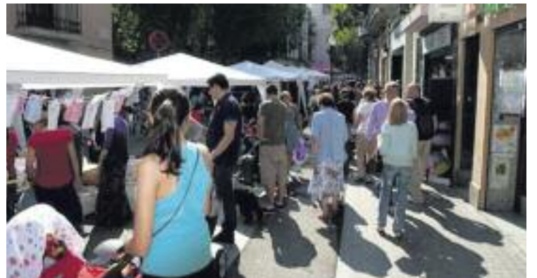
L'associació va celebrar la seva 19a Festa de comerç.

MOSTRA ▶ Per dinovena vegada consecutiva, l'Eix Comercial Sant Andreu va treure les seves botigues al carrer durant la Festa del Comerç al carrer de Sant Andreu. En aquesta ocasió va ser el dia 7 de juny als carrers Gran de Sant Andreu i a la Rambla de Fabra i Puig.