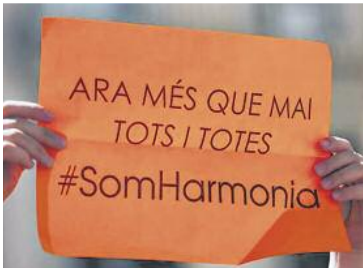
L'Harmonia finalment gestionarà el casal de carri.