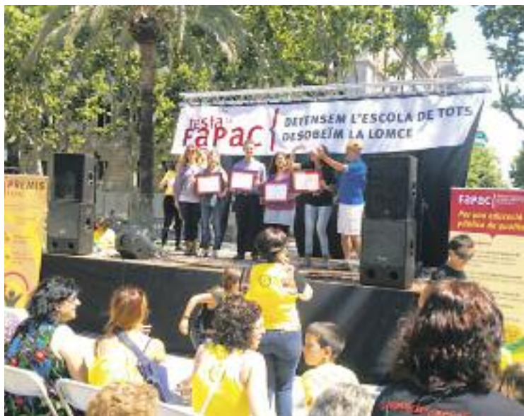
Imatge d'una de les entregues de premis de la jornada.

A banda de la categoria de la qual formava part el premi rebut per la coordinadora d'AMPA de Sant Andreu, que valora la iniciativa promoguda en un centre educatiu o en una AMPA amb l'objectiu de millorar l'èxit educatiu dels seus alumnes, les altres dues categories eren el premi 'Tothom a l'AMPA', a l'experiència que promou la participació associativa, i el premi 'AMPA Solidària', a l'experiència solidària que promou la cohesió.