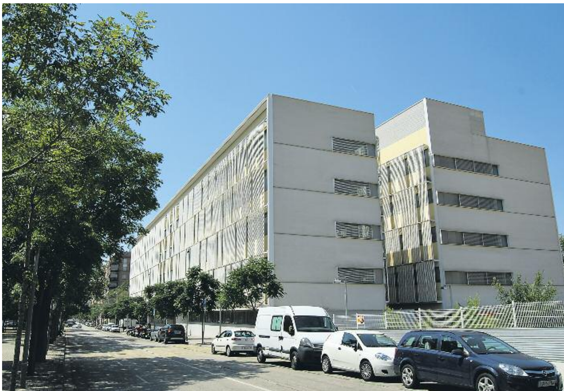
El CAP Casernes ofereix una àmplia varietat de serveis mèdics.