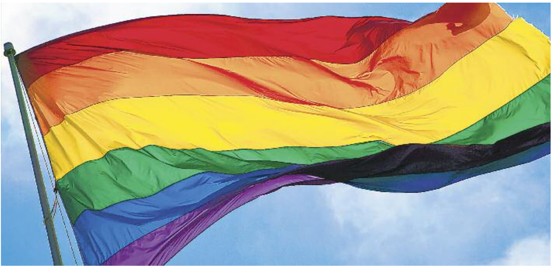
La bandera gai ja no és cosa només d'una zona o barri com abans, sinó que comença a onejar per tota la ciutat.