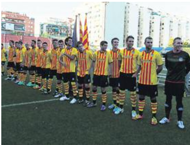
La UE Sant Andreu es presentarà el 30 de juliol.

bran a casa el Gavà, a partir de dos quarts de 8 de la tarda. Per tal de preparar aquests partits, el primer equip tornarà a la feina el pròxim dilluns 14 de juliol per fer el primer entrenament de la pretemporada.