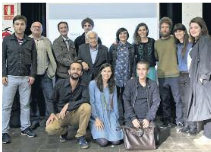
Els premis es van lliurar a la Fabra i Coats.

Herrera va ser el guanyador de la categoria 'Obra' amb Dividir una muntanya ; Canepa es va imposar en la categoria 'Projecte', amb l'obra Arquitecturas del futuro pasado ; Vidal va guanyar en la categoria 'Publicació' amb el treball Numerical algorithms for improving the measurement of Topografia of x-ray mirrors used in synchrotrons i, finalment, Clementi es va quedar en primera posició a la categoria 'Comunicació gràfica'