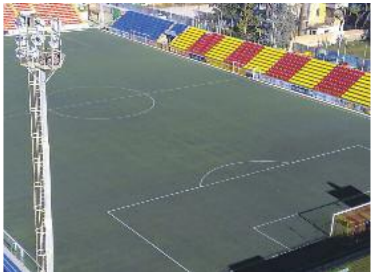
El Narcís Sala mai havia tingut una gran rehabilitació.

Amb la remodelació del projecte del camp de futbol Narcís Sala, les persones amb mobilitat reduïda tindran un nou balcó amb sis places per tal que puguin gaudir dels partits sense cap inconvenient. A més, també s'executarà un nou lavabo adaptat i es construiran rampes noves i recorreguts accessibles per a aquest col·lectiu.