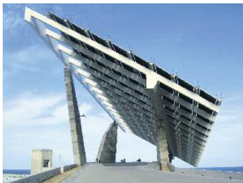
Alguns indrets d'interès de la ciutat: El Laberint d'Horta (esquerra), la nòria del Tibidabo (a dalt) i el parc del Fòrum (a sota).