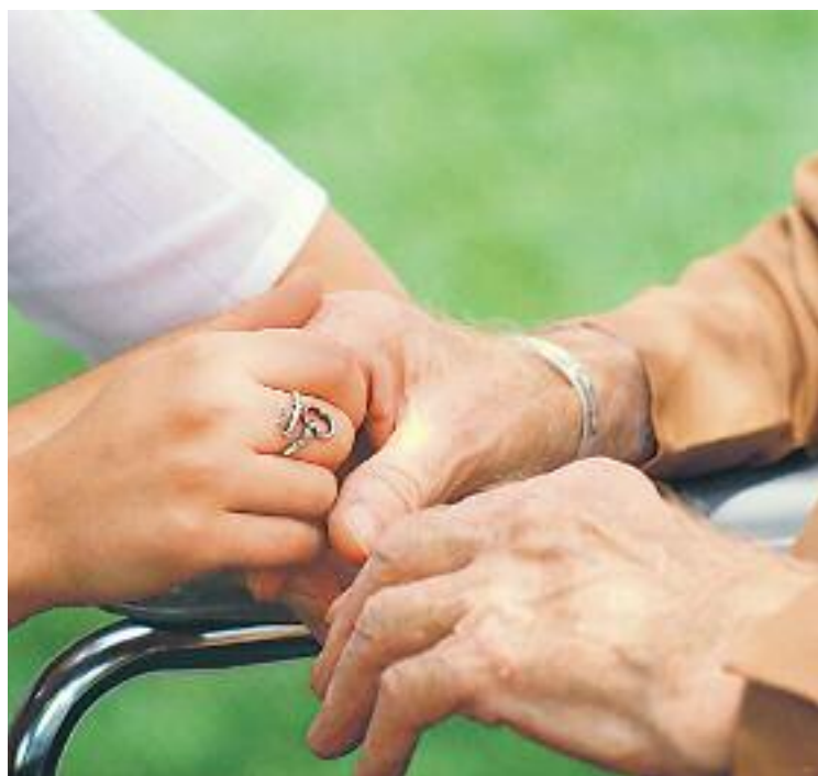
El projecte 'Vincles BCN' vol trencar l'aïllament de la gent gran.