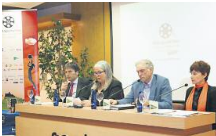
Presentació del cicle de cinema esportiu.

CONCURS ▶ El Museu Olímpic i de l'Esport Joan Antoni Samaranch (MOE) i la Sala Àmbit Cultural d'El Corte Inglés seran les sales de projecció del ja emblemàtic certamen cinematogràfic de temàtica esportiva BCN Sports Film , que tindrà lloc entre el 7 i el 10 de maig.