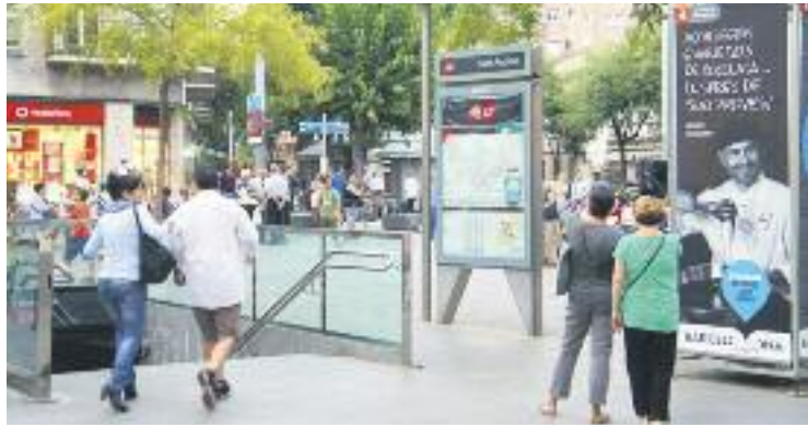
Gairebé la meitat dels comerciants no obriran els festius a l'estiu.

Tot i que les vendes han caigut un 1,4%, els comerciants ja comencen a veure "un punt de llum al final del túnel", segons indica Vicenç Gasca, president de la Fundació Barcelona Comerç. L'optimisme és degut al fet que la caiguda de les vendes no ha estat tan pronunciada com ho va ser durant els primers mesos de 2012 i 2013.