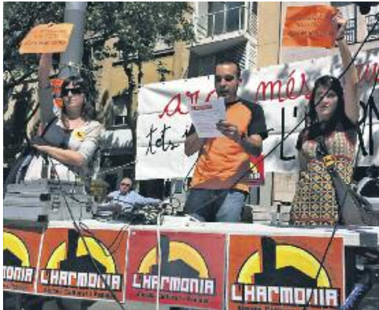
La lectura del manifest de l'Harmonia el passat dissabte.

Des del Districte expliquen que s'ha apostat per una gestió cívica i per això es va obrir un concurs que, finalment, s'ha declarat desert, ja que "cap de les dues propostes arriben a la puntuació mínima, que és el 7, ja que no compleixen molts dels requisits exposats a les bases del concurs". A més, el consistori anuncia que ara inicia "un procés per estudiar quina és la mi-