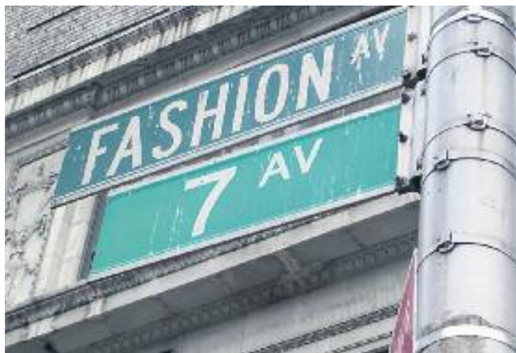
La ruta servirà per donar idees per modernitzar els negocis.