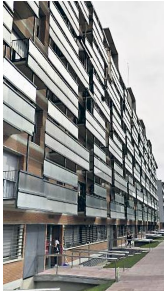
El solar on s'ha començat a construir i una promoció d'habitatges ja acabada.