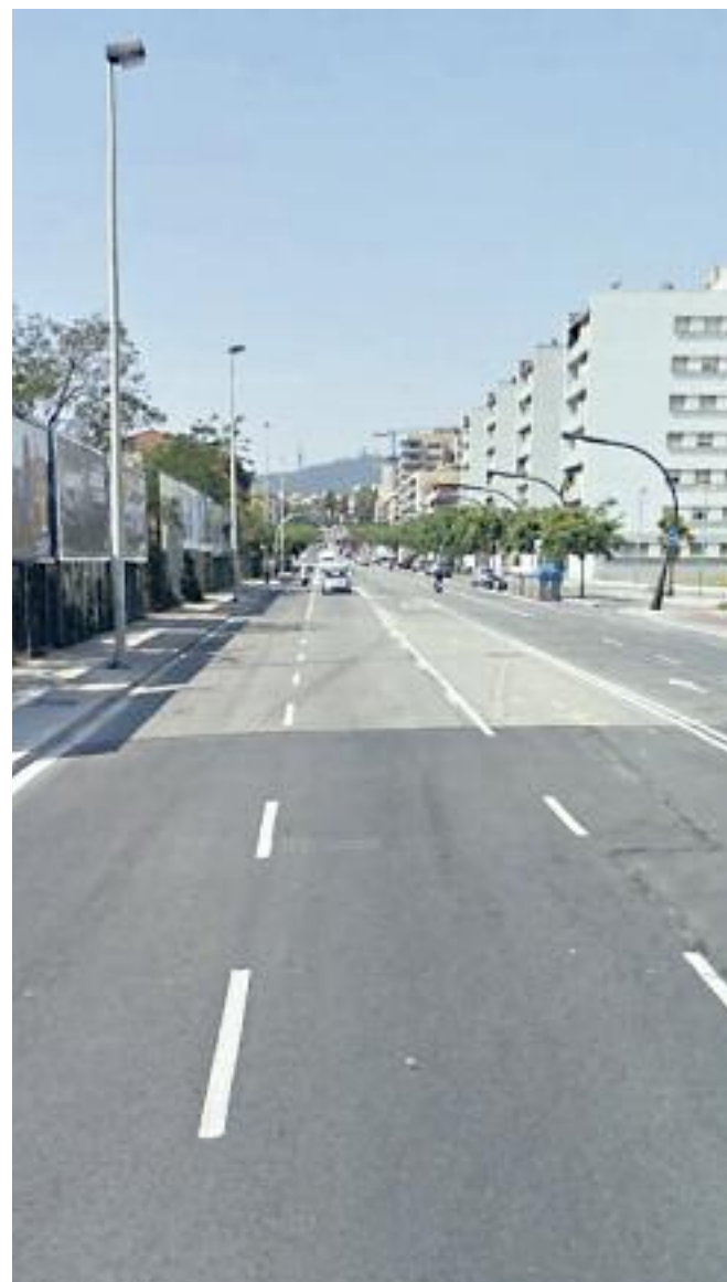
L'Ajuntament sorteja 40 parcel·les per a horts urbans al Passeig Santa Coloma.