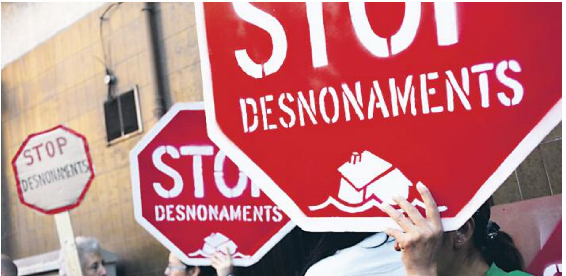
El problema de l'habitatge va en augment.