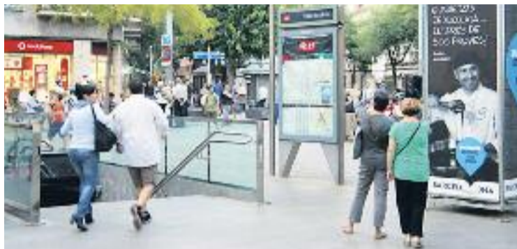
L'acord busca aprofitar el turisme de curta estada a la ciutat.

Aquests dies d'obertura se sumen als 10 marcats per la nova normativa catalana, dels quals l'Ajuntament n'ha triat quatre i els ha adaptat al turisme de congressos i a l'afluència de creue-