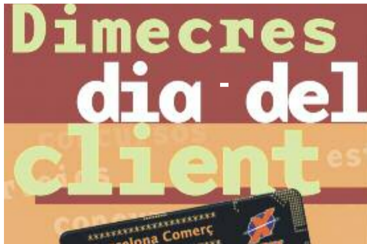
Enguany es regalarà una bossa ecològica.

Com a novetat, enguany es regalarà una bossa ecològica reutilitzable per la primera compra que es realitzi. Per tal d'aconseguir-la, caldrà presentar el tiquet de pagament de la primera compra que s'hagi realitzat amb la targeta Barcelona Comerç a la seu de l'eix comercial, al carrer Mateu Ferran número 4.