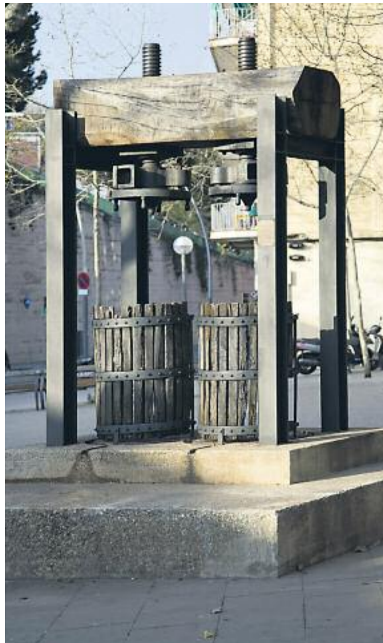
El pilar d'aigua de la Sagrera (a dalt a l'esquerra), una de les plaques de Petit paisatge (a baix a l'esquerra) i la premsa de vi de la Masia de Can Xandri (dreta).