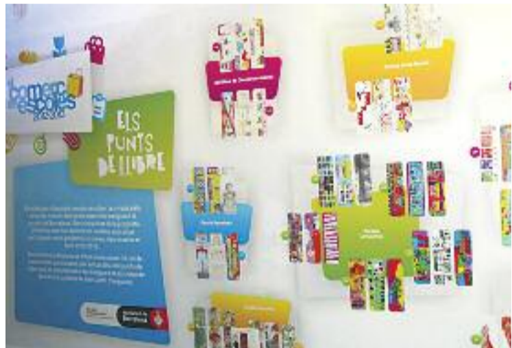
Un cop finalitzat el programa se celebrarà una exposició.

Tot el treball dut a terme durant aquest programa s'exposarà al Disseny Hub de Barcelona.