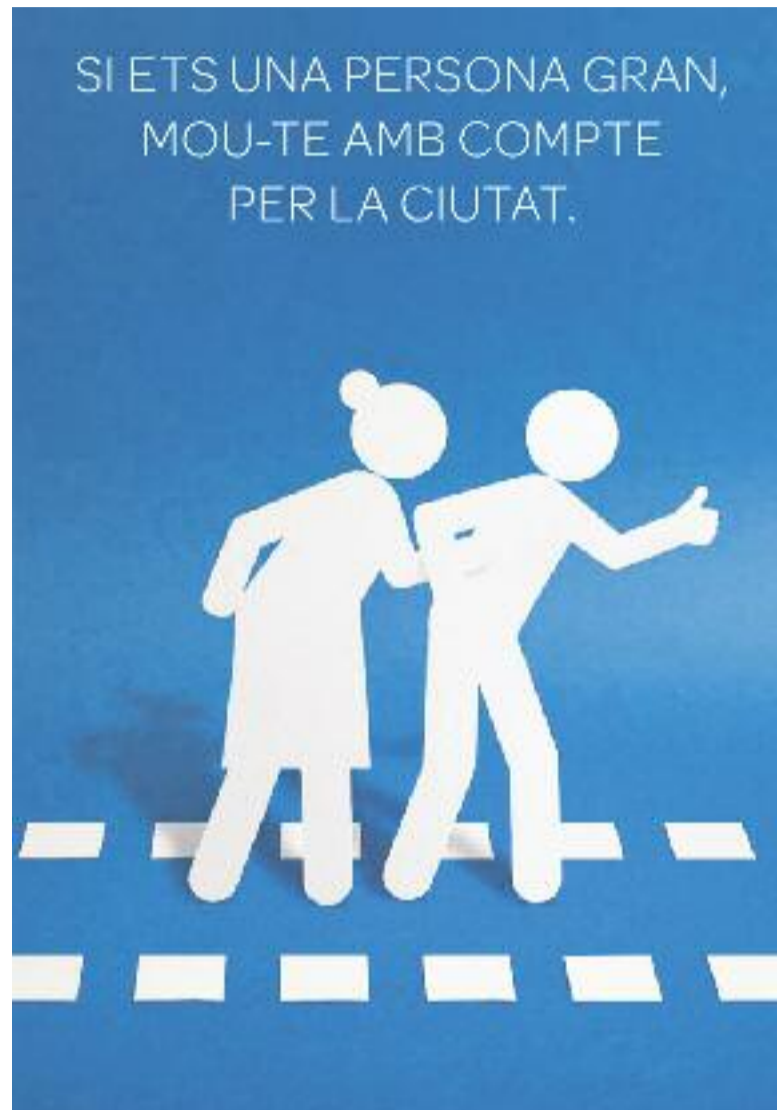
Impulsen una campanya per millorar la seguretat viària de la gent gran.