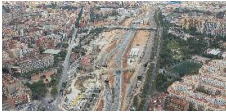
Vista aèria dels terrenys de la futura estació de la Sagrera.

Trias considera que aquestes obres "són molt importants" i recorda que un cop comença "no poden parar, són irreversibles". La nova fase d'actuació implica excavacions al subsòl,