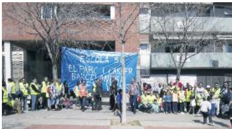
Acte de protesta d'Escola Sí, al parc No del dia 15.

L'escola ocuparia uns 2.000 metres quadrats de superfície verda del parc, una solució que rebutgen els veïns de la zona. De fet,