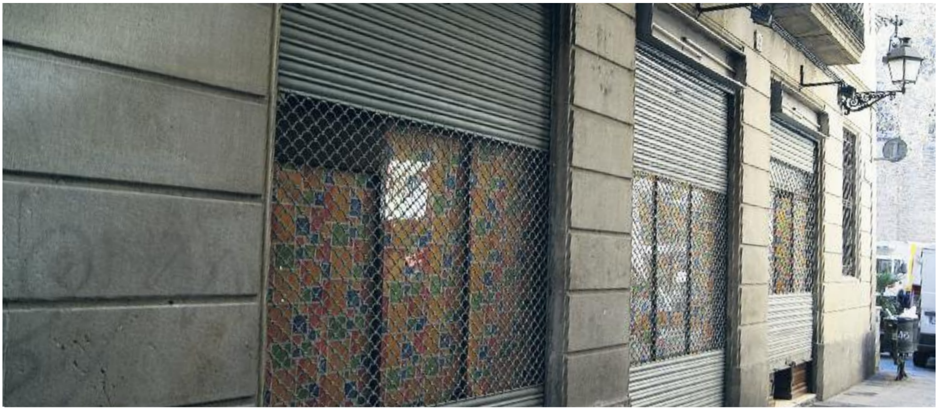
Molts comerços antics de la ciutat podrien patir el mateix destí que Juguines Monforte, que va tancar el passat gener.