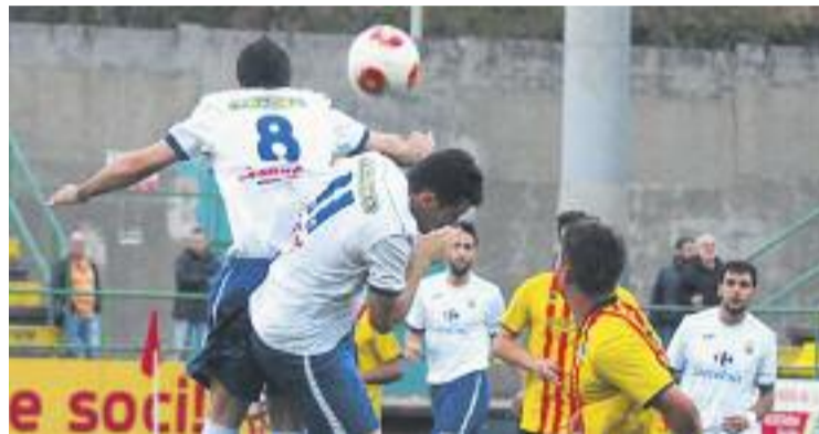
El Prat va ser superior als andreuencs durant tot el partit.

Els pratencs van sortir amb molta intensitat al terreny de joc i conscients del que es jugaven. Les primeres ocasions van