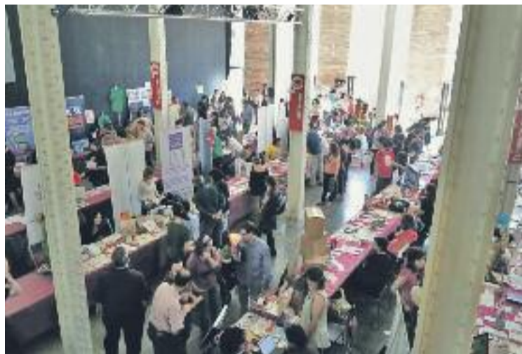
La Fira d'Economia Solidària a la Fabra i Coats.