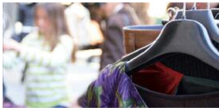
El Forastocks ofereix des de moda fins a òptiques.

L'esdeveniment tindrà lloc el pròxim dissabte dia 1 de març al carrer Gran de Sant Andreu, entre els carrers Malats i Rubén Darío. Des de l'associació comercial afirmen que una trentena de botigues associades a l'eix participaran en aquesta ja tradicional cita que cada any aplega "força gent", assegura Sans. Els productes que es podran trobar al Forastocks aniran des de roba fins a ulleres i complements.