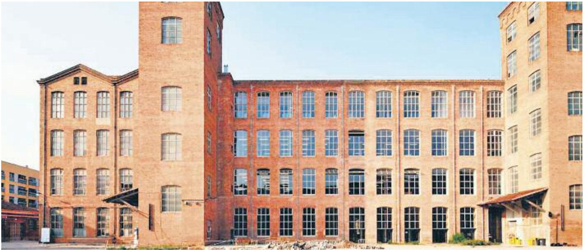
La Fabra i Coats és el nucli del patrimoni industrial i cultural de Sant Andreu i un dels grans reclams turístics.