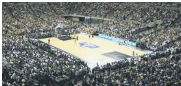
El Palau Sant Jordi acollirà les semifinals del Mundial.

BÀSQUET ▶ La ciutat de Barcelona serà una de les cinc seus oficials de la Copa del Món de Bàsquet que enguany se celebrarà a l'Estat del 30 d'agost al 14 de setembre. Per tal de començar a escalfar motors i celebrar que Barcelona torna a ser seu d'un esdeveniment esportiu mundial, s'han posat en marxa tota una sèrie d'activitats a tota la ciutat.