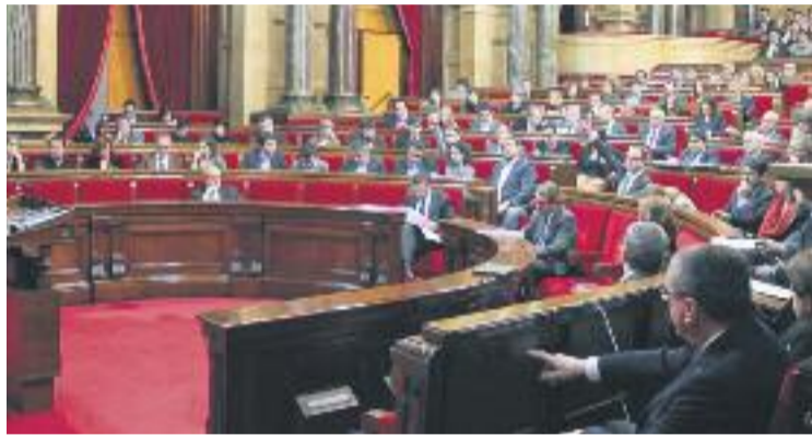
Aquesta llei va ser impulsada el març de l'any passat.

Des de la Confederació de Comerç de Catalunya s'ha valorat molt positivament aquesta nova llei, ja que "regula la situació creada pel recurs d'inconstitucionalitat del Govern espanyol", segons indica l'organització. Pel que fa a la Fundació Barcelona Comerç, l'aprovació d'aquesta nova normativa suposa "un punt i final al marc normatiu que ha de