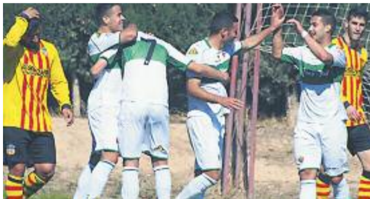
El Sant Andreu va caure davant el filial de l'Elx per 2 a 0.

La darrera va ser contra el filial de l'Elx a domicili (2-0), un equip que està donant la sorpresa a la competició i que no va atorgar gaires opcions als de Sant Andreu. En el segon partit de Cifuentes a la banqueta quadribarrada, el nou entrenador va destacar la bona actuació del seu equip durant la primera part del