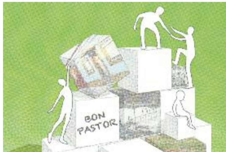
Imatge de la campanya.

Un cop recollides les fotografies (entre els dies 9 i 14 de febrer) els veïns treballen ara en petits grups, en format de tallers, per buscar la manera i els llocs on exposar-les públicament a tots els veïns i veïnes.