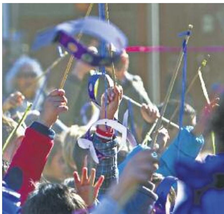
Un moment del Carnaval de Barcelona de l'any passat.