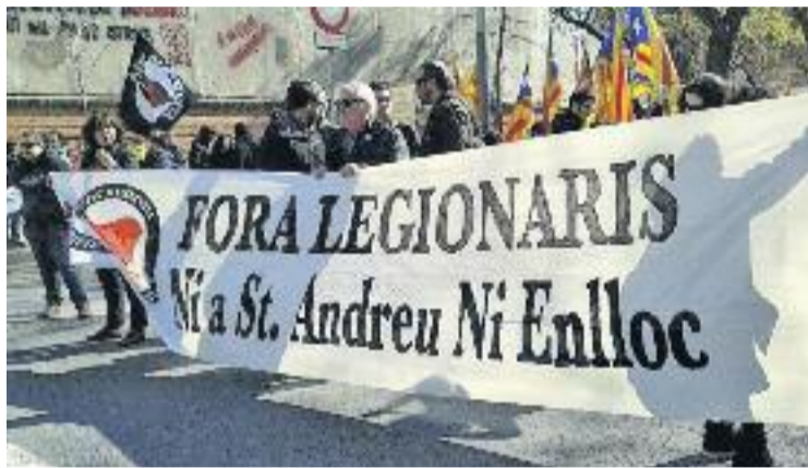
Pancarta contra els legionaris.

A les 11:30h del matí es va fer la concentració a la Plaça Orfila, on representants de diverses entitats veïnals van llegir textos i van fer parlaments en contra de la presència militar al barri. Després, l'escriptor andreuenc Jaume Copons va llegir un manifest signat per una vuitantena