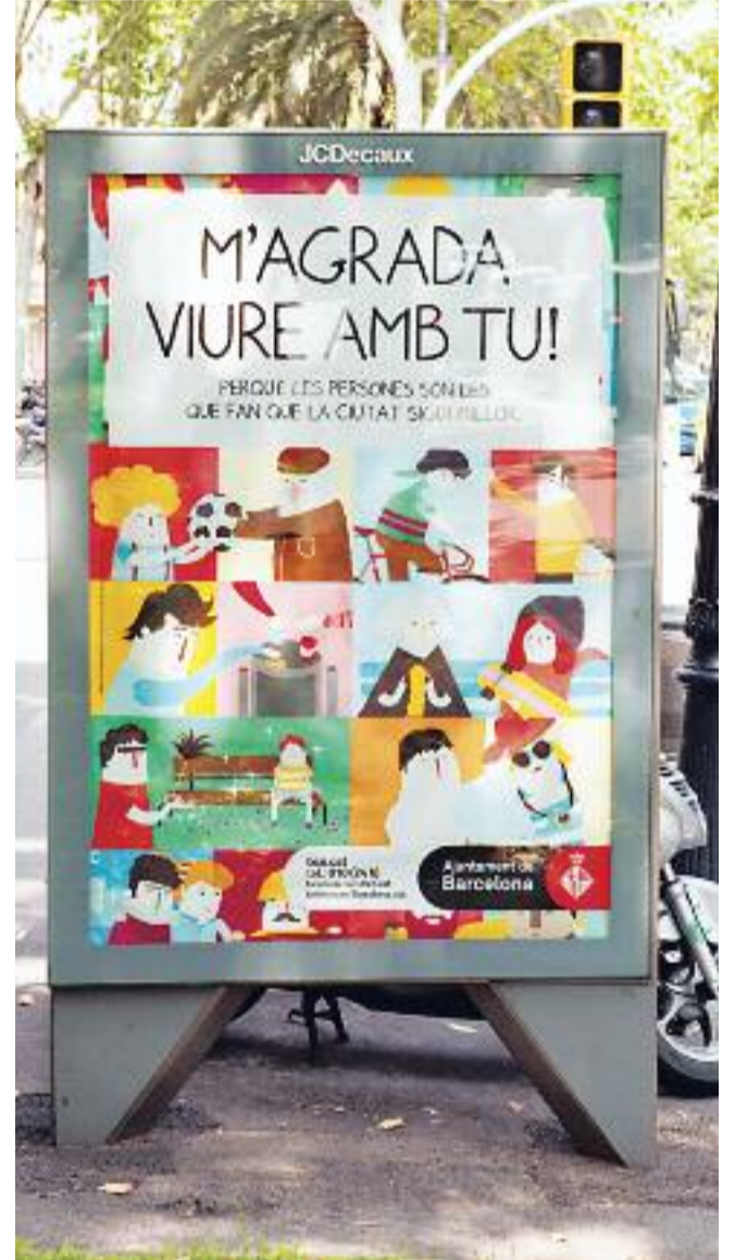
Una imatge del barri (a dalt), una activitat a l'Espai Via Barcino (a baix) i una imatge de la campanya M'agrada viure amb tu (a la dreta).