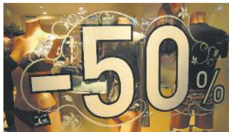
El fred ha trigat en arribar, i això ha influït la campanya de rebaixes.