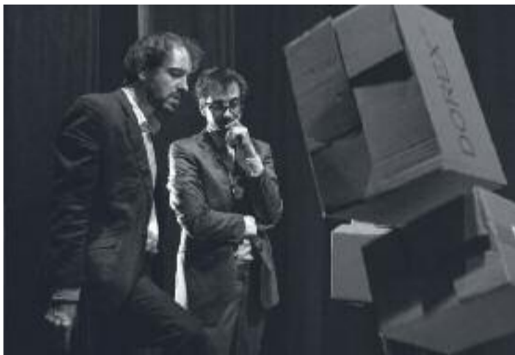
Una imatge de l'obra Pensa malament i encertaràs .

L'obra és una creació col·lectiva, dirigida pel dramaturg Raimundo Morte, emergent i amb un format experimental. La presentació està prevista, si tot va bé, de cara a la primavera.