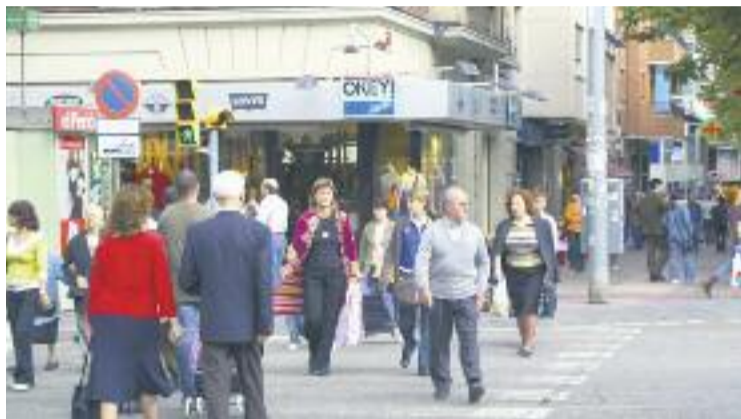
Els consistoris podran escollir els dos nous dies d'obertura.

La tria d'aquests dos nous dies d'obertura quedaran en mans dels ajuntaments. "Està bé que hi hagi més festius oberts, però que es col·loquin en aque-