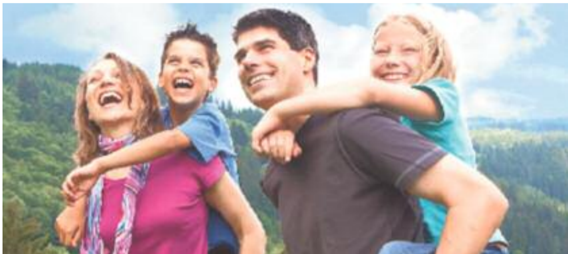
El programa Vacances en família arriba a la desena edició.

La primera convocatòria del programa Vacances en família és per a estades entre el mes de març i setembre. El període de preinscripció serà del 3 fins al 24 de febrer i les preinscripcions es podran fer per internet. Enguany hi ha nous albergs disponibles i una nova eina de gestió de reserva i preinscripció.