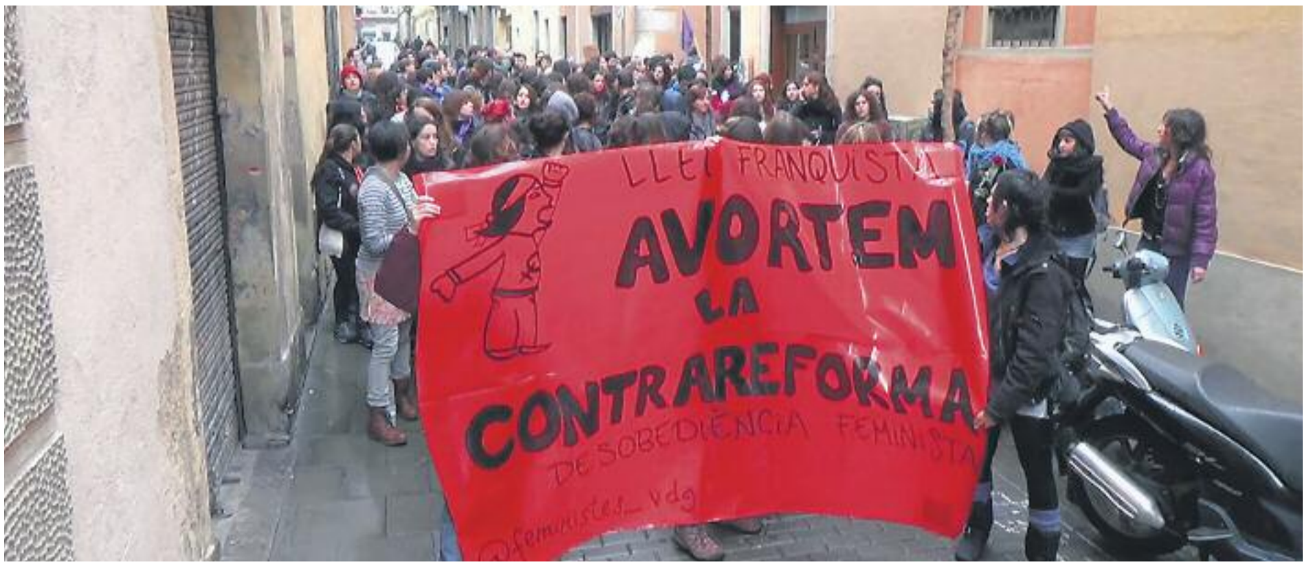
La manifestació de dissabte 18 de gener a Barcelona a favor de l'avortament lliure i gratuït.