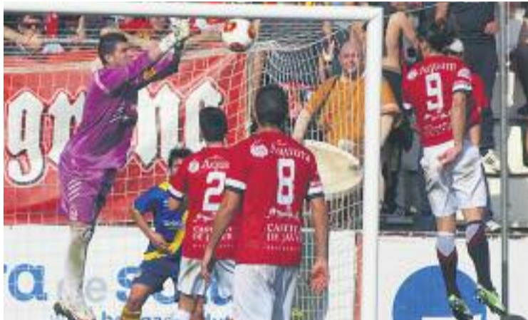
El Sant Andreu va aguantar molt bé l'atac tarragoní.

El Nàstic de Tarragona va ser el dominador del partit, i l'equip que va gaudir de més ocasions, tot i que no les va poder