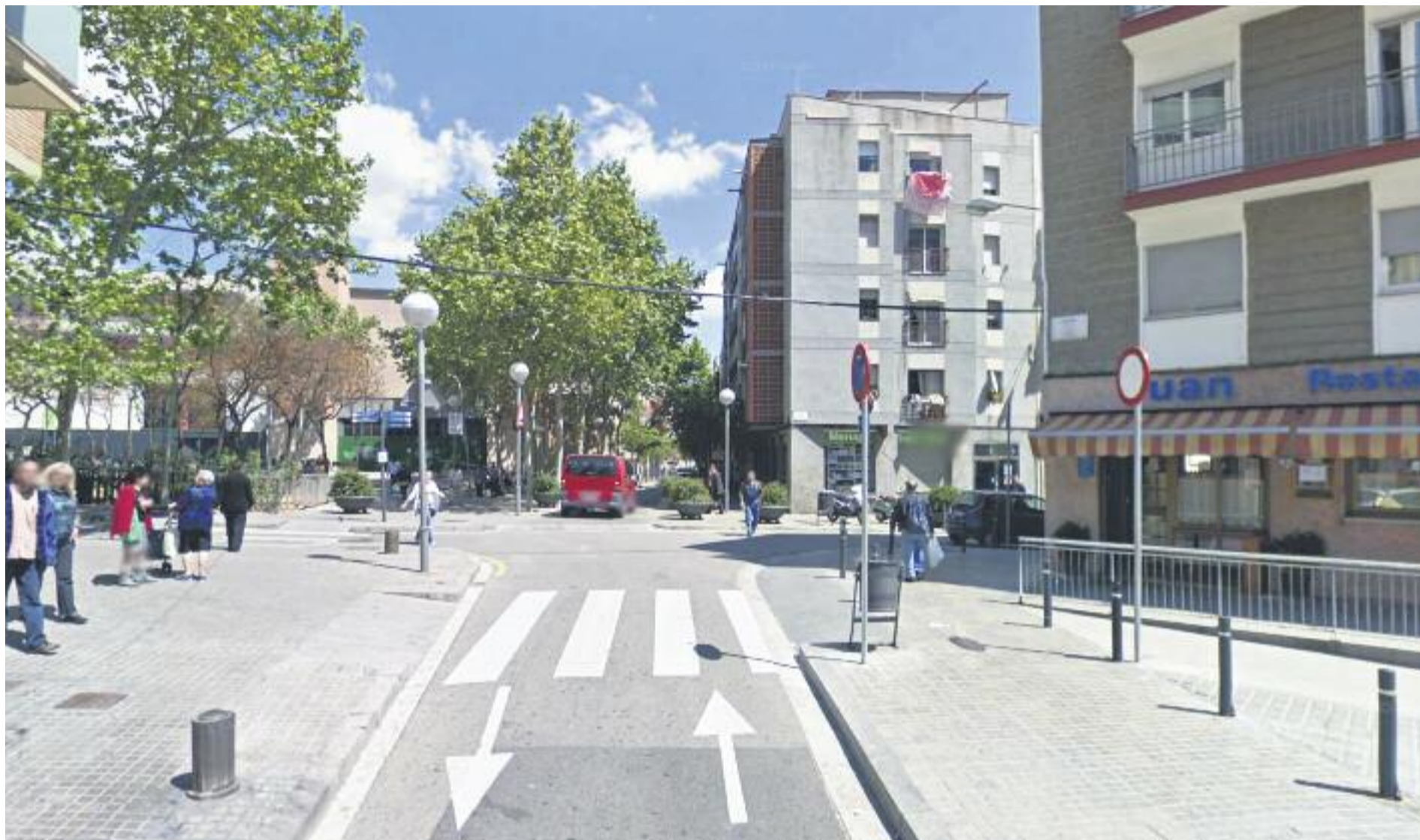
Els microcrèdits han de servir per ajudar a millorar un barri molt tocat per la crisi.

El Pla Integral de Trinitat Vella va néixer com a eina per donar suport a la cohesió social del barri un cop finalitzat el Pla de Barris vigent en el territori durant el període 2006-2011. El seu objectiu principal és avançar cap a un model de ciutat més inclusiva, treballant per reduir les desigualtats socials, afavorint la igualtat d'oportunitats en el barri i avançar en la millora de l'espai públic.