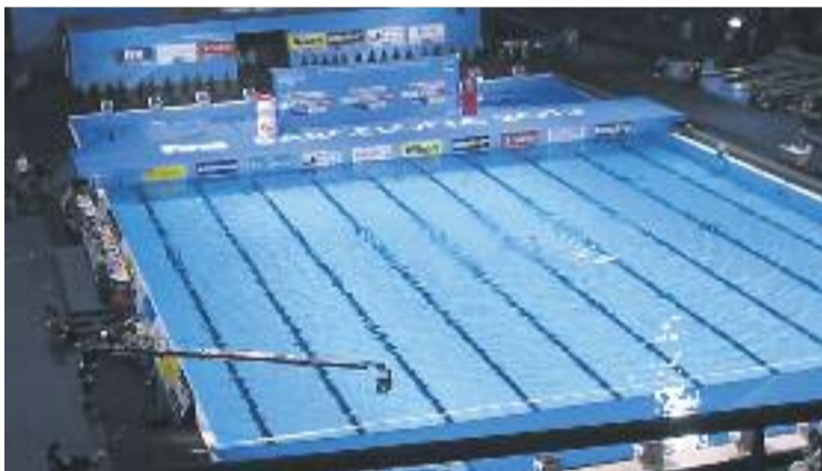
Els Mundials de l'agost van ser un gran èxit d'organització.

WATERPOLO ▶ Barcelona es convertirà durant el 2014 i el 2015 en la seu de la Final Six LEN Champions League, la competició final de la Lliga europea de waterpolo masculí.