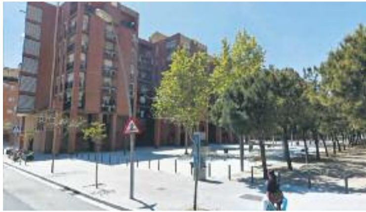
Baró de Viver és el barri més pobre del districte.

Destaquen les dades de 2012 referents a la renda familiar, les quals indiquen que a Sant Andreu és de 13.790 euros l'any, molt per sota de la mitjana de la ciutat, de 18.912 euros. Agafant la dada de Barcelona com a índex 100, la renda de Sant Andreu és de 72,9 i només supera