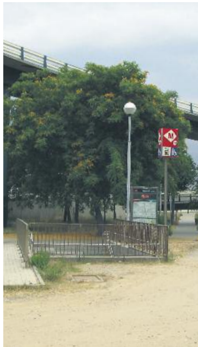
Les places de la Mainada i de l'Assemblea de Catalunya i l'entorn del metro de Baró de Viver abans de les reformes.