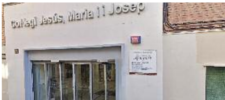
El centre, envoltat per la polèmica després del cas del capellà.