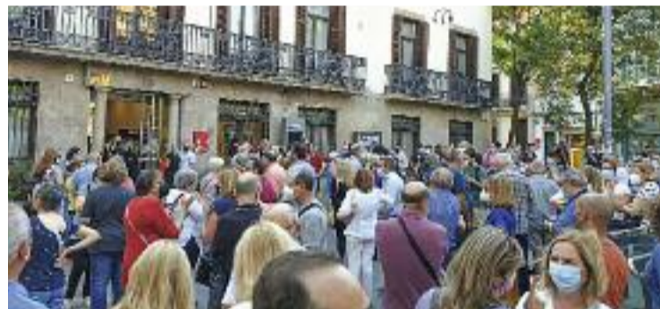
El Porta a Porta ha generat protestes.

RESIDUS ▶ Ja fa més d'un mes que va començar a funcionar el sistema de recollida de residus Porta a Porta a Sant Andreu i la polèmica segueix.