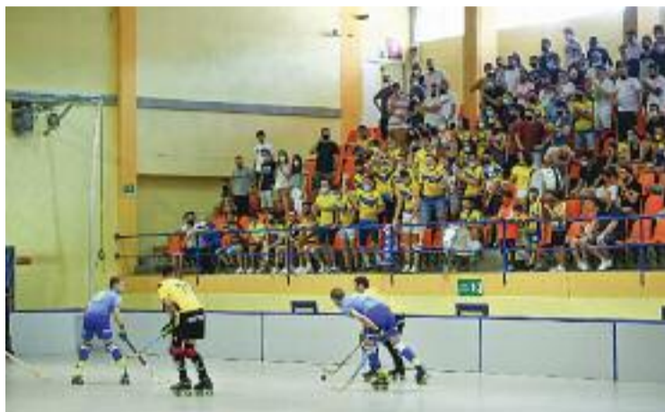
Un moment del darrer partit jugat a Vic.

La derrota, doncs, feia que la sèrie tornés a la capital de la Garrotxa, on els de Setién tornaven a no tenir el factor pista a favor. L'enfrontament a Olot, però, va començar de la pitjor manera possible: els del Congrès van