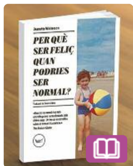
Per què ser feliç quan podries... Jeanette Winterson

Quan Jeanette Winterson va confessar a la seva mare que s'havia enamorat d'una noia, va rebre una resposta que la marcaria per sempre més: "Per què ser feliç quan podries ser normal?". Aquesta és la història d'una dona que no es rendeix, d'un esperit lliure que es va refugiar en els llibres i en l'afecte per sobreviure en un món que no acceptava la seva manera de viure.