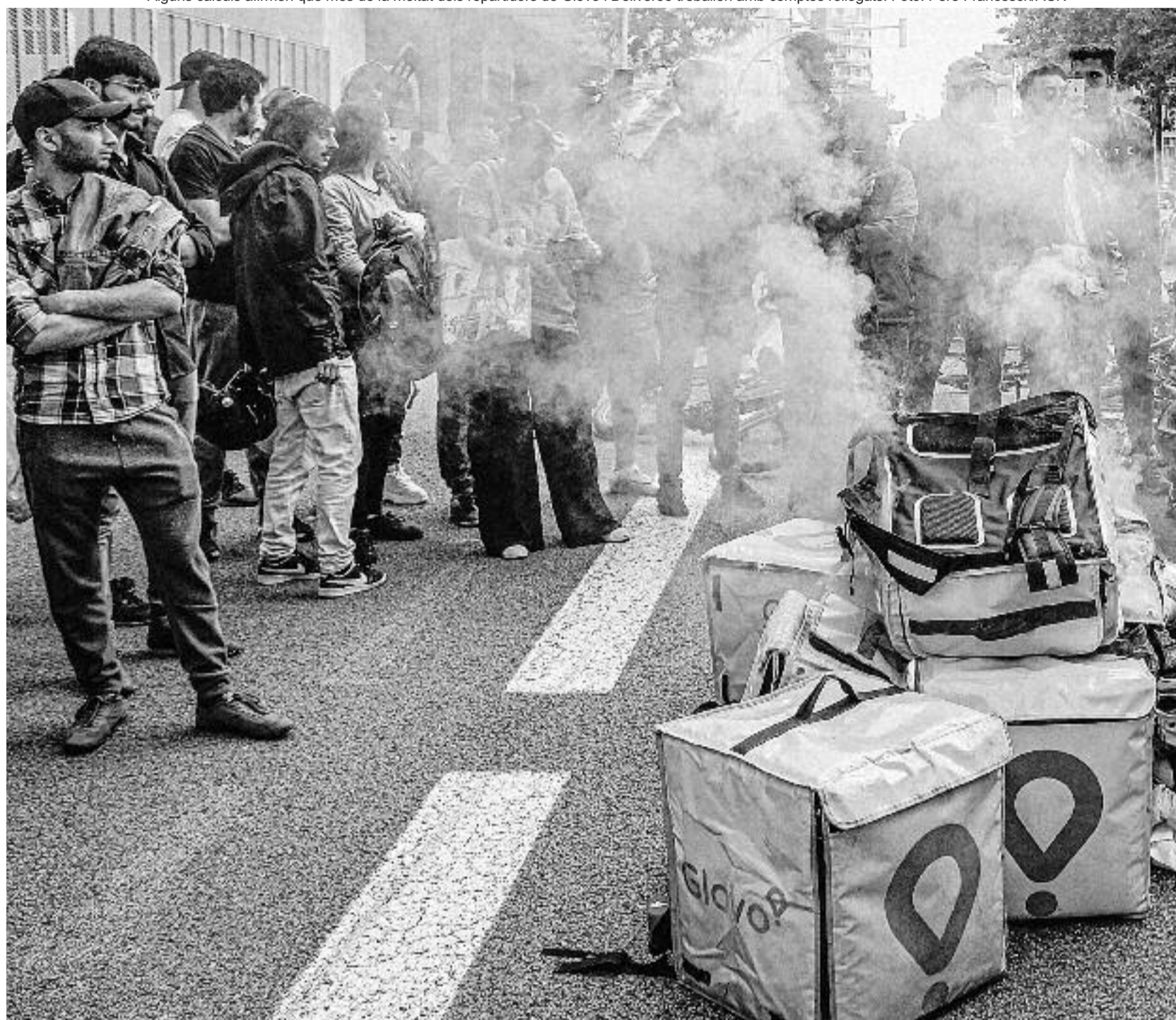
Alguns càlculs afirmen que més de la meitat dels repartidors de Glovo i Deliveroo treballen amb comptes rellogats.