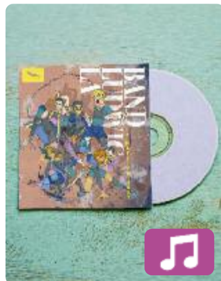
La mateixa sort La Ludwig Band

La Ludwig Band acaba de publicar el seu segon disc, La mateixa sort (The Indian Runners, 2021). El grup d'Espolla (Alt Empordà) va triomfar entre els joves catalans l'any passat amb Al límit de la tonalitat , i amb aquest nou àlbum torna a oferir una bona dosi de folk-rock. La dotzena de cançons que formen el disc ja estan triomfant a Spotify i YouTube.