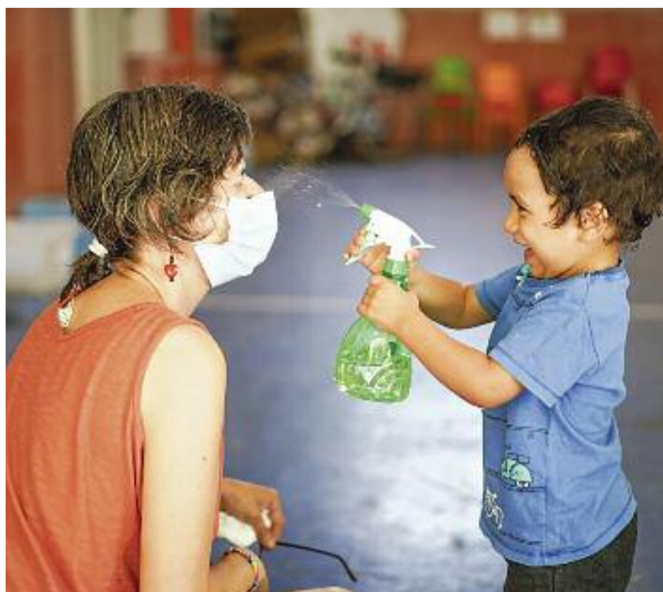
Molts infants i joves passarien gran part de l'estiu mirant la televisió si no hi hagués casals.