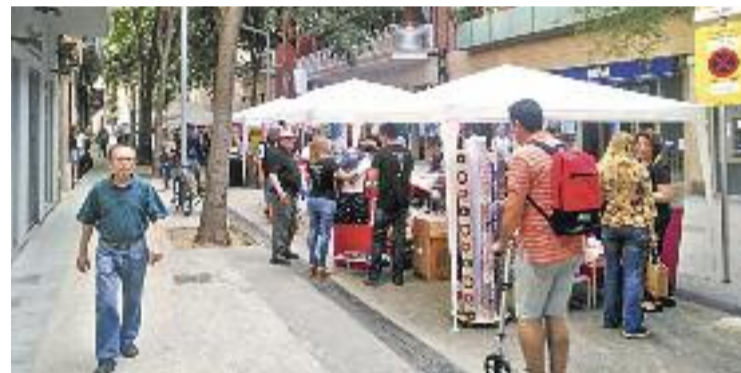
La jornada arrencarà a les 10 del matí.

D'altra banda, Puig, preguntat sobre la polèmica que està generant el nou sistema de recollida de residus Porta a Porta, creu que el comerç s'hi està adaptant relativament bé. "Ho estem fent bé", diu. Tot i això, Puig deixa clar que creu que hi ha força marge per millorar el sistema i lamenta "la manca de complicitat entre l'administració i els veïns".