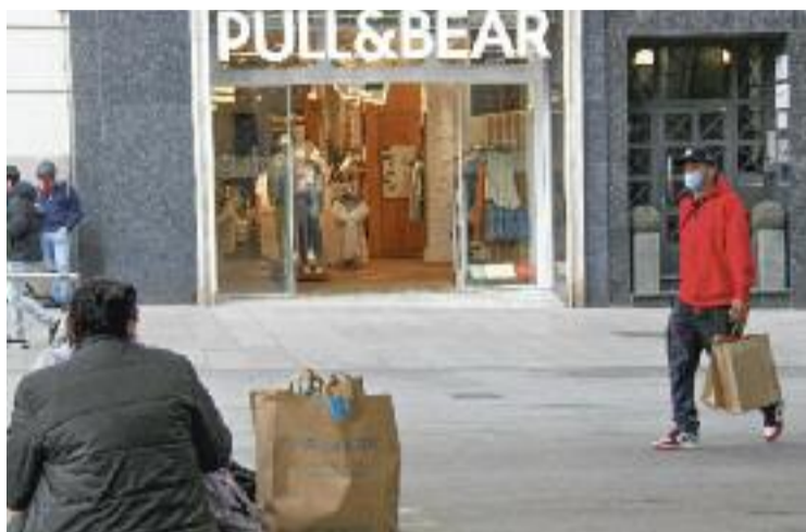
Façana d'una botiga al Portal de l'Àngel.

"La caducitat implicaria que entraria en vigor la normativa espanyola, que sense una res-