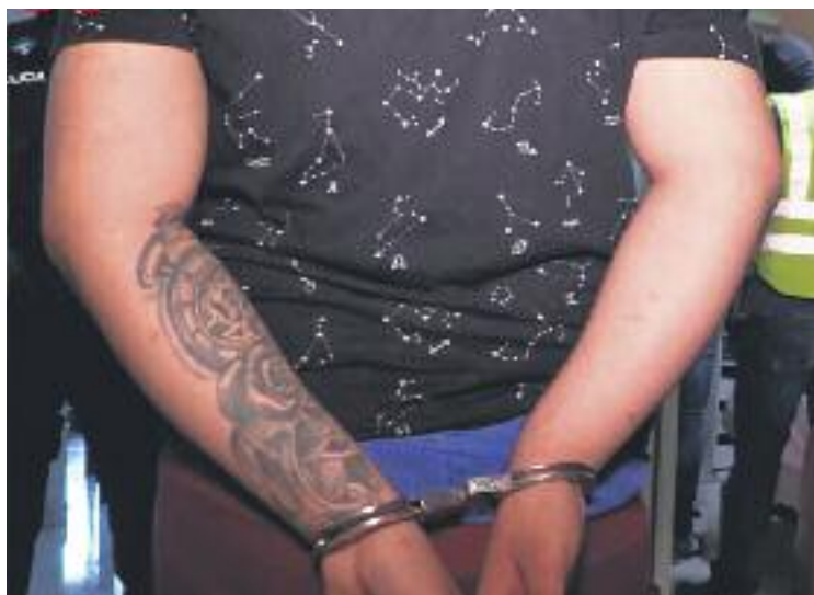
Un dels integrants de la banda, detingut.

La investigació policial va començar el passat mes de novembre, quan els Mossos d'Esquadra van detectar un augment de robatoris violents al barri del Verdum. Segons la policia, els casos del Verdum els van començar a cridar l'atenció perquè tenien unes característi-