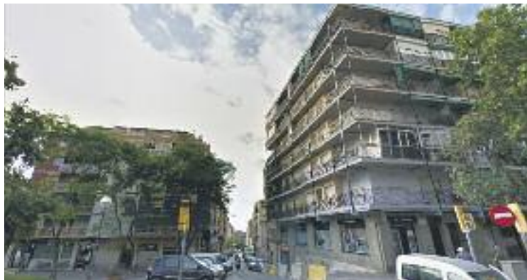
El mercat del lloguer segueix a l'alça a Nou Barris.

Aquestes xifres, doncs, situen Nou Barris com el districte que està notant més l'escalada dels preus del lloguer a les zones més perifèriques de la ciutat. Mentre que el lloguer ha frenat la seva escalada al centre de la ciutat, l'augment que s'ha produït a Nou Barris només té unes xifres similars en el cas de Sants-Mont-