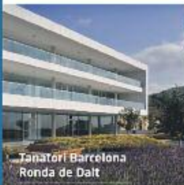
Funerari Barcelona Ronda de Dalt

A ÀLTIMA preparem i dissenyem els serveis funeraris juntament amb les famílies, adaptant-nos als seus desitjos i a les seves necessitats. Per això, a ÀLTIMA sempre és la família qui decideix l'import total del servei contractat.