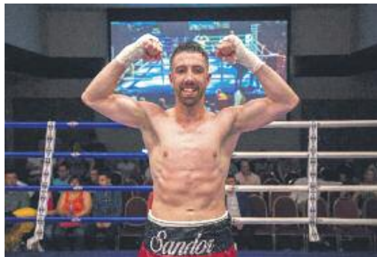
El púgil, eufòric després de guanyar a Madrid.