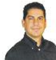
Javier Barreña Conseller del PP al districte de Nou Barris