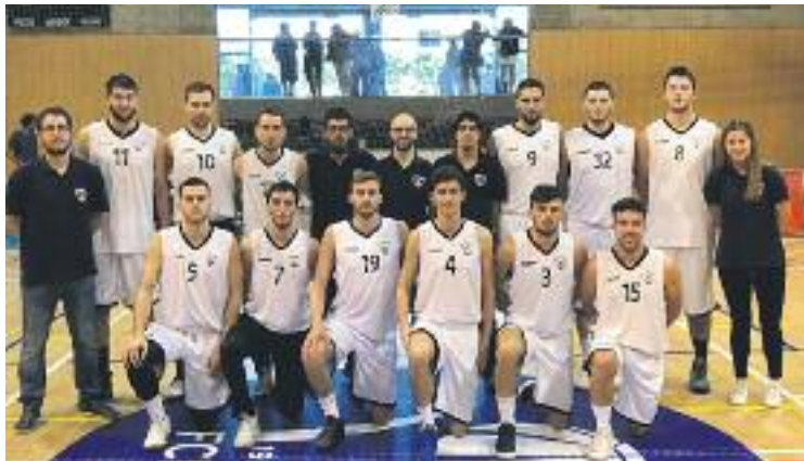
El club confiarà en el bloc que s'ha guanyat l'ascens.

D'aquesta manera, si la FEB confirma l'ascens, el SESE seria el