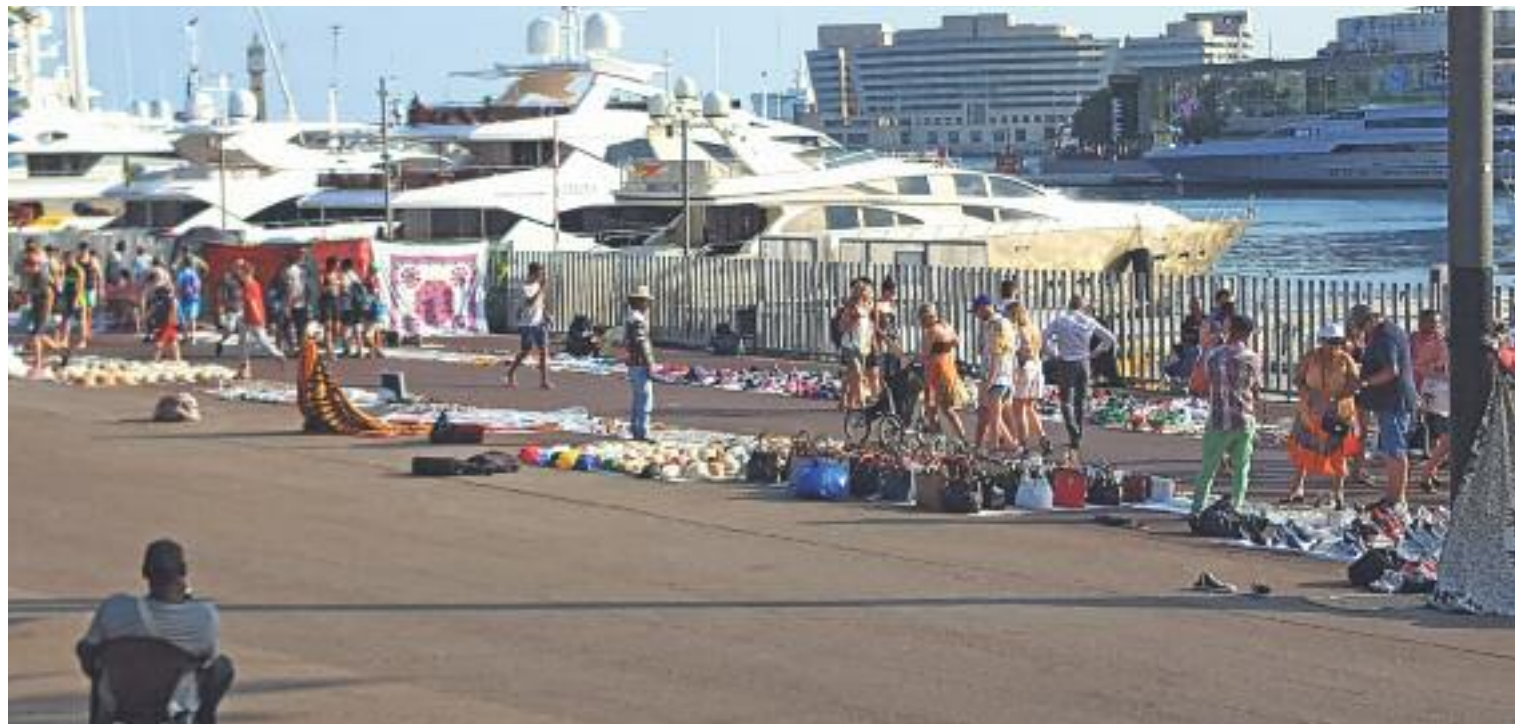
La venda ambulants il·legal, diuen els comerciants, ha augmentat en els últims anys.

Les entitats firmants del text també van voler deixar clar que les seves queixes es dirigeixen cap a l'Ajuntament, per la seva “in- suficient” resposta envers aquest fenomen, i no cap als venedors del Top Manta. La denúncia, va afirmar Villar, és contra l'activi-